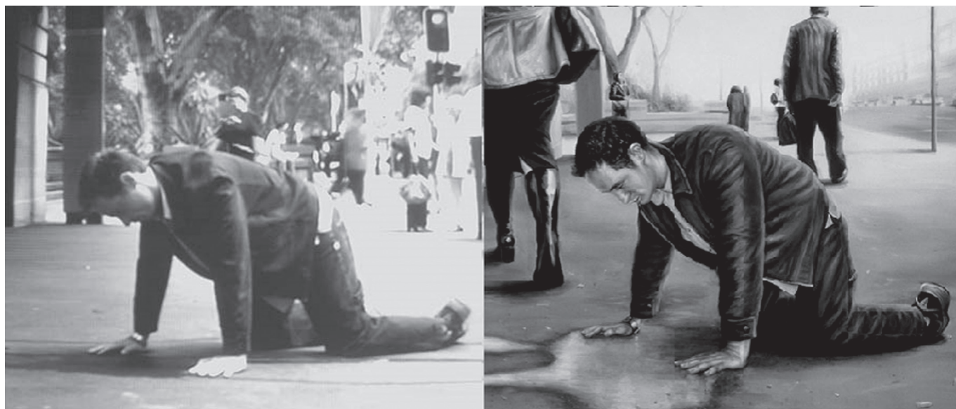
2. kép. Jobbra: James Cochran: Narcissus (olajfestmény). Balra: részlet a szerző azonos című videoinstallációjából