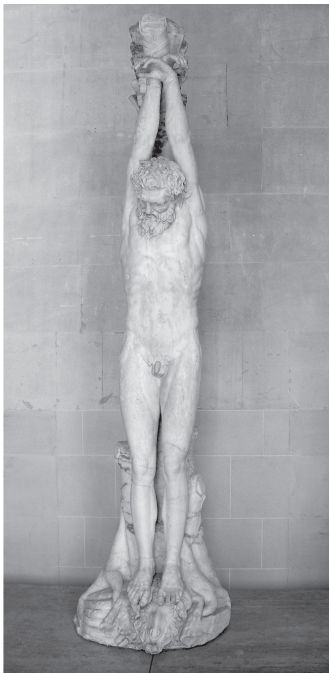
1. kép. Marsyas megkínzása. Kr. e. 250–200 körül készült görög eredeti római kori márványmásolata (Párizs, Louvre)

Ugyanígy szerkezetként látatja az emberi testet a Szellős, árnyékos című szöveg precíz szóhasználatával, amelyben a megnyűzó szakszerű, fragmentáló tekintete bőrre, húsrá, csontokra és vérré bontja a korpuszt. Az egész szerkezet kiténtetett helyzete miatt a vers első sorai az egész kötetre érvényes önreflexív gesztusként is olvashatók („Nem volt olyan nézőpont, amiből az egész / szerkezetet be lehetett volna látni”), azt sugallva, hogy nincs olyan értelmezői pozíció, amelyből az egész mű felfejthető volna. Mindvégig kontrasztot teremt a mitológiai kontextus miatt felsejülő elgyötört, megkínzott test és a precíz, szakszerű attitűd, így a natura és creatura , techné vala-