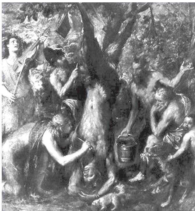
2. kép. Tiziano: Marsyas megnyúzása. 1576, olaj, vászon (Kromeriz, Állami Múzeum)