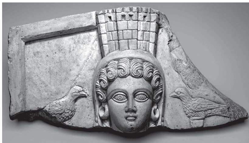
7. kép. Tyché ábrázolása Durából (Goodenough 1956–1968, vol. 11, 160 nyomán)

Szerinte Esztert éppolyan tudatosan ábrázolták istennőre emlékeztető vonásokkal, mint ahogy az ő olvasatában a lovon ülő Mardokeus a szíriai lovas istenség, Genneas megfelelője. 26 A panel művésze véleménye szerint azt akarta aláhúzni alakjaikkal, hogy a zsidók isteni segítséggel állnak a pogányok uralma fölött. 27 Goodenough értelmezése megint csak problémás. Először is,