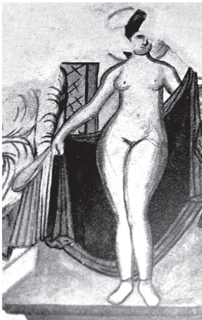
4. kép. Aphrodité ábrázolása a durai „Írnok Házából” (Baur 1936, Pl. XLIII nyomán)