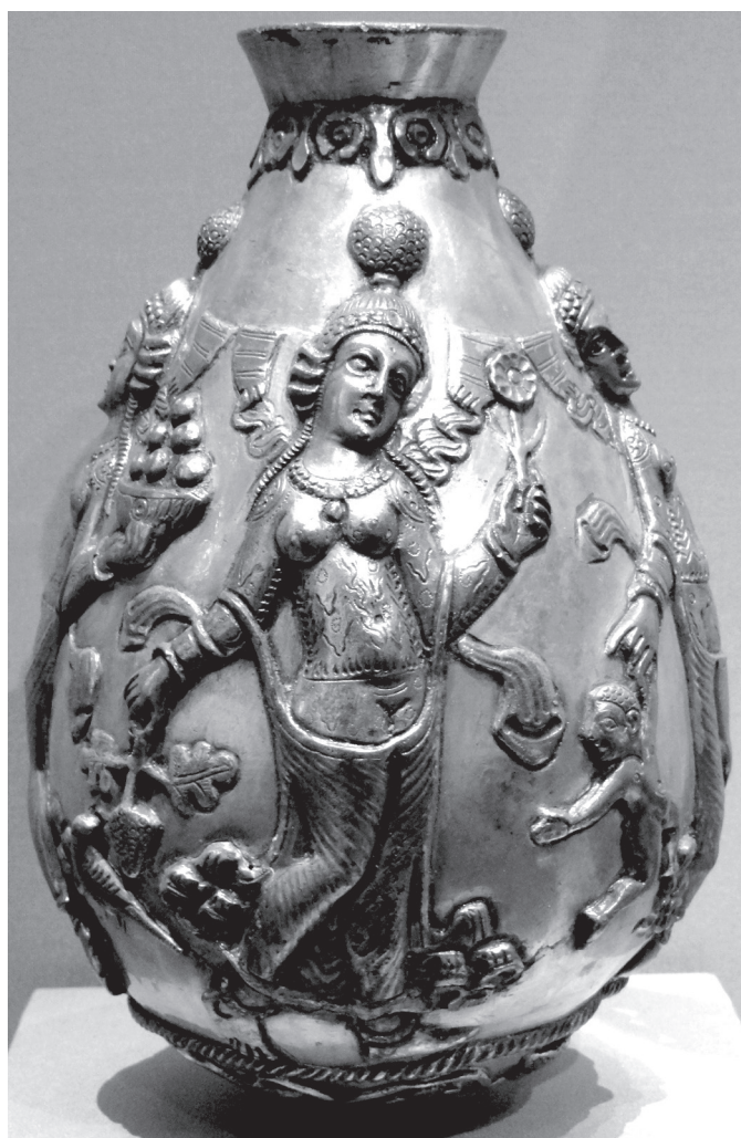
2–3. kép. Szászánida ezüstedények Anahita ábrázolásával

nyuló 6 – jelenete az Exodus könyve kezdetén elbeszélte törté- nések részleteiből építkezik (1:15–2:10). Bár a festmény alsó része károsodottan maradt fenn, mégis úgy látszik, hogy a je- leneteket a panel alsó negyedében a sással övezett part mel- lett végigfolyó Nílus ábrázolása biztosítja. Az első jeleneten ( Exodus 1:15–16) a kísértői által körülvev, trónon ülő uralkodó megparancsolja a bábáknak a születendő héber fiúgyermek megölését. 7 Az ezzel egybekomponált második jelenet egy a folyó fölé hajló nőt ábrázol: minden bizonnyal Mózes anyját, Jókebedet, amint az újszülött gyermekét rejtő kosarat a Nílus- ba helyezi ( Exodus 2:3). A panel harmadik jelenetének köz- ponti alakja a fáraó lánya: a folyóban fürödve éppen megta- lálja Mózeset a sás között; cselédjei pedig a partról figyelik az eseményeket ( Exodus 2:5–6). Végezetül, a negyedik jeleneten Mirjam közbenjárására Mózeset az anyjának adják, hogy szop- tassa őt ( Exodus 2:7–9).