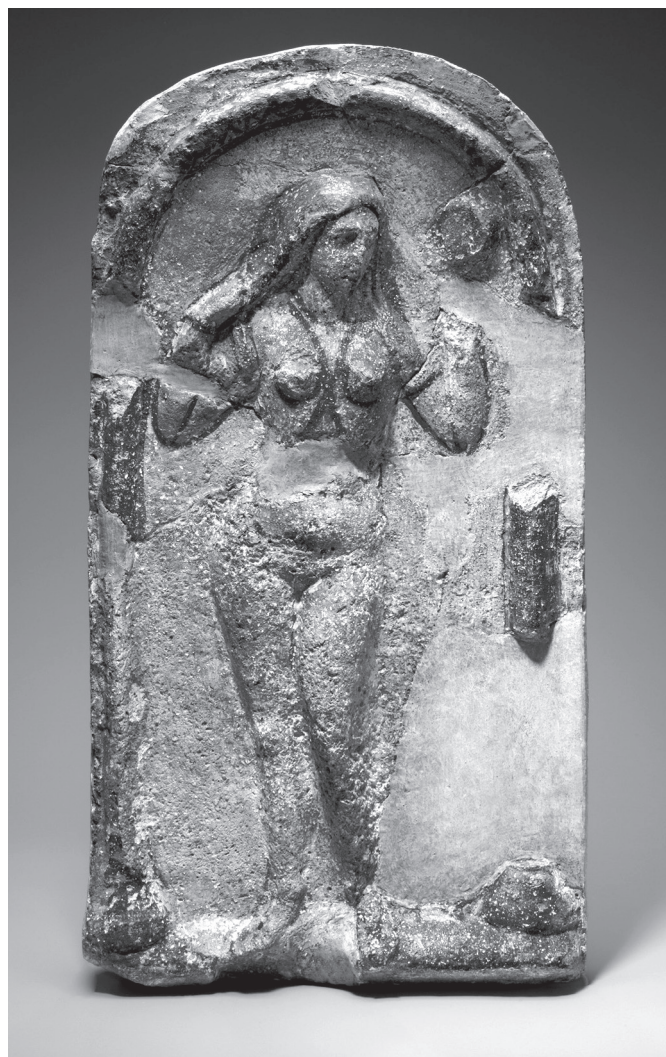
5. kép. Aphrodité Durából (Brody–Hoffman 2011, 367 nyomán)

római összefüggést keresett. Ugyancsak ikonográfiai alapon a fáraó lányának társalkodónőiben a nymphák ábrázolását látta, és amellett érvelt, hogy e mitológiai lények együttes szerepe Mózes Wunderkind mivoltának alátámasztása lenne. 12