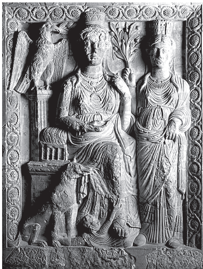
9. kép. Zenobia és kísérlője. Dombormű Palmyrából

az ikonográfiai párhuzam Mardokeus és Genneas között meglehetősen erőltetett. Tartása, öltözete és fegyverzete egyszerűen királyi megjelenésére utal (vö. Eszter 6:8, valamint lásd pl. a zsinagóga EC 1 paneljén Saul ábrázolását), és iráni előkelőségek ábrázolásaira emlékeztet. 28 Másfelől kérdéses, hogy a különböző vallások nyüzsgő egymásmellettsége által jellemzett Durában a zsidók éppenséggel pogány istenségek analógiájára