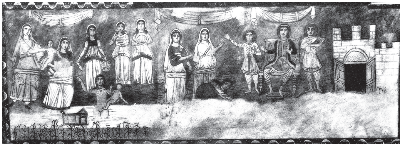
1. kép. Durai zsinagóga, WC 4 panel (Goodenough 1956–1968, vol. 11, 338 nyomán)

Ez a négy méter hosszúságú panel a nyugati fal alsó regiszterében, a tórafülkétől jobbra levő falfelület szélén helyezkedik el (1. kép). 5 A kép rendkívül összetett kompozíció: négy – egymást jobbról balra követő, azaz a fal központi tengelye felé irá-