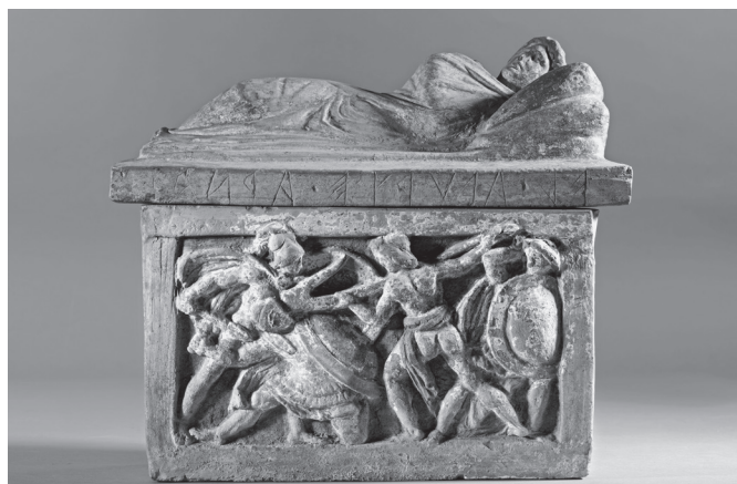
12. kép. Etruszk terrakotta hamvurna, Kr. e. 2. század vége