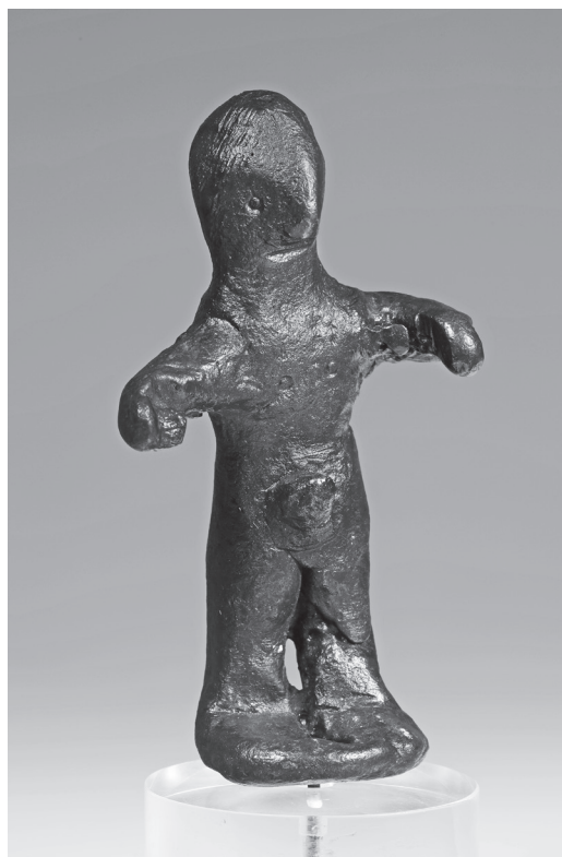
3. kép. Latiumi (?) bronz férfiszobor, Kr. e. 9–8. század

Az importált és más módon is megismert görög művészet hatása a 8. századtól nyomon követhető az etruszk művészetben. Egy a 6. század közepe táján készült kisbronz ifjú-, ún. kuros-szobor a perzsák elől Itáliába menekülő keleti görög művészek stílusának hatását mutatja, de jellegzetesen helyi feldolgozásban. Társait egyelőre kizárólag Rómában és tőle délre,