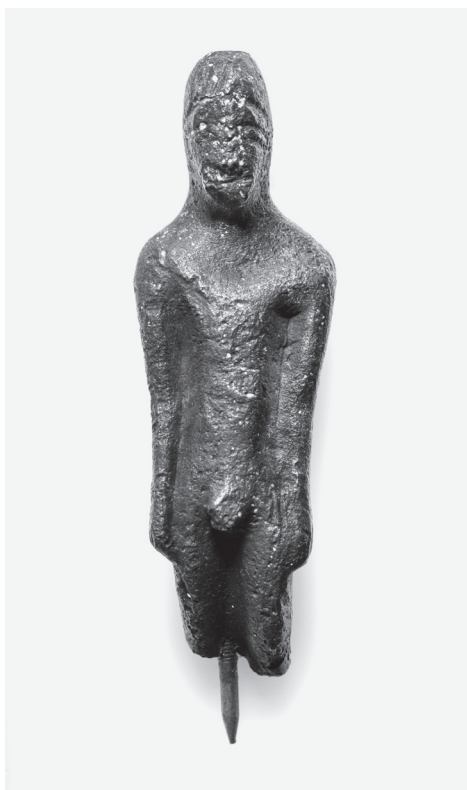
5. kép. Latiumi bronz kuros-szobor, Kr. e. 6. század közepe