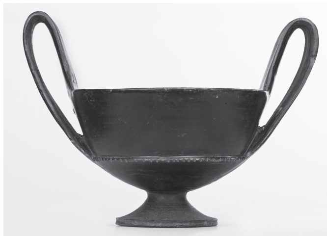
4. kép. Etruszk bucchero kantharos, Kr. e. 7–6. század fordulója

Vele egyidős és szintén athéni műhelyből származik az ugyancsak ivóedényként használt másik kylix szifn és férfialak ábrázolásával. 12