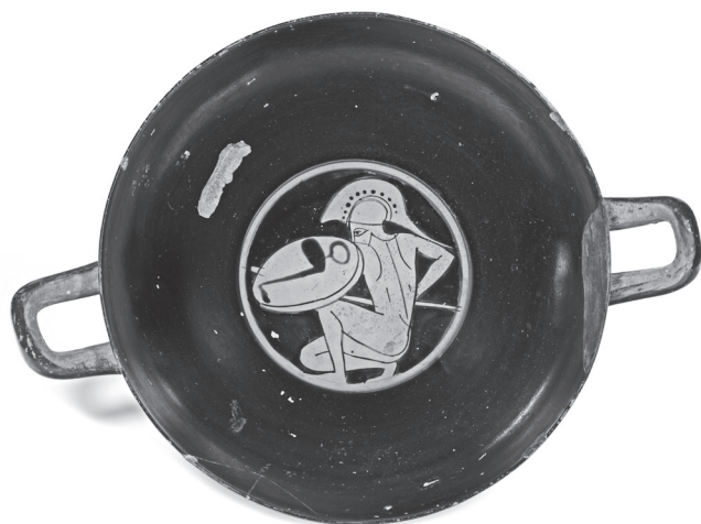
10. kép. Athéni vörösalakos kylix, Kr. e. 500 k.