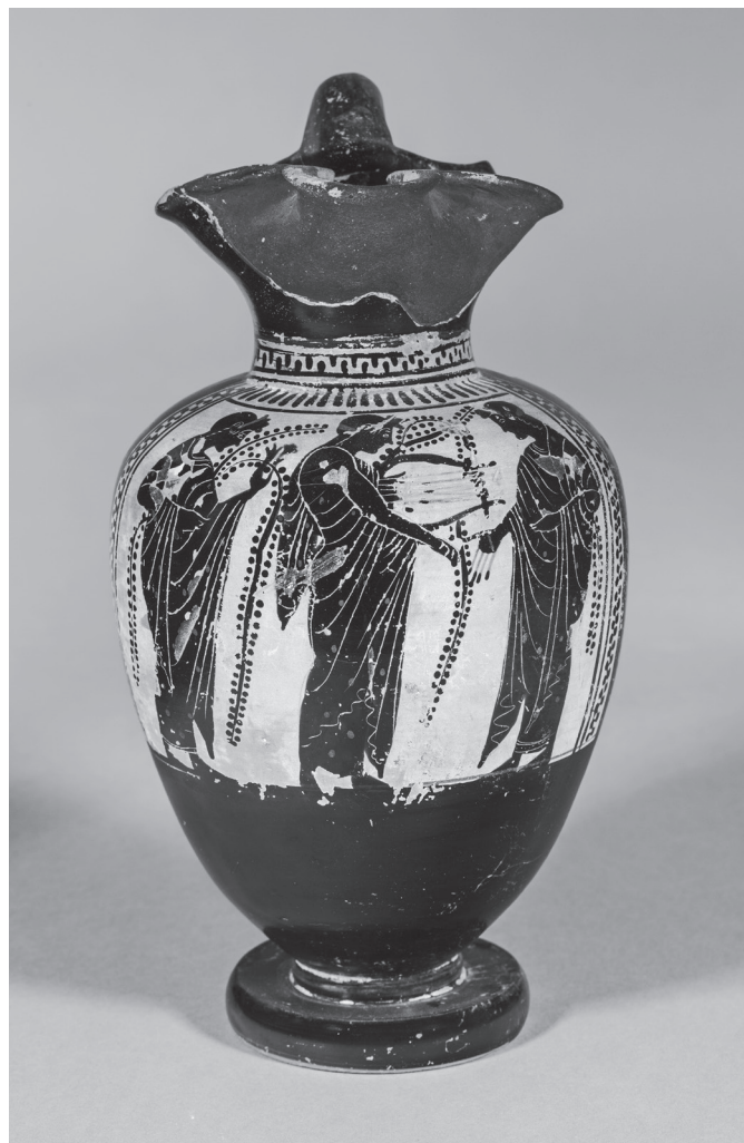
11. kép. Athéni feketealakos oinochoé, Kr. e. 480 k. Az Athéna-festő műhelyéből