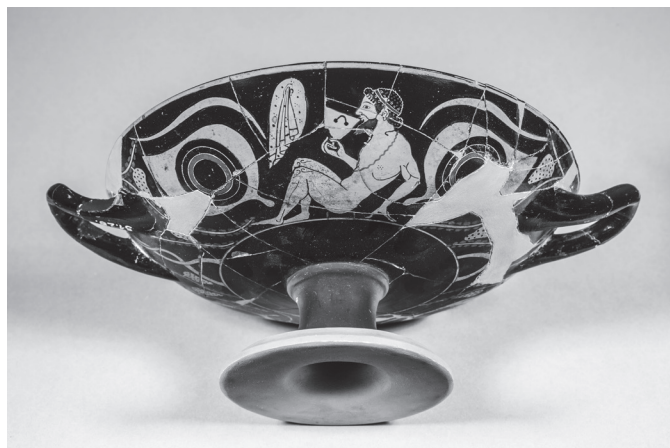
9. kép. Athéni vörösalakos kylix, Kr. e. 520 k. Andokidés-festő

A 400 körüli években dél-itáliai, valószínűleg tarentumi görög műhelyben készült váza töredéke egy férfi- és egy nőalak között felirattal jelzi, hogy Télegonos és Kirké mítoszának ábrázolását jelenítette meg (2. kép). 22 A mítosznak jelenleg ez