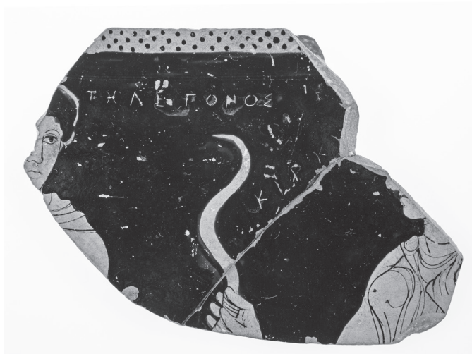
2. kép. A Télegonos-töredék, Kr. e. 400 k. Napernyő-festő

A gyűjtemény 1874-ben a Békés Megyei Múzeum megalapításának kiindulópontjává lett. Ellentmondó adataink vannak arról, hogy eredetileg hány tárgyból állt. Első múzeumi őrzője beszámolójában több mint 260 darabot említ, 5 ennél jóval realisabb azonban első tudományosnak szánt listájának tanúsága, amelyben a leltározással megbízott Pulszky Károly 133 darabot sorolt föl. 6