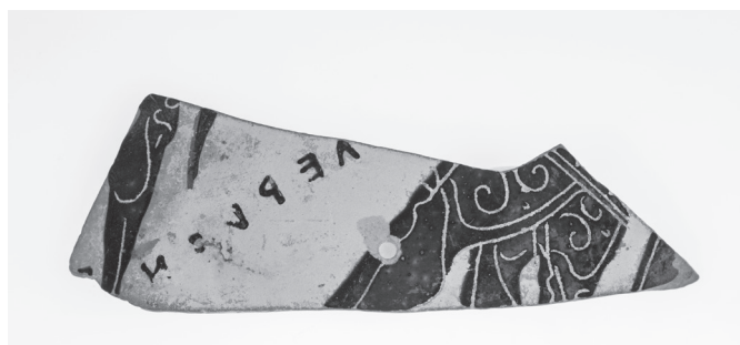
13. kép. Athéni feketealakos váza töredéke, Kr. e. 6. század vége