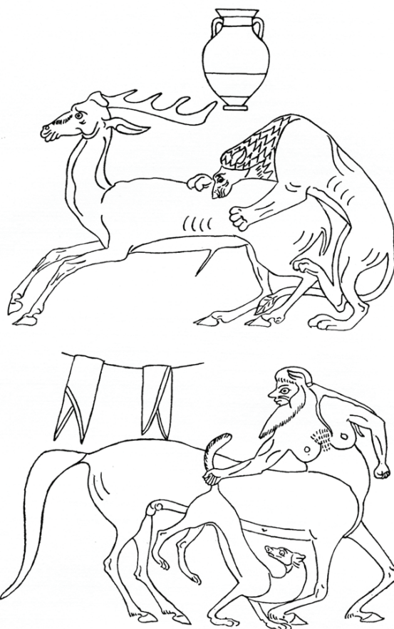
8. kép. A Borostyanlevél-festő amphorájának két oldaláról készült rajz