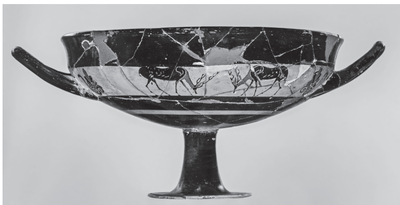
6. kép. Athéni feketealakos kylix, Kr. e. 540 k.