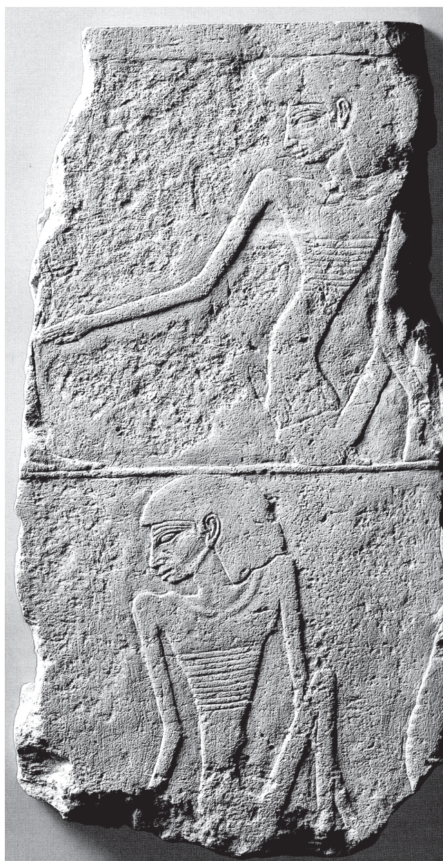
1. kép. Éhezőket ábrázoló domborműtöredék Unisz szakkarai halotti körzetéből, Óbirodalom (Louvre E 17381; Ziegler 1999, 360 nyomán)

Az éhezés ritkán volt témája az egyiptomi képi ábrázolásoknak. A kevés ismert példa közül a leghíresebb az 5. dinasztia végén, a Kr. e. 24. század utolsó harmadában uralkodó Unisz király szakkarai piramiskörzetéből származik. Az uralkodó halotti együttesének részeként a völgytemplomot a piramis melletti halotti templommal összekötő kövezett feljáró falának két fennmaradt töredékén csontsovánnyá fogyott, elcsigázott, egymást támogató vagy magukba roskadtnak ülő férfiakat és nőket