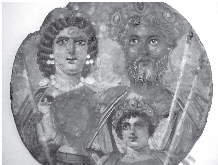
3. kép. Septimius Severus, az afrikai származású császár és családja. Az ún. Severus-tondo (falpra festett kép). Kr. u. 200 k. Antikensammlung Berlin

A római szerzők többször reflektáltak arra a tényre, hogy az emberi bőrnek van színe, vannak árnyalatai. Cicero és Ammianus Marcellinus is megemlíti, hogy a haragtól vagy dühtől az ember arcának színe megváltozik. Nem csupán a bőr színe, hanem más külső jegyek is mutatják a felfokozott kedélyállapotot, így a hang, az arckifejezés vagy éppen a mozdulatok. 25 Mindkét szerzőnél a bőr színe, helyesebben annak változása belső, lelki folyamatok tükröződése, amelyek azonban egyaránt negatívak: az ira , insania , furor fogalmakkal kapcsolhatók össze. A bőr színe, amely a kedélyállapotnak megfelelően – igaz, csak ideiglenesen – megváltozik, a jellemet, a belsőt fejezi ki.