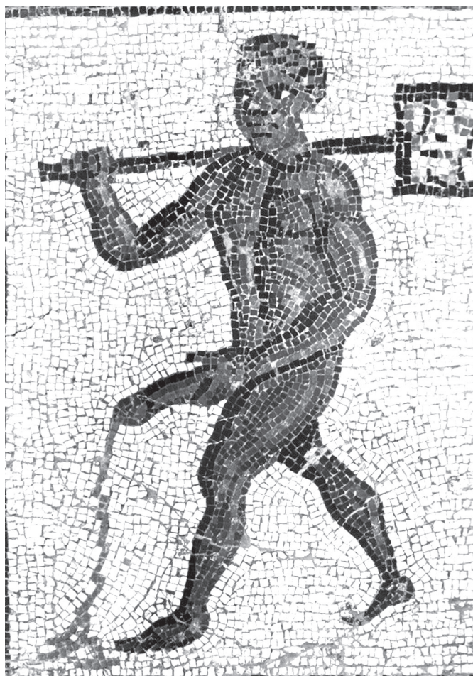
6. kép. Mozaik Timgadból (Thamugadi, Algéria) Kr. u. 100 k.

A római szerzők szerint az éghajlat objektív tényezői miatt alakul ki az emberek külső megjelenése, de ennek vannak belső implikációi, voltaképpen jellembeli vonatkozásai. Talán Cicero is valami hasonlóra utalhatott, amikor Piso külsejét a servilis color kitéttel jellemezte. Ha Piso bőrszíne sötétebb a középben lakó népekre, így a rómaiakra jellemző bőrszínénél, akkor jelleme a déli népek tulajdonságaihoz igazodik. Ha a római államnak olyan vezetője van, aki bőrszíne és tulajdonságai alapján sem római, akkor maga az állam, a rómaiak imperiuma kerül veszélybe: Piso és a hozzá hasonlók vezetésével a rómaiak maguk is szolgákká válnak, az olyan népek közé kerülnének, akiknek egyébként a vezetésére hivatottak. Cicero a közönsége által ismert, társadalmi státushoz (rabszolgaság)