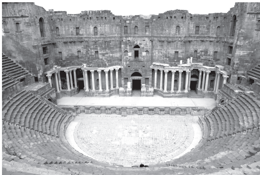
4. kép. Bosra római színháza. Délnyugat-Szíria, Kr. u. 2. század

A bőr színe az antik szerzők szerint nem csupán az indulatot fejezheti ki, hanem származásra is utalhat, vagyis az ember lelki tulajdonságaitól, pillanatnyi hangulatától független ismérv is lehet. A különböző forrásokat szemrevételezve azt láthatjuk, hogy a római szerzők az afrikaiak, indiaiak, aethiopsok, valamint a kínaiak ( Seres ) színét tekintik eltérőnek, általában sötétebbnek. Az idősebb Plinius tudósít arról, hogy Byzantiumban az egyik ökölvívó örökölte aethiops nagyapja bőrszínét, jöllehet anyján egyáltalán nem látszott származása. Az aethiopsok bőrszíne tehát markánsan eltérő, olyannyira, hogy az Aethiops az első századtól a fekete szinonimájává