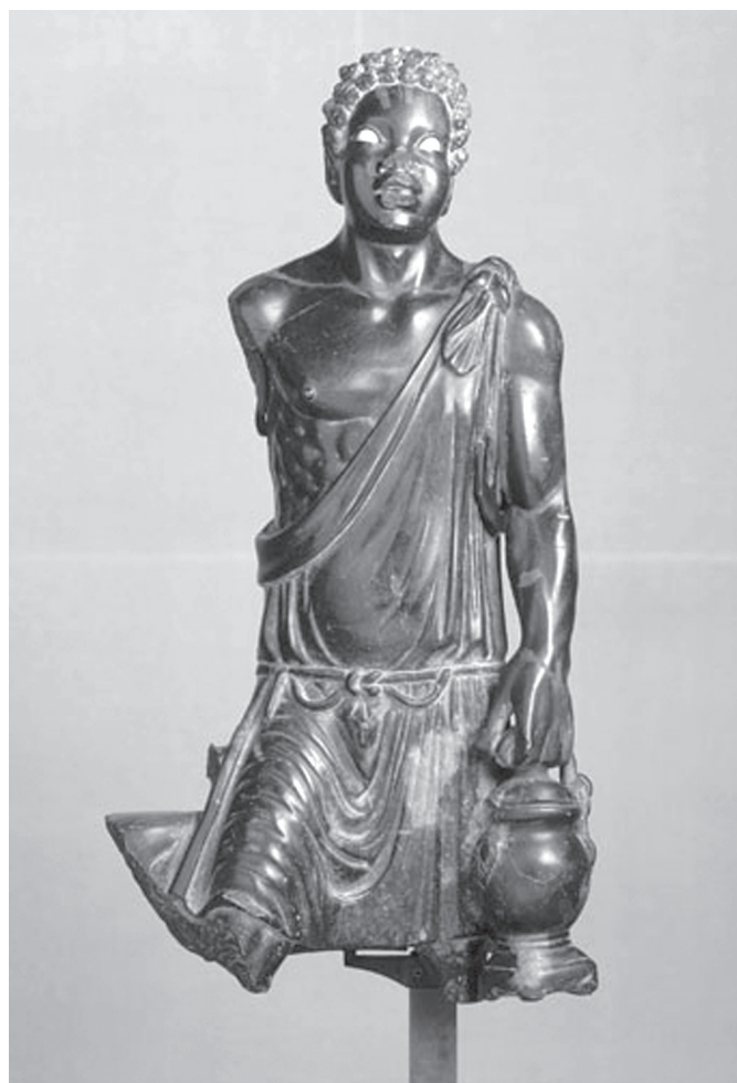
1. kép. Afrikai férfit (talán rabszolgát) ábrázoló szobor a Kr. u. 3. századból. Louvre, Párizs

felismerhetővé tenné számbeli többségüket. 8 A rómaiak olykor mégis alkalmaztak tetoválásokat, billogokat vagy nyakperceket a tulajdon megjelölésére, a szökések megnehezítésére vagy éppen büntetésből. 9 A megbélyegzésnek ezek a módjai azonban egyáltalán nem voltak egységesek vagy általánosak. Az adásvételnél adott tájékoztatás, a tulajdon megjelölése, illetve a büntetés egyedi, többnyire időleges megjelölést ered-