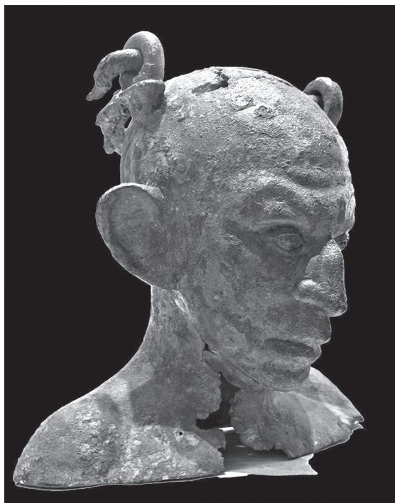
5. kép. Szíriai férfi rabszolga bronz mellszobra. Kr. u. 1-3. század. Louvre, Párizs

Plinius: Naturalis historia VII. 12, 51 Darab Ágnes fordítása