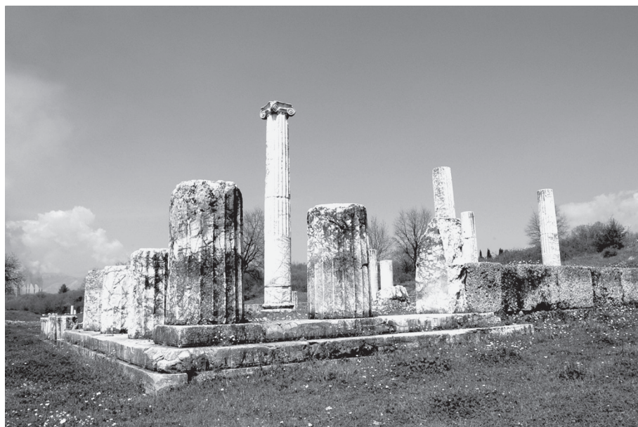
2. kép. A Philippeion csarnok romjai a megalopolisi agorán

A város központi részének fizikai leírását, a tulajdonképpeni periégésist – a városba bevezető útról tudósító 28–29. fejezet után – a 30–32. fejezetek adják. És ha ókori romokat keresünk, akkor itt szép számmal találunk. Az agorán Zeus Lykaios szentélye előtt az Istenek Anyjának egy kisméretű szobra áll, „a templomból viszont semmi más, csak az oszlopok maradtak meg” (VIII. 30, 4). A Philippeion nevű csarnok mellett valaha Hermés Akakésios temploma állt, de már összeomlott, és csak egy márvány teknősbéka maradt belőle (VIII. 30, 6). A piactér mellett van két domb: az egyikén Athéna Polias, a másikon Héra Teleia szentélyének romjai állnak (VIII. 31, 9). Megalopolis egyik nevezetes épülete egy hatalmas tanácsépület, az ún. Thersilion 30 volt, amelyben egykor az Arkádiai Szövetség képviselői, a „tízezrek” ( myrioi ) gyűléseztek – de ennek Pau-