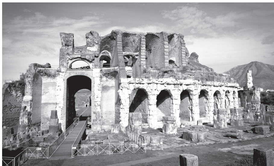
3. kép. A császárkori Capua Kr. u. 1. században épült amfiteátrumának romjai

Nos, még ha nem maradt is volna meg sem maga a városuk, sem benne egyetlen lélek (horum si neque urbs ipsa neque homo quisquam superesset), ki vethetné a szemünkre, hogy keményebben bántunk velük, mint megérdemelték? Bűnük tudatában sokkal többen választották közülük önként a halált, mint ahányat mi megtorlásul kivégeztünk. A többiektől pedig úgy vettük el városukat és földjüket, hogy földet és lakóhelyet adtunk nekik; a mit sem vétett várost épségben állni hagytuk, úgyhogy aki ma látja, nem veszi észre rajta az