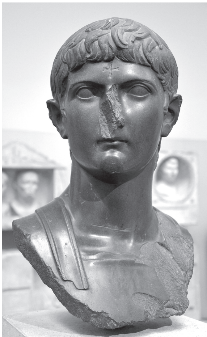
3. kép. Germanicus bazaltból faragott büsztje Egyiptomból, ökeresztény hívek késő római időszakban okozott rongálásaival (British Museum, forrás: Carole Raddato, https://commons.wikimedia.org/w/index.php?curid=45895266 )

szentségeivel felruházott imperator ” ( imperatorem auguratum et vetustissimis caerimoniis praeditum , ford. Borzsák István) közvetlen érintkezése a holttestekkel aggályos lehet.