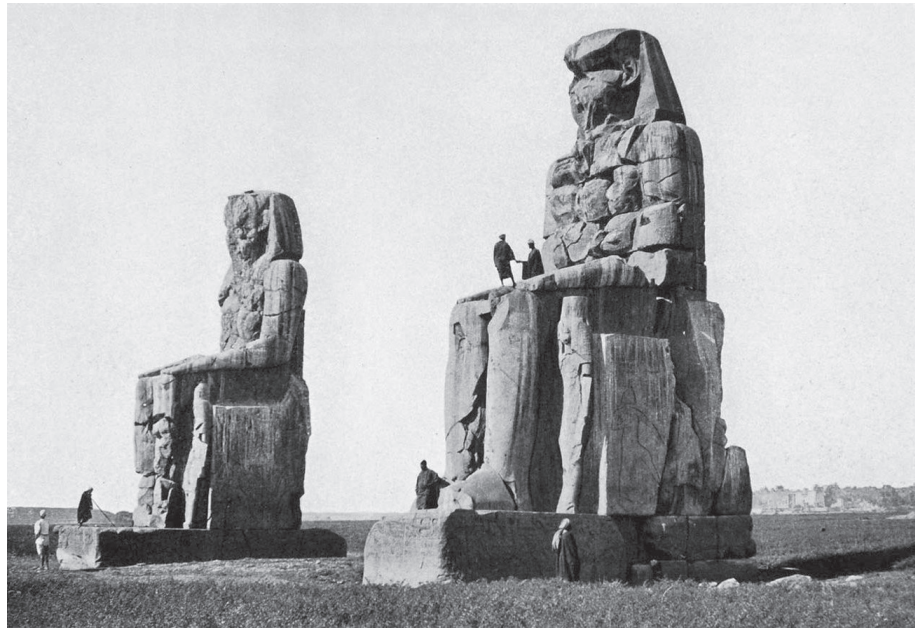
A Memnón-kolosszusok Thébában (H. Béchart felvétele, 1926; forrás: https://www.periodpaper.com )

A részletesen ismertetett felirat jellege, tartalma segít értelmezni az egész jelenetet. 5 Nem a szokásos turistalátványosságról van tehát szó, amivel a korszak utazóit szórakoztathatták a helyiek. Ilyesmikről olvashatunk a fentebb elsőnek vagy harmadiknak nevezett egységben. A felirat az államigazgatásra jellemző pontossággal rögzíti a számokat, adatokat, így emlé-