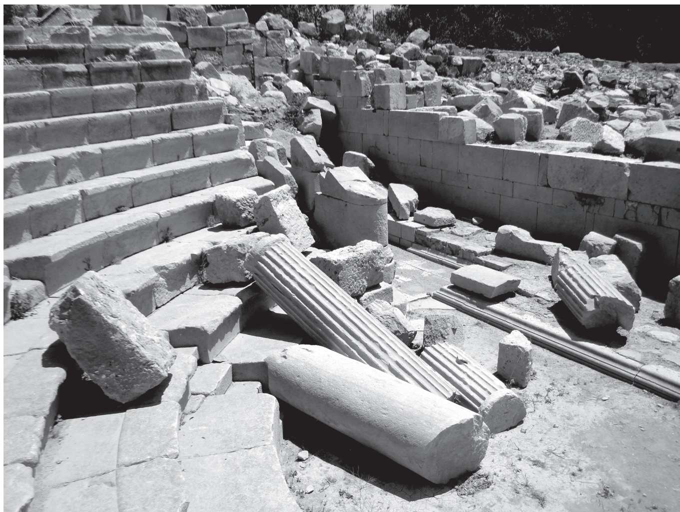
Színház romjai Teosban, a mai Törökország területén