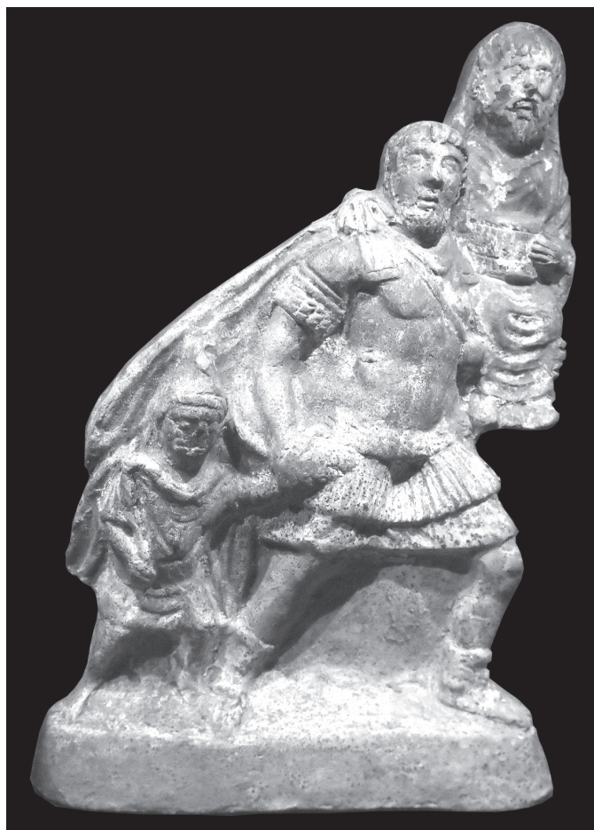
2. kép. Aeneas kimenekíti apját, Anchisest és fiát, Iulust Trójából. Pompeii terrakottaszobor, Kr. u. 1. század. Museo Archeologico Nazionale, Nápoly, ltsz. 110338

családtag a jövőről is állít valamit. A laudatio funebris , a halottat és az őseket magasztaló gyászbeszédet általában a halott fia vagy unokaöccse mondja el, egy fiatalember, akinek esetleg ez az első nyilvános szereplése, és akinek fiatalsága, illetve megidézett és felvonultatott ősei együtt ígérnek fényes és Róma sikereit szolgáló pályát: consulságot, győzelmeket, triumphust. De nemcsak az ő fényes jövőjét ígéri – ha úgy tetszik: jósolja – meg az ősök menete, hanem a gens , azaz az egész nemzetség és azon keresztül Róma távolabbi jövőjét is. A gens eddigi dicső tagjainak sora ennek a sornak a soha meg nem szakadó folytatását vetíti előre, illetve kényszeríti ki rituálisan.