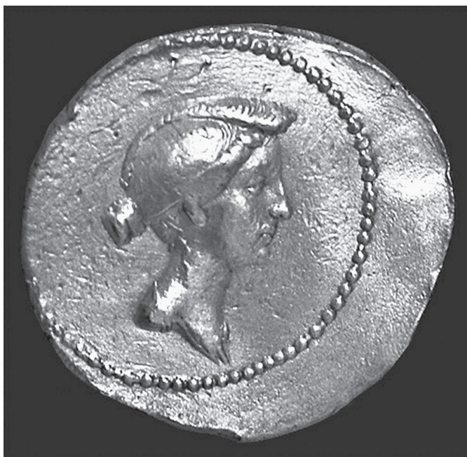
4. kép. Marcus Antonius aureusa Kr. e. 39-ből felesége, Augustus nővére, Octavia arcképével. Berlin, Altes Museum

Az Augustus alatt beköszöntő aranykornál nehezen lehetne pozitívabb jelent, illetve már a küszöbön álló jövőt elképzelni. Hogyan viszonyul akkor a két rész egymáshoz? A Marcellus siratásából áradó gyász és a kijelölt utód elvesztéséből adódó komor kilátások megkérdőjeleznék az aranykort? Nem visszásgabonahiány, járványok, lázongások, a princeps családját sújtó bajok közepette a már-már beköszöntő aranykorról dalolni? Esetleg a falsa insomnia az aranykor eljöttére vonatkozna, lévén ez az egyetlen olyan esemény, amely az Aeneis születésekor még nem következett be? Nem valószínű, mint ahogy az ellenkezője sem, miszerint az aranykor ígérete semmissé tenné az ének szomorú kicsengését. Annál a „sokolvasatúságnál”, „sokszólamúságnál”, amely (többek között) az Augustus-párti és Augustus-ellenes olvasatot is felülírja az újabb megközelítésekben, nehéz lenne jobbat javasolni. Ugyanakkor az Augustus-ellenes olvasattal kapcsolatban mégis érdemes egy általános érvet megemlíteni. (Az Augustus-ellenes olvasat ebben az