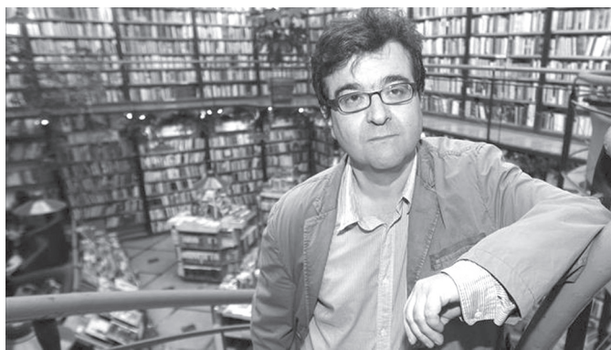
2. kép. Javier Cercas