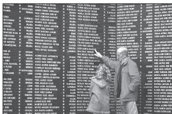
3. kép. Közös síremlék Oviedóban 1316 elesett katona nevével (2008)

politikus voltál, Rafael. Most azonban nem vagy más, csak egy milliomos – mondogatta neki akkoriban Augustín de Foxá író, politikus és milliomos, egyike azon kevés barátoknak, akiket Sánchez Mazas nem vesztett el idővel” (137).