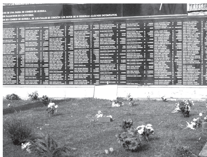
4. kép. Közös síremlék Oviedóban 1316 elesett katona nevével (2008)

De a második világháború világégése egyetemesen sem volt elbeszélhető azok között a keretek között, amit a hellén kultúra a háborúról tudott. Az angolszász ókortudomány pragmatizmusának volt köszönhető, hogy a mítosz megterhelődése után a kívánt tárgyilagossággal lehetett újra foglalkozni a perzsa háborúkkal. 36 Ez szükségképpen felelt meg a demitologizálás belső igényének. Az angolszász tudomány aztán a továbbiakban a globalizált világ kulturális sokféleségében kereste a perzsa háborúk emlékezetének, ezen belül a Salamis-mítosznak az új értelmezését, amely, legélesebb változatában az orientalizmus tézise révén, szintén a demitologizáláshoz vezetett. Ez