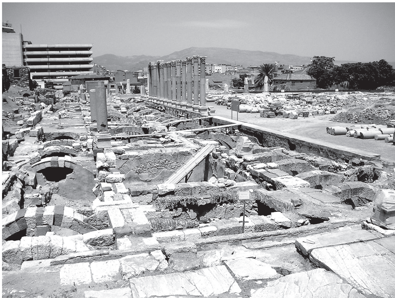
2. kép. Az egykori Smyrna agorájának romjai a mai Izmir város területén

Korábban Théseust és Alexandrost ünnepeltük, előbbi hitem szerint azért, mert a leginkább emberbarát volt a görögök között, utóbbit pedig mint a harcban tanúsított