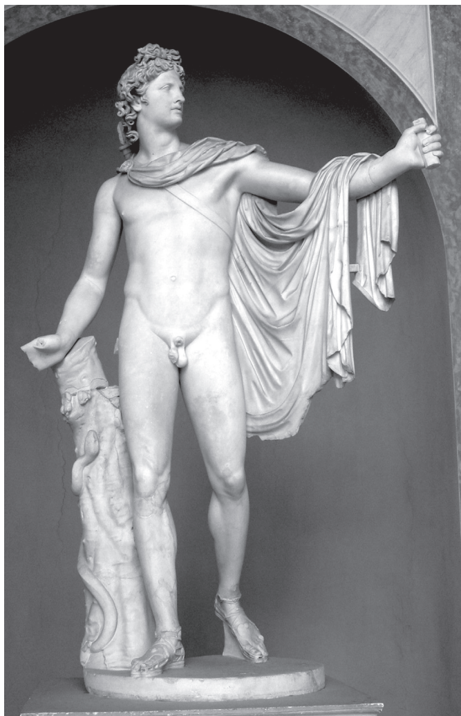
4. kép. A Belvedere-i Apollón szobra. Kr. u. 120–140. k. Kr. e. 4. századi bronzszobor másolata (Musei Vaticani, Róma)

Már említettem, hogy amikor Verus Caesar vezérei ostrommal bevették a várost [Seleuciát], ledöntötték alapjairól Apollo Comaeus szobrát, Rómába vitték, ahol a főpapok a palatinusi Apollo-templomban állították föl. Mondják, hogy a szobor elhurcolása után a katonák fölgyújtották a várost, majd átkutatták a szentélyt, ahol egy szűk nyílást találtak. Amikor kiszélesítették, hogy valamilyen értékes holmit találjanak, egy elzárt szent helyről, a chaldaeusok rejtekéből valamilyen őseredetű vészes anyag tódult ki, amely gyógyít-