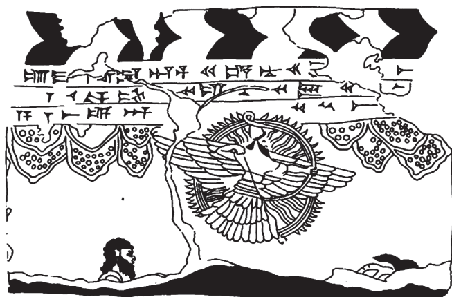
2. kép. Assur isten ábrázolása II. Tukulti-Ninurta (Kr. e. 9. század eleje) korából (Keel 1984, 216, 295. ábra nyomán)

a vertikális olvasat lehetősége: a 4. és a 7. versben az ember felfelé kiált az Istenhez, amire a teofánia a válasz: JHVH a 10. és a 17. versben kimondottan leszáll és lenyúl, felvesz , tehát a lentől felfelé irányuló kérésre érkezik egy fentről lefelé irányuló válasz. A zsoltár második felében pedig megszületik az ebből fakadó megoldás, immáron újfent horizontális, emberi síkon. Ennek a komplex rendszernek a további kibontásához hívom segítségül a Winkel Holm által a katasztrófa-szövegek interpretációjához javasolt három kategóriát: teodícea, fenséges és rendkívüli állapot .