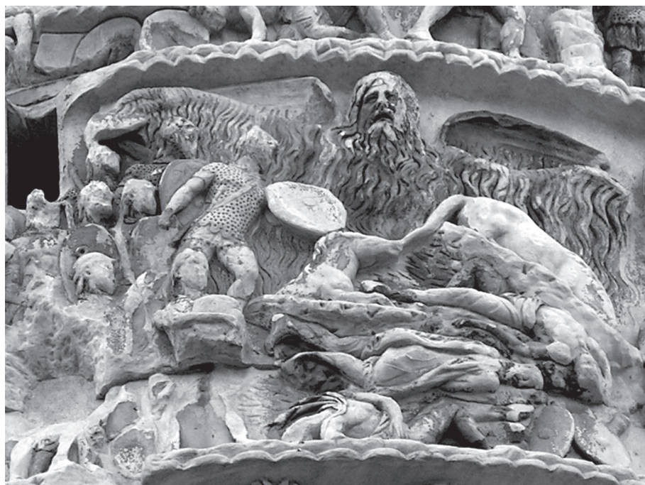
1. kép. Marcus Aurelius oszlopa, XVI. jelenet. Az esőisten szakállas-szárnyas alakja, jobbjá alatt az elesett barbárok

kellott töltenie a tartománnyal szomszédos északi barbárok, a germán markomannok és a felvidéki quadok, illetve az alföldi szarmaták ellen vívott elhúzó háborúi miatt (az uralkodó személyes részvételével: Kr. u. 169–175; 178–180). A császár a felső-pannoniai Vindobonában hunyt el 180-ban. A harcok során a többi szomszédos barbár nép is belekeveredett a rómaiak elleni háborúba, amely kezdetben katasztrófa-lyis római vereségekkel járt. Kr. u. 170-ben a pestisjárványban is meggyengült rómaiak ellenállását legyűrve markomannok és quadok pusztítva eljutottak Itáliáig, míg a costobocusok Hellas területére törtek be. Ezért aligha tartható véletlennek, hogy Marcus Aurelius filozófiai munkájának első két könyve bizonyosan itt született meg (Carnuntumban, illetve a quadok földjén). Az uralkodó vezette római csapatok csak a következő évben tisztították meg véglegesen a római területet a barbároktól, és ettől az időponttól fogva terelődött át a