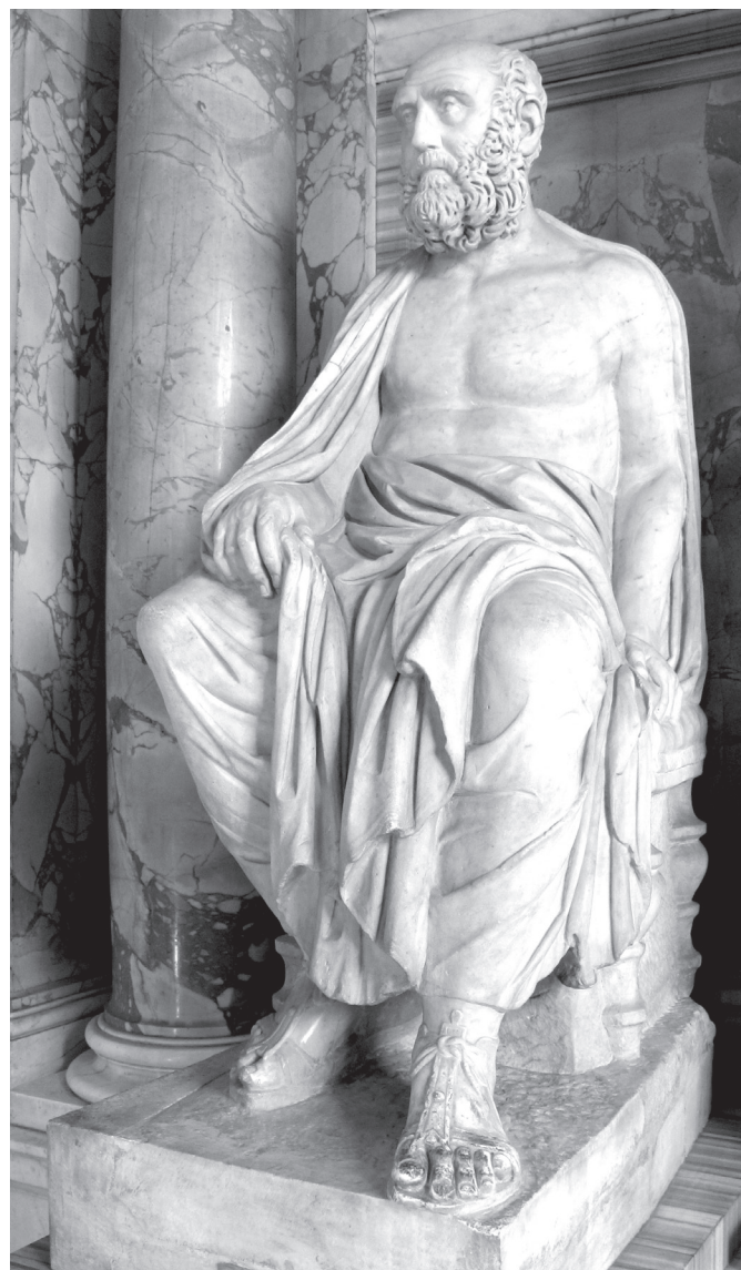
1. kép. Ailius Aristeidész márványszobra. Róma, Vatikáni Múzeum

Sok más harcot is említhetnénk, különösen azokat, amelyeket nemrégiben értetek és veletek harcoltunk meg minden lehetséges alkalommal – olyan leírás volna ez, amely sok időt venne igénybe. De miért is időznénk ezeknél az eseményeknél?