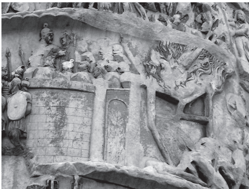
2. kép. Marcus Aurelius oszlopa, XI. jelenet. A villámcsoda. Villám pusztítja el a római tábor melletti barbár ostromtoronyt

Azt beszéltek, hogy ennek fivére, Marcus Aurelius Caesar, amikor a germánokkal és szarmatákkal szemben csatarendbe állt, végveszélybe került, mivel seregét szomjúság kinozta. Ekkor a Meliténéről elnevezett legio katonái hitük ereje által, amely azóta is megtartotta őket az ellenséggel szemben, letérdeltek, ahogy nálunk ez imádkozás esetében szokásos, és úgy könyörgtek az Istenhez. Ez a váratlan látvány az ellenséget is megdöbbenetette. Egy másik elbeszélés szerint tüstént még váratlanabb dolog történt. Heves vihar tört ki, míg az ellenséget villámok kergették el és lesújtották rájuk, az Istenhez könyörgő római sereg viszont zápor hullott, amely felüdítette a