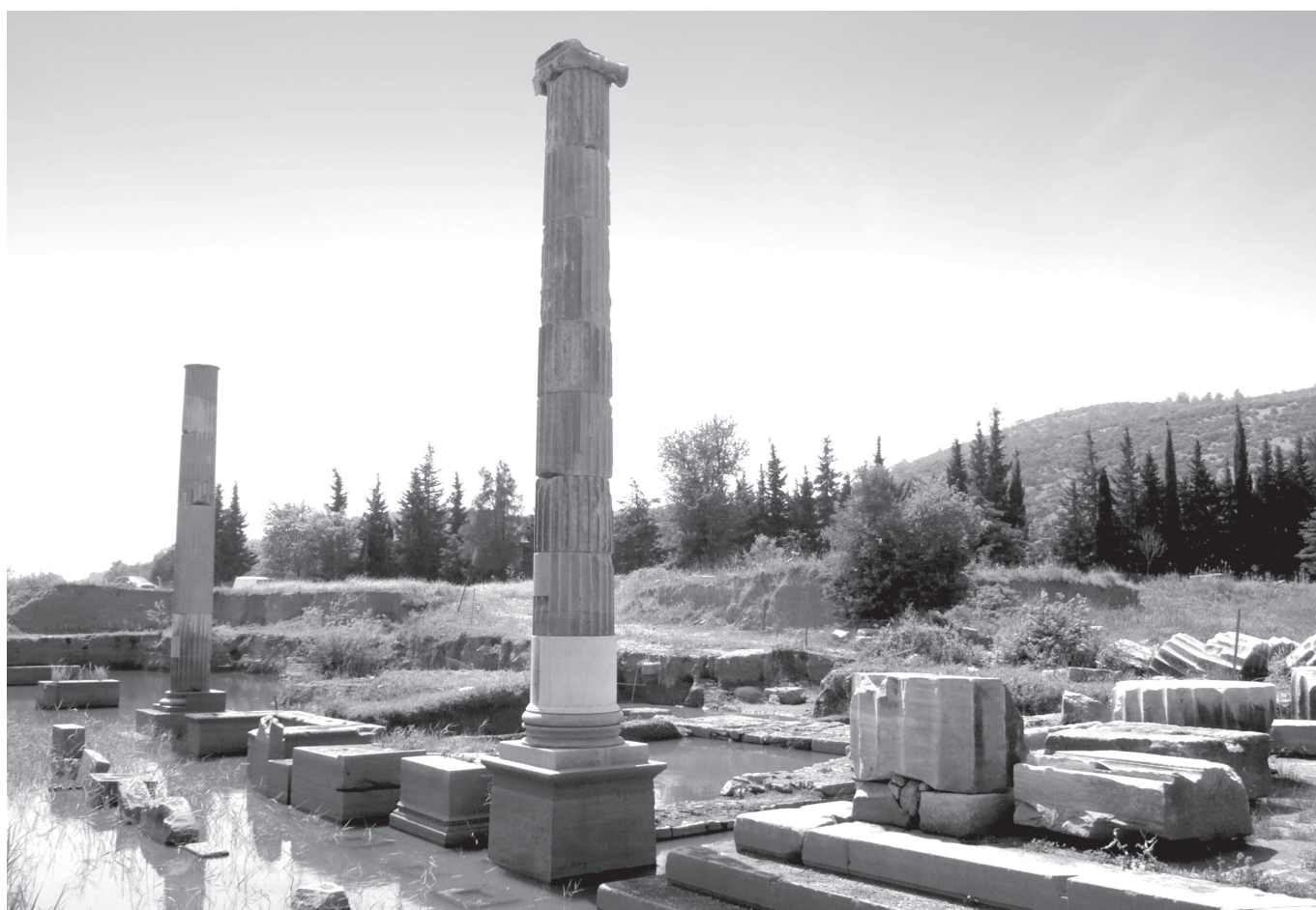
5. kép. A klarosi Apollón-templom romjai

A járványok legnyilvánvalóbb következménye az emberek tömeges elhalálása. De vajon hányan is haltak meg az Antoninus-kori járvány évtizedeiben a Római Birodalomban? A becslések általában az összlakosság 1–30%-a között mozognak (a Római Birodalom lakosságának becsült számáról lásd az 1. ábrát). James Frank Gilliam szerint a 160-as években a birodalom lakosságának mindössze 1–2%-a halt meg a járvány következtében. 45 Arjan Zuiderhoek a mortalitási rátát 7–10, illetve 25–33%-ra teszi, attól függően, hogy melyik évtizedről van szó. 46 Elio Lo Cascio szerint húsz éven