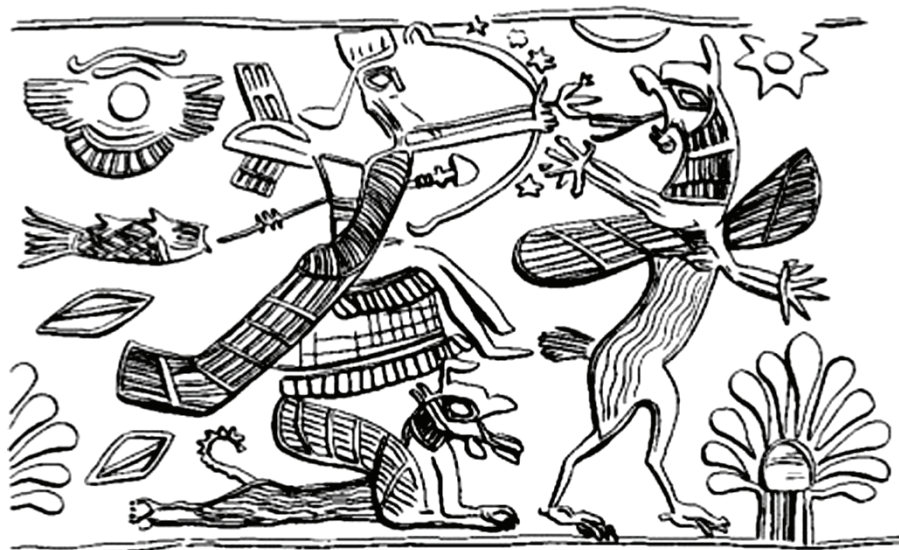
1. kép. Ninurta isten üldözi Anzu madarat. Asszír pecsétleng, Kr. e. 1. évezred első fele (Keel 1984, 40, 45. ábra nyomán)

Milyen katasztrófák lenyomatait őrzi az Ószövetség? Gondolhatunk itt olyan természeti eseményekre, mint bizonyos állatfajok túlzott elszaporodása, amely veszélyezteti az emberi (és ezáltal sokszor automatikusan isteninek tekintett) rendet: például túl sok béka, szúnyog, a sáskajárás; betegségek megjelenése; szélsőséges időjárás és következményei. Egyik sem maradhat ki például az egyiptomi tíz csapás elbeszéléséből, amely ezek fokozásával éri el az elviselhetetlen csúcst: az elsőszülöttek megölését