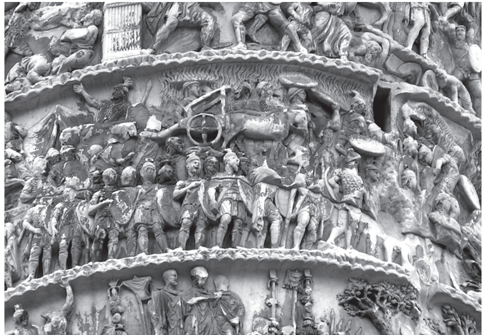
5. kép. Marcus Aurelius oszlopa, XVI. jelenet. Az esőisten jobbján a megmenekült római sereg látható. A katonák részben lovaikat itatják, részben már pajzsokkal védekeznek az eső ellen

Fennmaradó kérdés, hogy az eseményekről mennyit is tudhatunk a birodalom alattvalói, illetve miért pont ezek váltak később különösen ismertté. A Római Birodalom átlagpolgára nyilvánvalóan nem olvasta az uralkodó senatusnak hivatalosan közétett levelét, de Themistios még két évszázad múlva is látott olyan festményt (amely előzménye a diadalmeneteken körbehordozott, egy-egy hadjárat dicső eseményeit ábrázoló festményekben kereshető), amely az esőért imádkozó uralkodót ábrázolta ( Or. XV. 191b). A diadaloszlop szabadon, a felszínről is jól kivehető jelenetei mellett hasonló képi ábrázolások révén juthatott el az események híre minden tartományba. Ami miatt azonban az esemény különösen híressé vált (az egyik legjobb dokumentált antik természeti eseménnyel állunk szemben), az a hatalmas vita volt, hogy a villámcsapást és a vihart melyik istenségnek is köszönheték a rómaiak, illetve ki eszközölte azokat ki. Az átlagember számára aligha volt kérdés, hogy mindezt Juppiternek köszönhe-