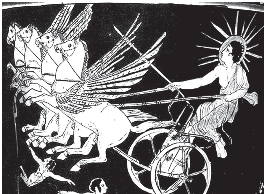
Phaethón (vagy Apollón/Phoibos) a napszekéren. Vörösalakos attikai kráter, Kr. e. 5. század (British Museum, London)

a katasztrófa és az annak felszámolására irányuló kérés. A katasztrófa hasonlóan kétarcú jelenségként áll elő az olvasás számára, mint maga Tellus, aki egyszerre antropomorf és geológiai jelenség. A katasztrófa kétarcúsága abban áll, hogy felfogható értelmetlen pusztításként, de úgy is elgondolható, mint egy lehetőség, amely akár fejlettebb szintre lendítheti az azt elszennvedő kultúrát. Vegyük például az ekpyrós inverzeként előálló, ám ahhoz ezer szállal kötődő özönvíz ovidiusi elbeszélésének utolsó sorait, ahol arról olvashatunk, hogy az elaljasodott ember a kataklizma után hogyan válik építeni kész lényvé (I. 414–415).