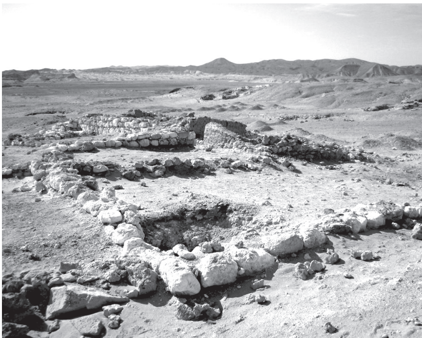
2. kép. Myos Hormos, a „Patkánykikötő” Egyiptomban

Marcus Aurelius tehát eredeti szándéka szerint magával vitte volna az északi háborúba Galénost, de az orvos ravaszul kicselezte, így Rómában maradhatott, ahol még éveken át a gyermek Commodus orvosaként működött. Marcus halála (Kr. u. 180) után is megmaradt a jó kapcsolata a római udvarral, ahol legalább a század-