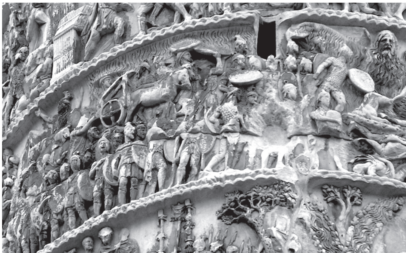
4. kép. Marcus Aurelius oszlopa, XVI. jelenet. Az esőisten jobbán a megmenekült római sereg látható (részlet)