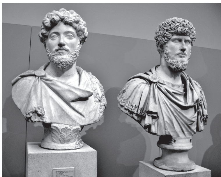
1. kép. Marcus Aurelius és Lucius Verus császárok. Cyrene, Kr. u. 160–170 k. (British Museum, London)

Másfelől a Domitianus halála (Kr. u. 96) és Commodus trónra kerülése (Kr. u. 180) között eltelt időszakot valóban szokás „antoninusi virágkornak” tekinteni, és nemcsak azért, mert a két zsarnok halála között eltelt időben viszonylag humánus uralkodók kormányozták a birodalmat – bár ezzel a minősítéssel a kortárs keresztények és zsidók bizonyosan vitatkoznának –, hanem azért is, mert a Traianus idejében legnagyobb kiterjedését elérő birodalom – a fennmaradt irodalmi, epigráfiai és régészeti források alapján – addig soha nem látott gazdasági fellendülést produkált. Ez a virágzó időszak azonban a válság egyértelmű tüneteit is magán hordozta. Északon hosszan elhúzódó háborúkat vívtak a quadok, markomannok és szarmaták, keleten a parthusok ellen, miközben a határtartományok némelyikében (Britannia, Mauretania, Iudaea) is súlyos felkelések robbantak ki. A keresztények és zsidók üldözése – az utóbbiak esetében a vallási önrendelkezési jog megvonása – komoly társadalmi feszültségeket generált. Mindezt betetőzte a Marcus Aurelius és Lucius Verus közös uralkodása alatt kitört járvány, amely a római társadalom teljes vertikumában érezte hatását. 3