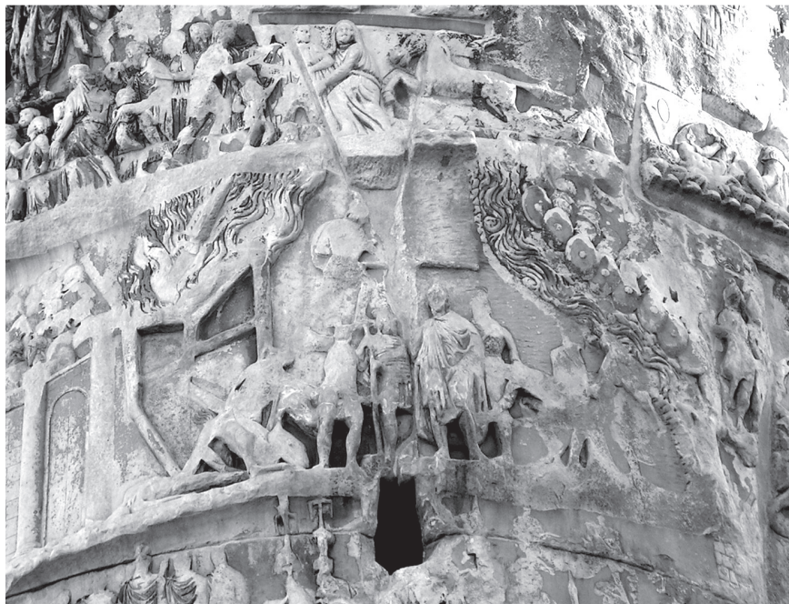
3. kép. Marcus Aurelius oszlopa, XI. jelenet. Marcus Aurelius áldozata a csoda után

már-már szomjhalál küszöbén állókat. Az eseményeket olyanok is leírják, akik a mi hitünk-től távol állnak, de ugyanezen uralkodók cselekedeteivel szándékoznak foglalkozni, és a mi iróink előtt is jól ismert. Abban azonban a kívülálló történésírók nem értenek egyet, bár a különös eseményt maguk is említik, hogy a csoda a mieink imája révén következett be, mivel nem jártasak hitünkben, de a mieink, lévén igazságszeretők, egyszerű és jámbor módon adják vissza a történeteket. Ezek közül való Apollinarios is, aki azt mondta, hogy az a legio, amely az imádság révén mívelte a csodát, erről az eseményről a császártól egy, ez eseménynek megfelelő elnevezést kapott: a rómaiak nyelvén „villámhajítónak” nevezték el. Hitelt érdemlő tanú lehet Tertullianus is, aki a senatushoz a hitünkről a latin nyelvű védőbeszédet intézte, amelyről már előbb is említést tettünk, és az eseményt jobb és világosabb bizonyítékkal erősítette meg. Ő maga azt írja, hogy Marcusnak, a legbölcsebb császárnak most is közkezen forog egy levele, melyben ő maga tanúsítja, hogy Germaniában a vízhiány miatt már éppen a pusztulás szélén álló serege a keresztények imája révén menekült meg. Azt is mondja, hogy az uralkodó halállal fenyegette meg azokat, akik megvadásunkra vetemednének.