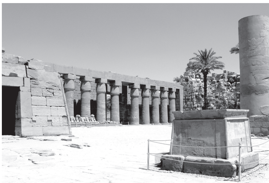
2. kép. Az ún. Bubasztiszi-udvar Karnakban, amely Taharko thébai építkezéseinek egyik fő színtere volt (a szerző felvétele)

Sebitkót a kettős királyság trónján unokatestvére, Taharko, Piankhi fia követte. Taharko (Kr. e. 690–664) a 25. dinasztia legjobban dokumentált fáraója – és egyben legellentmondásosabb alakja. Számos királyfelirata ismert Alsó-Egyiptomból, Memphisz térségéből, Karnakból, valamint Kútból, ahol elsősorban a kawai Amun-templomban fennmaradt sztéléi érdemelnek említést. Huszonnégy évig tartó regnálása azonban meglehetősen ambivalensnek mondható. Uralkodásának első évtizede a kusita dinasztia virágkora Egyiptomban, ami évszázadok óta nem látott, látványos építkezésekben is megnyilvánult. A Kr. e. 670-es évektől kezdődően azonban állandósult a konfliktus Asszíriával, és uralma végén Taharkónak meg kellett élnie a kusita hatalom összeomlásának kezdetét Egyiptomban.