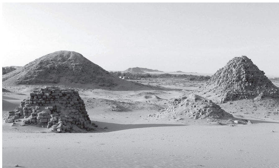
4. kép. Nuri. A kép háttérében Taharko piramisa látható, amely a legnagyobb ilyen típusú építmény volt az ókori Nubia területén

Ré fiá(nak), Taharko(nak), (aki) a Szaiszban lakozó Ozirisz kegyeltje