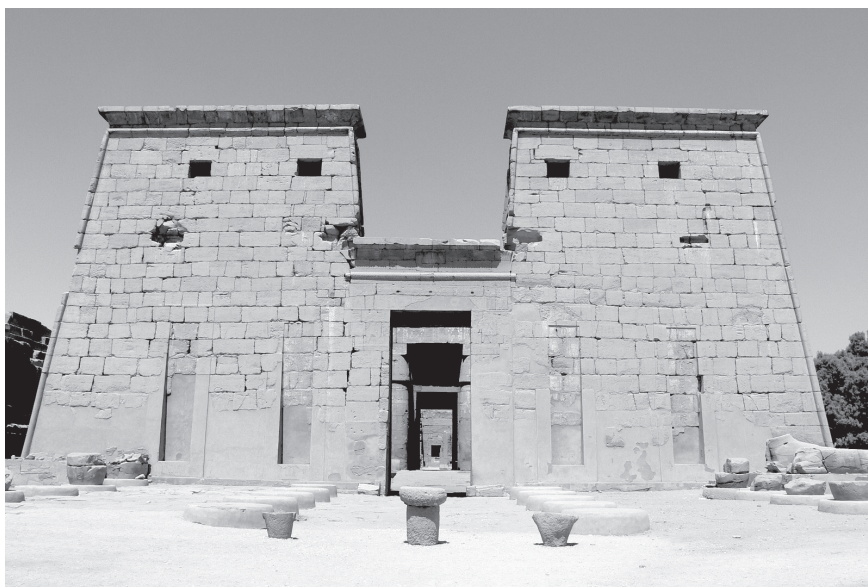
3. kép. Taharko porticus ának maradványai Karnakban a Honszu-templom előtt

Nem szabad azonban megfeledkezni arról sem, hogy két tényező is arra készítette Sebitkót, hogy Taharkót jelölje ki örökösének. Egyrészt fia, Tanutamani feltehetőleg még nagyon fiatal volt, de még lényegesebb, hogy Sebitko megváltoztatott külpolitikájának következményeként érlelődött az Asszíriával szembeni fegyveres konfliktus, és ezért olyan királyi sarjra volt szükség, akire rá lehetett bízni a hadsereg vezetését, és aki, mint kijelölt trónörökös, kellő tekintéllyel rendelkezett. 28 Ugyanakkor elődje iránta tanúsított szeretetének visszatérő hangsú-