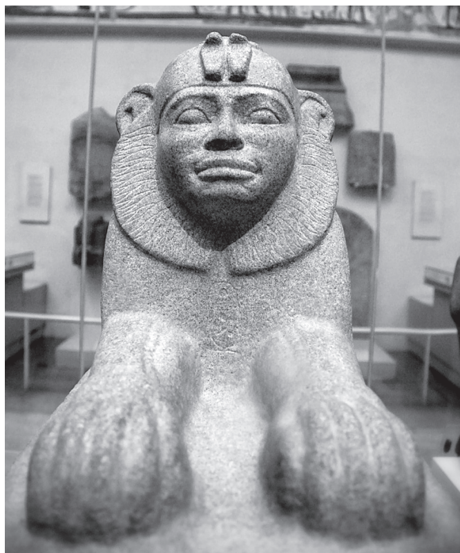
5. kép. Taharko szfinx alakban

Kastának, a kusita 25. dinasztia alapítójának a felső-egyiptomi politikai porondon történő megjelenését több tényező is elősegítette, melyek között politikaiakat és kulturálisakat egyaránt találunk. A kusita dinasztia hatalomra jutásának egyik előfeltétele volt, hogy a 23. dinasztia a 750-es évek elejére maradék társadalmi bázisát is elveszítette, hiába próbálta meg III. Oszorkon családja biztosabb alapokra helyezni hatalmát az Amun Isteni Felesége hivatal felélesztésével, amelybe a fáraó lányát, Sepenvepetet ültette. A thébai kulturális elit, amely Amun körzetét ténylegesen irányította, az első adódó lehetőséget megragadta, hogy lerázza magáról a líbiai fejedelmek uralmát, és átadja a Felső-Egyiptom feletti hatalmat egy olyan uralkodónak, aki ugyan szintén egy másik etnikum képviselőjeként, tulajdonképpen hódítóként jelent meg Egyiptom földjén, mégis olyan erős kulturális szálak fűzték Amun körzetéhez, amilyeneket a líbiai fejedelmek és törzsfők az azt megelőző több mint 300 évben sem tudtak kialakítani. Az újbirodalmi hódítás, amely majd fél évezreden keresztül sújtotta a Nílus Első és Negyedik Kataraktája között fekvő régiót,