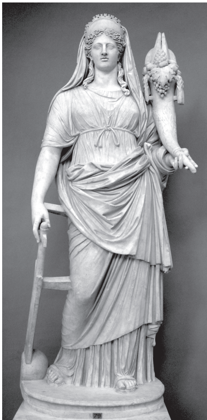
2. kép. Fortuna bőségszaruval és kormánylapáttal. Kr. e. 4. századi görög eredeti római kori márványmásolata (Musei Capitolini, Róma)

uralmát még tündöklőbbnek láttató, ugyancsak feltételezett narrátori ambíció alapján kell értelmeznünk, hanem annak a szövegegységnek a kontextusában, amelynek a szerves részét, sőt a tetőpontját képezi. 27