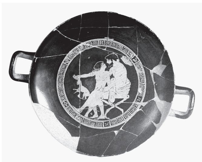
3. kép. Attikai vörösalakos kylix, Kr. e. 490–470 (Museo Nazionale Archeologico, Tarquinia)

A kakas tipikus ajándék a szeretők között – ahogy a harmadik éjszakán fölajánlott ló is. 15 Az előző éjjel „ártatlan” epedő csókja erre az estére heves vágygá fokozódik. Mindenre kész kezeivel a fiút akarja érinteni. A tracto igével kapcsolatban – amely ehhez hasonló szövegkörnyezetben maszturbálást, orális kielégítést, csokolózást jelent a közösülés aktív részvevőjére vonatkoztatva 16 – felidézhetjük Dover „kétirányú érintés” terminusát, amely szerint az erastés egyik kezével megérinti az erómenos arcát, a másikkal pedig annak nemi szervét (4. kép). 17 A szöveghely patienti szava (a patiōr ból) mindezek türesét mutatja. 18 A fiú hallván a felajánlást, most nemcsak az alvást tettet, így kedvezve szeretőjének, de még közelebb is húzódik hozzá.