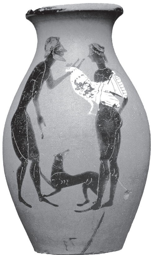
1. kép. Attikai feketealakos olpé, Kr. e. 540–530 (Régészeti Múzeum, Rhodosz)

Eumolpus pergamoni szállására szívesen emlékezik vissza. Története ( Satyricon 85–87) pontosan úgy kezdődik, mint bármely szerelmi történet, mondjuk a szerelmi elégiák világában. A férfi megpillantja vágyai tárgyát, ebben az esetben a szeretett fiút. Eumolpust hidegen hagyják a fiú szellemi képességei vagy jellemének erényei, kiválóságát egyedül szépségével jellemzi, vonzalma tehát tisztán fizikai. A történet elbeszélése által felidézett görög erastés – erómenos -viszony nyilvános és tiszteletreméltó, és számtalan kulturális, spirituális elemet hordoz, Eumolpus viszont már a kezdet kezdetén csalóként mesterkedik, és csak a fiú testét akarja. A szülőket a közös étkezések alkalmával – amelyeken a férfiszerelemről beszélgetnek! – álságos erkölcsösségével, mesterkelt dühével megtéveszti, akik a fiuk nevelését nyugodt szívvel bízzák „filozófusnak” titulált vendégükre. Így már az elbeszélés elején felidéződik az olvasóban Platón Lakomája . A platóni dialógus résztvevői, mint az közismert, Erös mibenlétét kutatják, és e téma kapcsán többször szót ejtenek a férfiszerelemről, annak helyes természetéről. Látni fogjuk, hogy A három felajánlás története könnyedén olvasható a Platón Lakomájában világirodalmi érvénnyel megfogalmazott idealizált férfiszerelem paródiájaként. Eumolpus látszatra ugyanúgy viselkedik a fiúval, mint bármely tanító, csak a motiváció más. Mindenhova elkíséri, de nem a gondos törődés miatt, hanem mert el akarja zárni őt a hozzá hasonló kéjencektől.