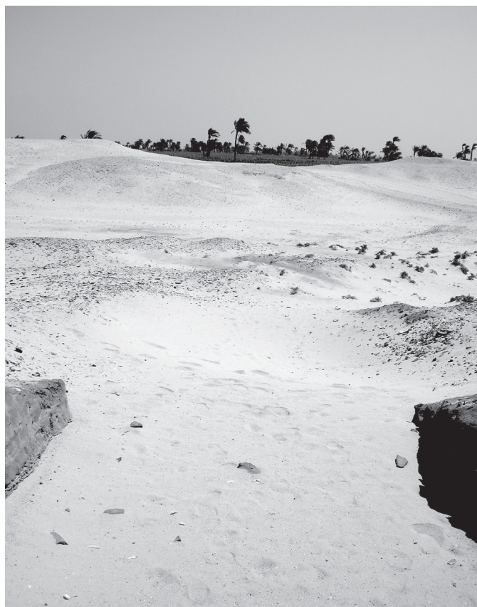
6. kép. A város melletti keleti terület a keleti kapuból fényképezve

út lehetőséget adott az alsóbb társadalmi csoportok számára, hogy ügyes-bajos dolgaikkal egy-egy hivatalnokhoz forduljanak: a címszereplő paraszt éppen akkor közelít panaszával egy magas rangú tisztviselőhöz, Renszi birtokelőjáróhoz, amikor az kilép a háza kapuján, és a kikötőbe tart, hogy beszálljon a hivatali hajójába. 37 Az ilyen találkozások – feltéve, ha valaki oda tudott férközni egy kísérők és szolgák által védelt tisztviselőhöz 38 – szokványosak lehettek, de feltehetőleg nem voltak kívánatosak a mindig elfoglalt és a társadalom alsóbb csoportjaival nem szívesen érintkező tisztviselők számára – Renszi ház előjáró sem foglalkozik a paraszttal, hanem az egyik kísérőjét küldi hozzá. Az Illahunból kivezető út/folyosó is valószínűleg egy kikötőhöz vezetett, és a falakat talán azért építették, hogy a városban élő és oda érkező magas rangú személyeket elszigeteljék attól az elit számára terhes környezettől, amelyen egyébként kénytelenek lettek volna áthaladni a város és a kikötő között (6. kép).