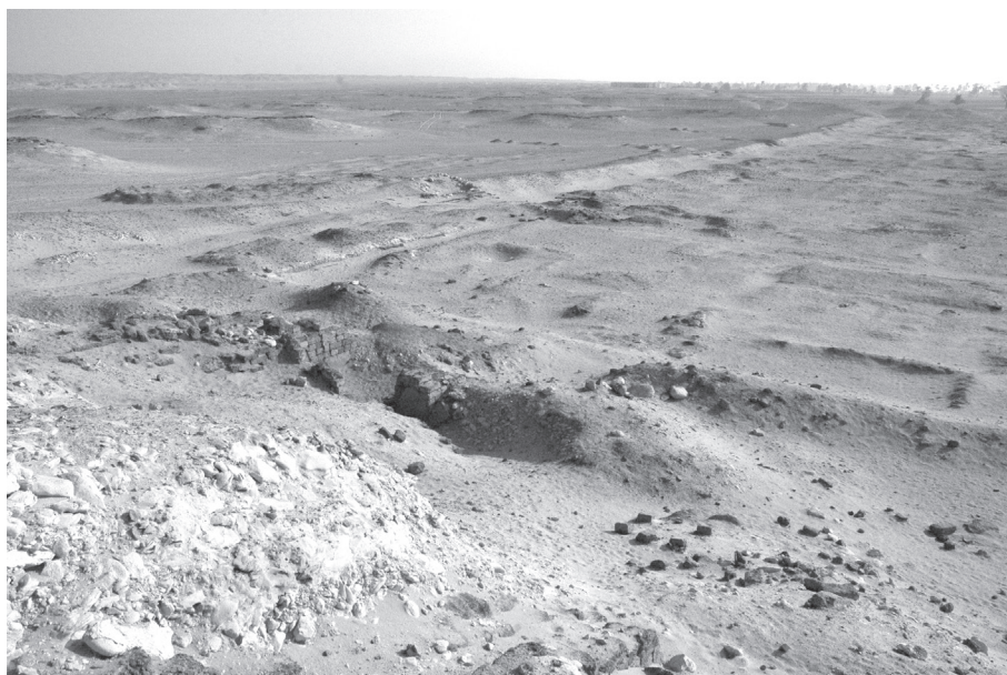
3. kép. Az északi városfal és az északi villák az „akropolisz”-ról nézve

fallal elválasztott, kisebb, téglalap alakú nyugati részből. A kanadai expedíció igazolta, hogy a két építészeti struktúra nem egy időből származik: a keleti városrész északi fala és ugyanennek a falnak az északnyugati sarka mentén megtalálták egy külső védfal maradványait, amely a városfalnak a környezeti hatásoktól való megóvását szolgálta. Mivel a nyugati fal mentén ez a védfal nem épülhetett volna fel, ha a nyugati városrész – amely a keleti városrész nyugati falához csatlakozik – már állt volna, a keleti és a nyugati városrész építése között bizonyos időnek el kellett telnie. 29 A két városrész tervezői és építői azonban – akár ugyanazok voltak, akár mások – azonos típustervek és szabványok felhasználásával dolgoztak: mindkét városrész lakóépületeinél ugyanazoknak a típusterveknek a variációit használták, 30 továbbá a városfalakat mindkét város-