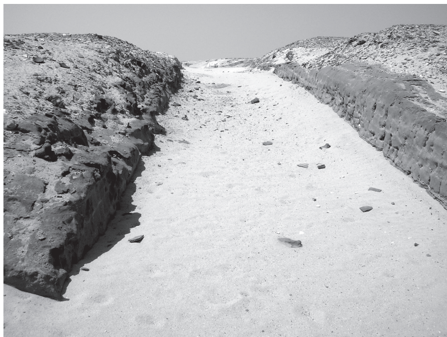
5. kép. A főutca a keleti kapu felől fényképezve

A tervezők és építők a település domborzati viszonyainak a felhasználásával is hangsúlyozták a társadalmi különbségeket. A szektorokat úgy alakították ki, hogy az elit rezidenciák a város legmagasabb szintjén, az északi részen épültek, míg a város