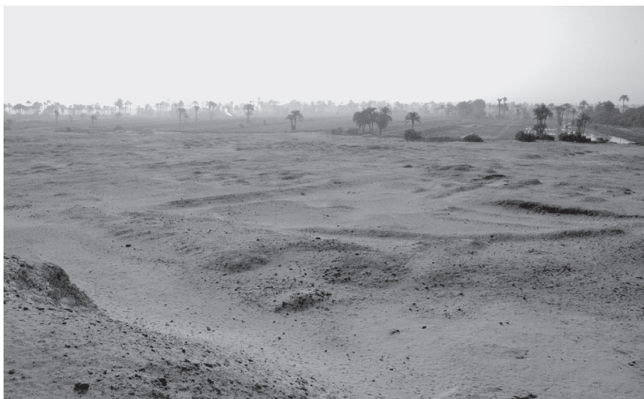
2. kép. A keleti városszél középső és déli része az „akropolisz”-ról nézve

Illahunhoz hasonló, kifejezetten a királyi kultusz kiszolgálására épített települést többet is ismerünk a Középbirodalom korából. 20 Ezek közül a legtöbbit Wahszutról, a Dél-Abüdosban, II. Szenusert utódának, III. Szenusertnek a halotti körzete mellett alapított várossal tudunk. 21 Wahszut III. Szenusert halotti együttesén belüli elhelyezkedése és a város fennmaradt részének alaprajza számos ponton párhuzamba állítható Illahun elhelyezkedésével és alaprajzával. Funkciójuk – legalábbis részben – azonos kellett legyen. Illahun mérete és lakosság száma azonban mind Wahszutét, mind a többi ismert középbirodalmi központilag tervezett városét jócskán meghaladta: a régészeti maradványok, amelyek a város egykori területének valószínűleg kétharmadát képviselik, kb. 130000 m 2 -nyi (384 × 335 m) területre terjednek ki, míg becslések a népességet 3000 és 10000 fő közé teszik. 22 Ezek a számok a kor viszonyai között magasak, és arra mutatnak, hogy Illahun jelentős település lehetett – még akkor is, ha a lakosság szám-