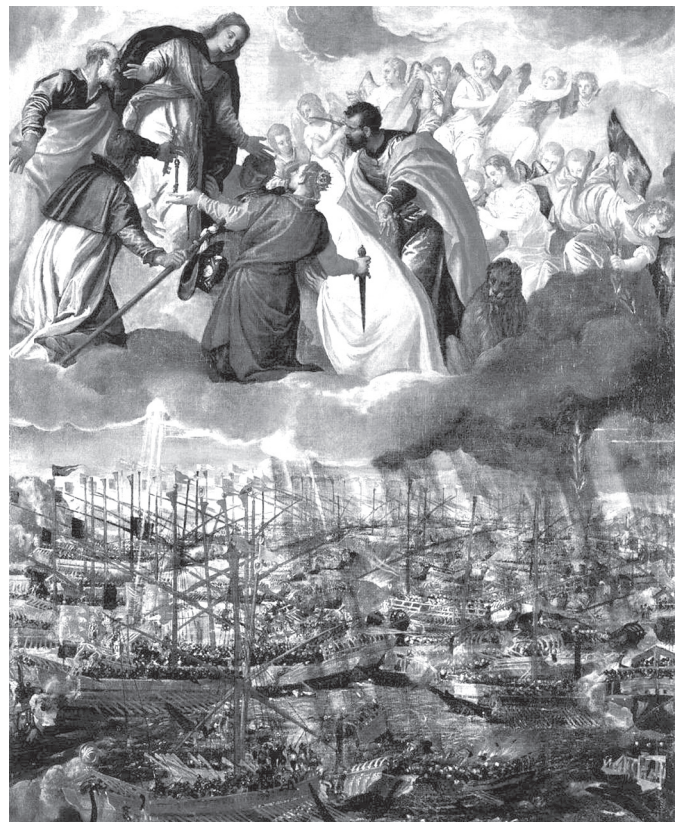
1. kép. Paolo Veronese: A lepantói csata allegóriája . Gallerie dell'Accademia, Venecia

A velencei festő, Paolo Veronese (1528–1588) festményén a lepantói csata allegóriája látható (1. kép). „A felső részen – ahol a keresztény hívők szerint a csata valójában eldőlt –, a felhő-függöny fölött allegorikus jelenet látható: Szent Márk (Velence patrónusa oroszlán-attribútumával) és Juszтина (akinek neve napján az ütközet lezajlott) a Szűzanya oltalmába 59 ajánlja a fehér ruhás Velencét, könyörögve a keresztény flotta győzelméért; miközben Szent Péter és Szent Rókus közbenjár a Szűznél. Jobb oldalon egy angyal – a földi küzdelemben beavatkozván – tüzes nyilakat hajít a törökök hajóira. A kép