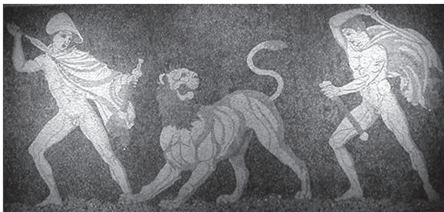
2. kép. Nagy Sándor és társa, Craterus osroslánnal harcol. Kr. e. 3. századi mozaik. Régészeti Múzeum, Pella

Ereje, bátorsága, méltósága folytán az osroslán harcosok és uralkodók (így Osroslánszívú Richárd) kedvelt jelképe még a középkorban és az újkorban is. A heraldikában magasan felülreprezentált a többi állathoz képest. Napjainkban tizenöt európai állam címerében találunk osroslánt, tehát a kontinens országainak egyharmadánál. Összehasonlításul: az afrikai