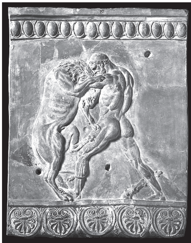
3. kép. Hercules legyőzi a nemeai oroszlánt. Az ún. Campana-reliefek egyike, Kr. e. 1. – Kr. u. 1. század

jól tetten érhető egy jellegzetes asszociációs technika, melynek alapján az állatfajok bemutatásai felsorakoznak, kiegészülve hosszabb-rövidebb kitérőkkel. 9 Tehát az egyik élőlény bemutatása a másikat úgy követi, hogy valamely közös motívumról asszociálunk a következőre. Például a békák ugyanúgy kétléltű életmódot folytatnak, mint a tengeri tehén; a tarajos sül téli álmat alszik, hasonlóan a medvéhez, és így tovább.