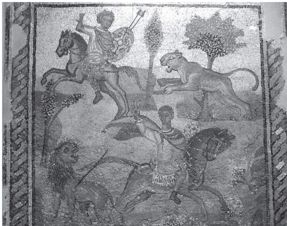
5. kép. Oroszlánvadászat. Észak-Afrikai mozaik. Tripoli Múzeum

jen jóslatot, azaz eligazítást az új haza megtalálásához. Ekkor fogalmazódik meg a híres hitvallás a római nép hivatásáról és a világban betöltött szerepéről. A néhány soros leírás lényege, hogy a rómaiak feladata az emberiség feletti uralkodás: „hatalmukkal uralkodni a népeken” ( regere imperio populos ), illetve a mindennapi élet kereteinek meghatározása: „a békeidőnek szabályt kiróni” ( pacique imponere morem ; vö. a római jog rendszerével). Mivel tehát a rómaiak magukra mint a többi nép feletti uralkodókra tekintettek, érthető, ha az oroszlán, az állatok királya és a hozzá kapcsolódó szimbolika kiemelt helyet foglal el a Naturalis historia állatokról szóló könyveiben is.