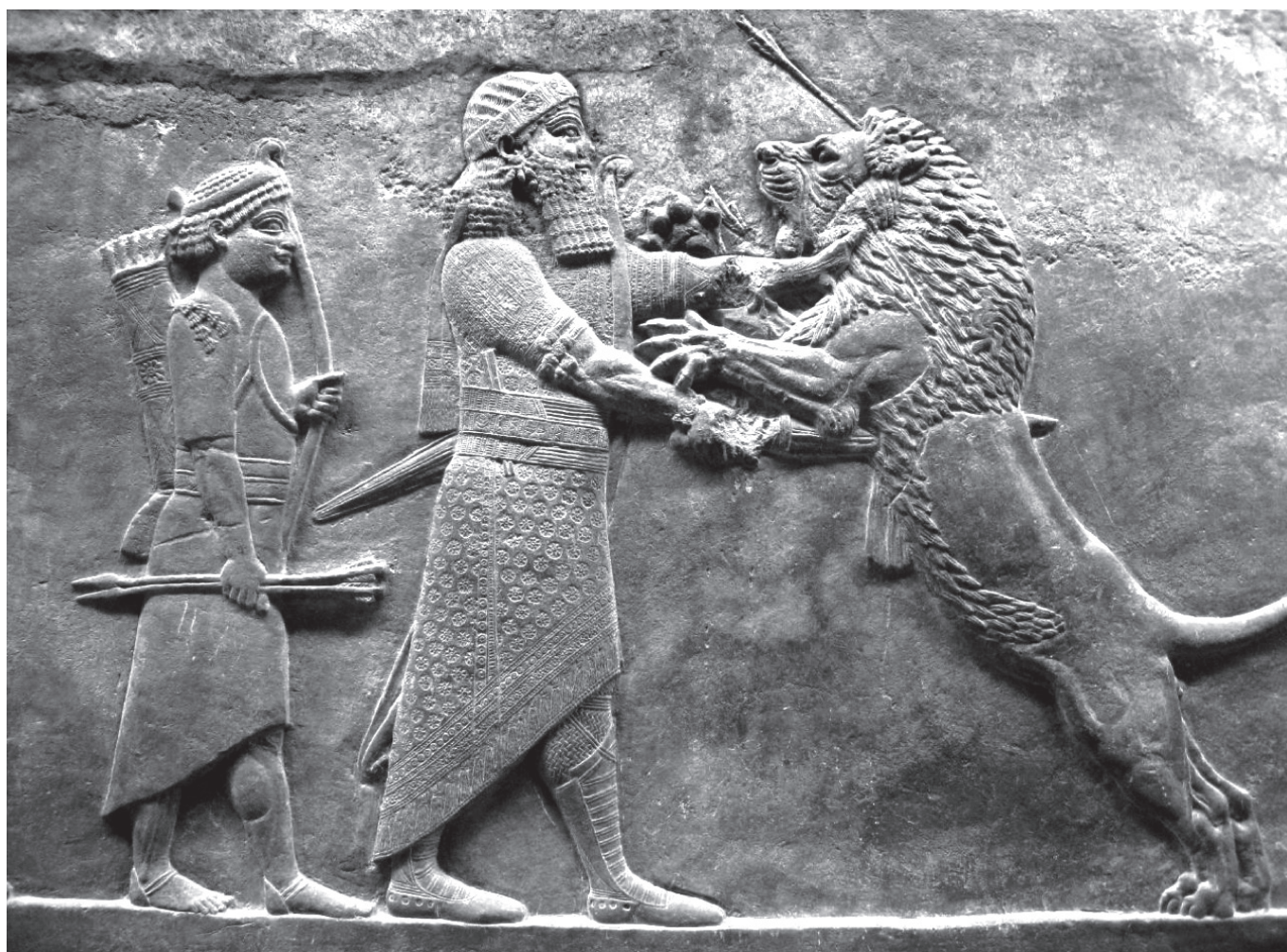
1. kép. Aššur-bān-apli oroszlánvadászata. Ninive, Északi Palota, Kr. e. 669–630. British Museum, London

I dősebb Plinius Naturalis historia című enciklopédikus műve a klasszikus ókor természettudományos ismereteinek egyik legnagyobb ránk maradt gyűjteménye. Hosszú évszázadokon keresztül befolyásolta a természettudományok alakulását: 1 főleg gyógyászati és csillagászati könyvei szolgálták a praktikus ismeretek forrásául egészen a középkor végéig. 2 Később, amikor az európai tudományok fejlődése miatt már túlhaladottá vált, az enciklopédia inkább a filológiai kutatás érdeklődését vonta magára. Plinius ugyanis fáradhatatlanul kivonatolta, összegezte az antik forrásokat,