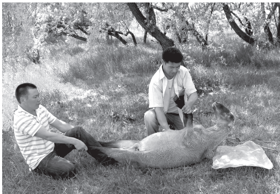
1. kép. Hagyományos mongol juhvágás: a halál beálltának pillanata a főverőér kézi átszakításakor

lóban fogyaszthatóvá válják. 7 A kóser és halal vágás lényeges szempontja, hogy az állatnak minél kevesebb szenvedést okozzanak. Tilos az áldozat szeme láttára fenni a kést, vagy társait levágni. 8 E feltételek a vallásos törvény részei, ha csak egyikük nem érvényesül, a hús emberi fogyasztásra alkalmatlan lesz, ehetetlenné válik. A kivézetetés és kíméletesség alapvető szempontjai annyiból ellentmondanak egymásnak, hogy a tökéletes kivézetetés érdekében nem szabad az áldozatot elkábítani, mert a renyhülő szív működés rontaná a vér távozásának hatásfokát a szervezetből. 9