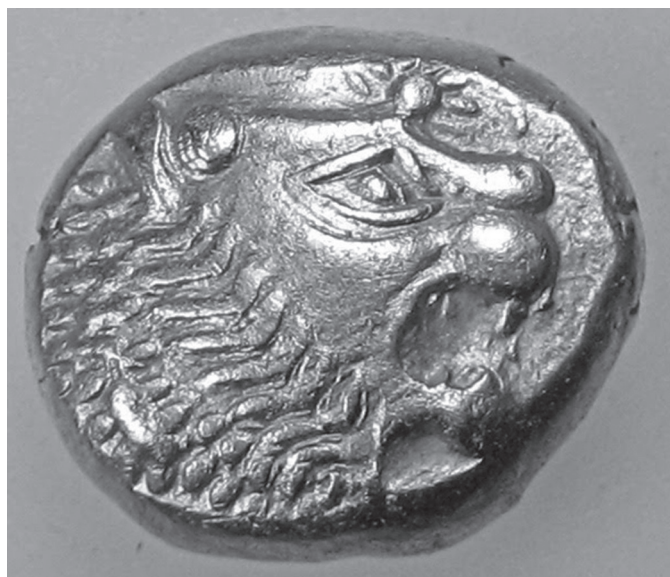
1. kép. Lyd „oroszlán” elektronból

A pénzérmék használatának kezdete a nyugat-anatóliai Lydiához köthető, ahol a Kr. e. 7–6. században megjelennek az első elektron (arany-ezüst ötvözetű) „lyd oroszlánok” (1. kép), majd később ezt felváltják az önálló ezüst és arany lyd érmék. Az ókori mezopotámiai, babilóniai pénzhasználatról ismert az a tény, hogy az előbb említett Lydiával szemben nem törekedtek a pénzérmék használatára, és pénzérmék helyett a pénzként használt fémeket – a Kr. e. 1. évezredi Babilóniában egészen pontosan az ezüstöt – súlyra mérték. 4 A pénzt minden tranzakcióban a súlymérték szerint határozták meg. Nem egységnyi fizetendő érmét határoztak meg, hanem kimérendő, megfelelő súlyú ezüstöt. 5 Éppen ez az a speciális ókori keleti, mezopotámiai pénzhasználati mód, amely a nevezett időszakban a pénz minden fontos jellemzőjét magán viselte, és ezért pénzérmék használata nélkül is teljes értékű pénzről beszélhetünk, hiszen betölti a pénz meghatározásához szükséges mindegyik funkciót. 6