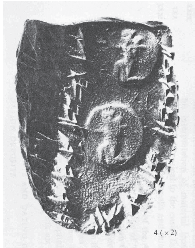
4. kép. II. típusú siglos lenyomata egy persepolisi erődtítmény-táblán (Root 1988 nyomán)

Mégis, annak ellenére, hogy az ezüstöt súlyra mérték, az ezüstrrel kapcsolatos ügyleteknél a babilóni gazdasági források a Kr. e. 1. évezred során egyre gyakrabban meghatározták a tranzakciókban szereplő ezüst sajátosságait. Ez két szempontú lehetett: egyrészt formai sajátosságokat határoztak meg – pl.