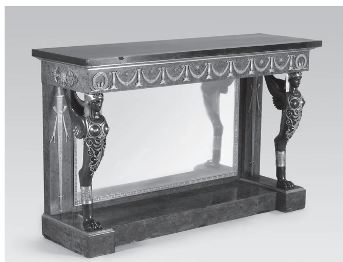
6. kép. Martin Éloi Lignereux – Pierre-Philippe Thomire – Adam Weisweiler: Konzolasztal (18. század vége). Iparművészeti Múzeum, Bútorgyűjtemény. Ltsz.: 24283 a-b

szített (6. kép). Az asztal elülső lábain egy-egy szárnyas női alak látható nemeszkendőben , kilógó hajfürtökkel. Az asztalhoz korábban kandalló 53 is tartozott, melyből mára csupán éppen ez az egyiptizáló motívum maradt meg, ugyanezt bronzba öntött formában ábrázolva 54 (7. kép). A női alakban a görög és