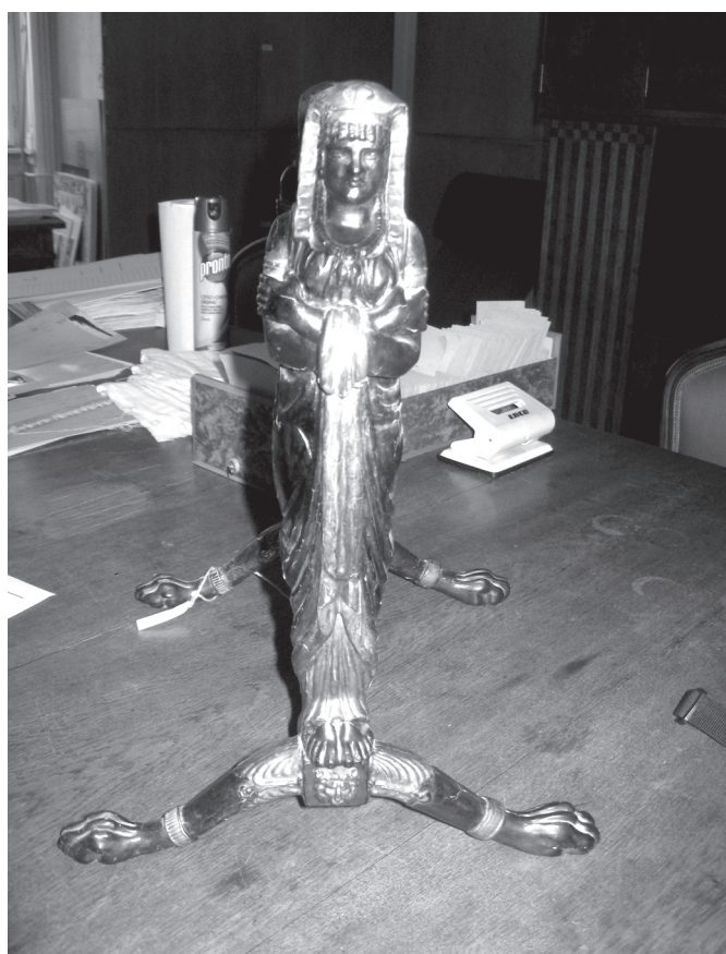
10–11. kép. Empire tükör, 19. század eleje. Készítője ismeretlen. Műhely: Pest vagy Bécs. Iparművészeti Múzeum, Bútorgyűjtemény. Ltsz.: 65.206.1.