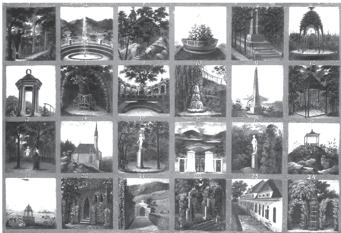
5. kép. Rombauer János: Angolkert a hotkóci Csáky kastélyban (1803). Magyar Nemzeti Múzeum, Történelmi Képcsarnok

halála után Fertőd helyett Kismarton 52 lett a család tartózkodási helye. Innen származik a magyarországi egyiptomán emlékek egyik legkidolgozottabb példája, egy konzolasztal, amelyet a korban igen népszerű francia bútortervező páros, Percier és Fontaine tervei alapján Lignereux és Thomire ké-