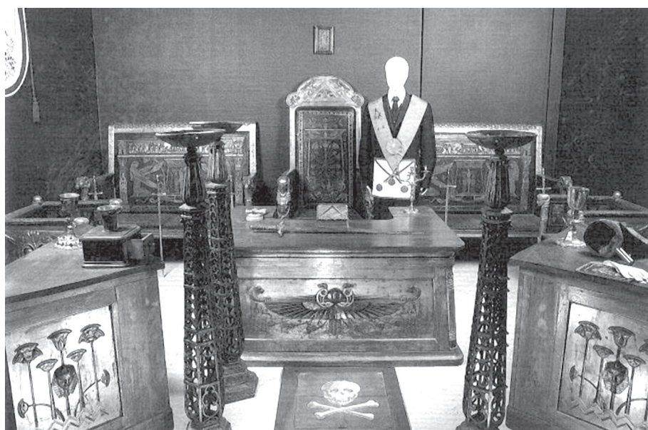
14. kép. A Magyarországi Symbolikus Nagypáholy berendezése. Magyar Nemzeti Múzeum, Szabadkőműves Gyűjtemény. Ltsz.: 1956.494-498

Pulszky, aki 1869-től többek között a Nemzeti Múzeum igazgatója lett, 77 az 1868-tól újjáéledő magyar szabadkőműves páholyélet egyik kulcsfigurájává is vált. A kiegészés után létrejövő magyar páholyok 1886-ban a Magyarországi Symbolikus Nagypáholyban egyesültek, melynek nagymestere éppen ő lett. Tíz évvel később a Podmaniczky utcában felavatták a páholyházat is. 78 A szabadkőműves eszmék sokat merítettek az elmúlt századokban a tempomosok és rózsakeresztesek által is jól ismert hermetikus hagyományokból, melyek alaptézise a bölcsesség és tudás Egyiptomból való eredeztetése. 79 Az ennek következtében népszerűvé váló alkímia és a bölcsék kövének keresése az egyiptozófia fogalmába tartozik, ami