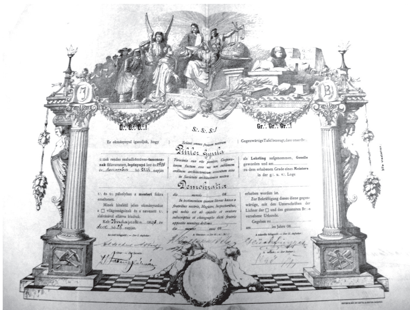
15. kép. Pikler Gyula szabadkőműves mesterlevele, 1896.

Magyar Nemzeti Múzeum, Szabadkőműves Gyűjtemény. Ltsz.: 1981.131.587 (a szerző felvétele)