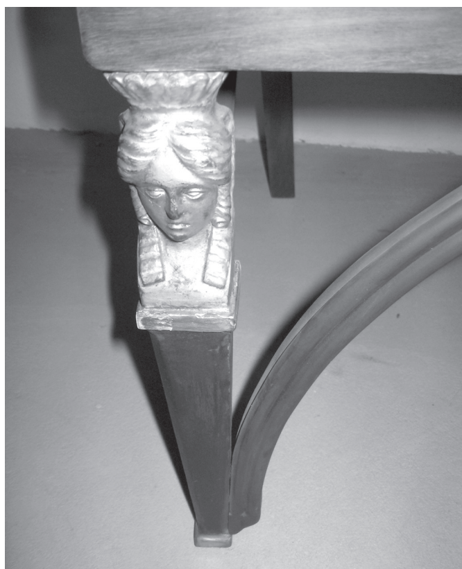
12–13. kép. Empire szék lótusszal és nemeszkendővel díszített fejjel, 18. század. Készítője ismeretlen. Műhely: Pest vagy Bécs. Iparművészeti Múzeum, Bútorgyűjtemény. Ltsz.: 53.3932.1-2