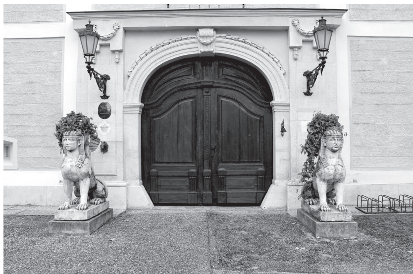
3. kép. Hédervár. Kapuőrző szfinxek. Készítője ismeretlen

szerepel. 43 A kilenc kép közül az egyiket egy egyiptomi piramis és ház elnevezéssel látta el a művész (4. kép). A piramis esetében felfedezhető a hasonlóság a nyugat-európai Cestius-piramist utánozó jellemzőkkel. Az egyiptomi ház viszont inkább a gótizáló stílus jegyeit mutatja, így kérdéses az egyiptomi jelző. Az Esterházyak cseklézi kertje esetében Charles Joseph du Ligne említi, 44 hogy egy kerti pavilont egyiptomi táj képével díszítettek. Elképzelhető, hogy a csákvári egyiptomi ház belső falain is ilyen jeleneteket ábrázoltak.