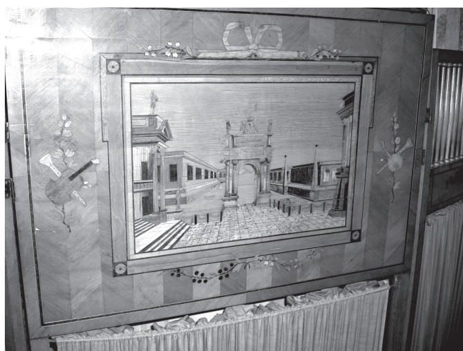
8–9. kép. Bauernfeind János: Spanyolfal intarziás díszítéssel (18. század vége). Iparművészeti Múzeum, Nagytétényi Kastélymúzeum. Ltsz.: 14487

a jellegzetes egyiptomán nemeszkendős szfinx ábrázolásmódja köszön vissza, amely Nyugat-Európában is a kandallók legkedveltebb egyiptizáló díszítőmotívumaként szerepel.