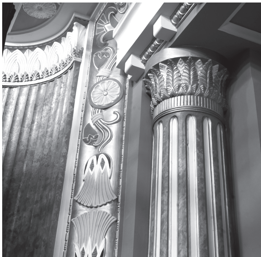
17. kép. A régi vetítévásznat keretező fríz

dekoráció elveszítette eredeti jelentéstartalmát. Míg eredetileg a fríz virágokból és bimbókból állt, az utóbbiak napjainkban inkább hasonlítanak fenyőtobozra (15–16. kép).