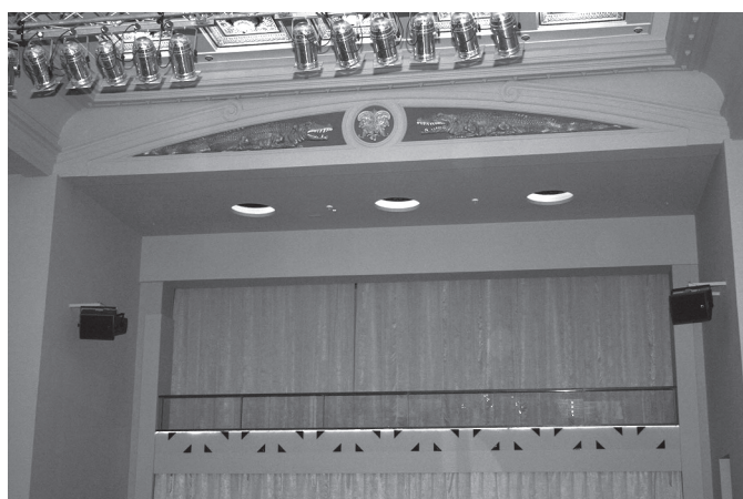
2. kép. Az 1929-ben épült békéscsabai Csaba-mozgó (Phaedra Mozi) krokodilokat ábrázoló falfestménye, amely a mozivászon felett helyezkedett el

egyiptomi dekorációját, csak a falakat borító izléstelen, barna műbőrburkolat emléke kísértett. Rövid utánajárással hamar kiderült, hogy a mozi egyiptomi elemekben gazdag, belső dekorációja napjainkig rejtve maradt az egyiptológia előtt, holott méltán tarthat számot nagyobb szakmai figyelemre ez a kultúr-történeti emlék. Hazai viszonylatban azonban az egyiptománia kutatása kiaknázatlan területnek számít. 5