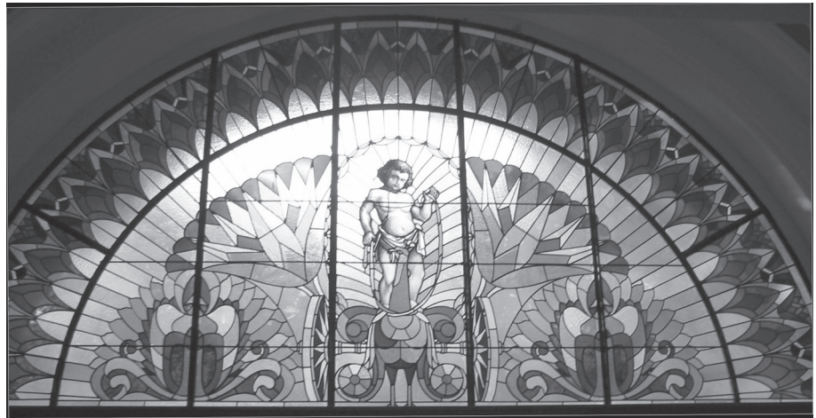
10. kép. A főbejárat feletti félköríves bevilágító

A kaposvári mozi homlokzati díszéhez nagyszerű párhuzamot kínálnak az 1919–1920-ban épült szegedi Belvárosi mozi díszítvényei, ahol a főbejáratot koronázó tumpanonon hatyúkkal keretezett női fej látható, az épület bal oldali tumpanonját pedig egy volutával és szőlőfürtökkel keretezett, szarvokat viselő férfimaszk díszíti (8–9. kép). 34 A homlokzatot díszítő maszkok ebben az esetben sem köthetők össze az épület funkciójával, pusztán dekorációs célt szolgálnak. 35 További érde-