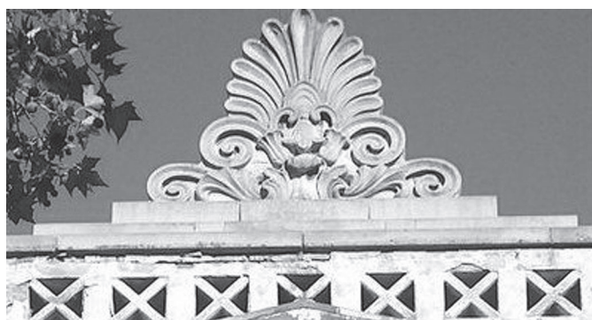
6. kép. Az épületet koronázó palmetta akrotérion (H. Molnár K. é. n. alapján)