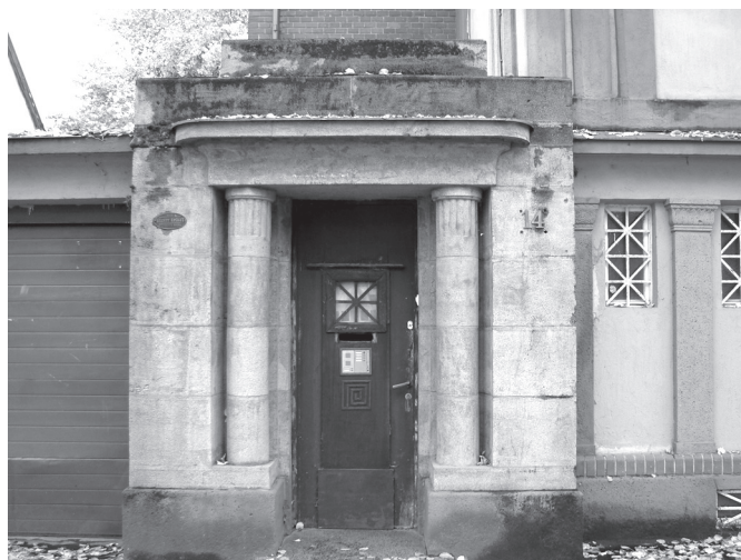
18. kép. A Lamping-villa zárt kapualja

hoz, de mindenképpen figyelemreméltó Huszár György korábban idézett „egyiptomi filmekről” szóló visszaemlékezése is. Rendelkezésre álló hazai párhuzamok híján Kaposvár egyiptizáló stílusban épült moziját érdemes nagyobb kontextusba helyezve, mozi- és filmtörténeti szempontból is megvizsgálni. A húszas években épült egyiptomi stílusú mozik építését gyakran Tutankhamon sírjának felfedezéséhez kötik. 57 Bár kétségtelen, hogy a sír feltárása ismét felerősítette az egyiptomi kultúra iránti vonzódást, 58 az egyiptomi stílusban épült mozik két fennmaradt példája – a párizsi Louxor és a Hollywoodban épült Egyptian Theater 59 – bizonyosan korábbi, mint a híres régészeti felfedezés. 60 Ami viszont mindenhol már sokkal korábban eljuttatta Egyiptom varázsát, az a film volt. 61 A téma népszerűségét jól mutatja, hogy 1908 és 1918 között öt Kleopátráról szóló filmet forgattak, köztük az 1917-ben készült híres változatot, Theda Bara 62 főszereplésével, továbbá 1909 és 1915 között már nyolc „múmiás” film létezett. 63 A korai kosztümös filmek gyakori és népszerű témája lett Egyiptom, és a film elhozta a mozivászon keresztül az egyiptomániát minden nézőhöz. 64 A húszas évekre a mozi már kilépett a kávéházak világából, maga mögött hagyta a csömozikat, és önálló épületet követelt magának. Alaprajzi