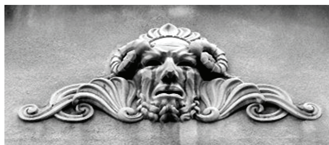
7. kép. A főhomlokzatot díszítő maszk (H. Molnár K. é. n. alapján)