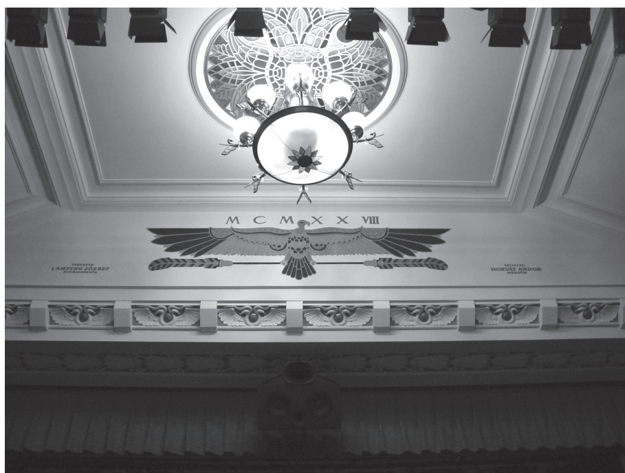
14. kép. A vetítövásznon feletti keselyű-ábrázolás

A nézőtérre egy szokatlanul alacsony és széles, oszlopokkal keretezett ajtó vezet. A terembe lépve azonnal a vetítövásznon fölött elhelyezkedő hatalmas keselyű ábrázolás tűnik a látogató szemébe, amelyet a kivitelező és a tervező neve keretez (14. kép). 40