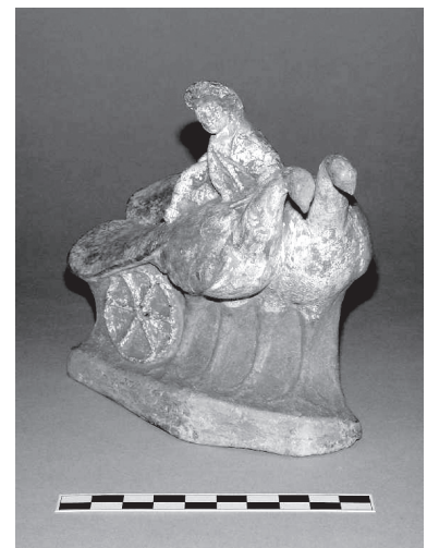
11. kép. Myrinából származó terrakotta szobrocska. Fitzwilliam Museum, GR.100.1984