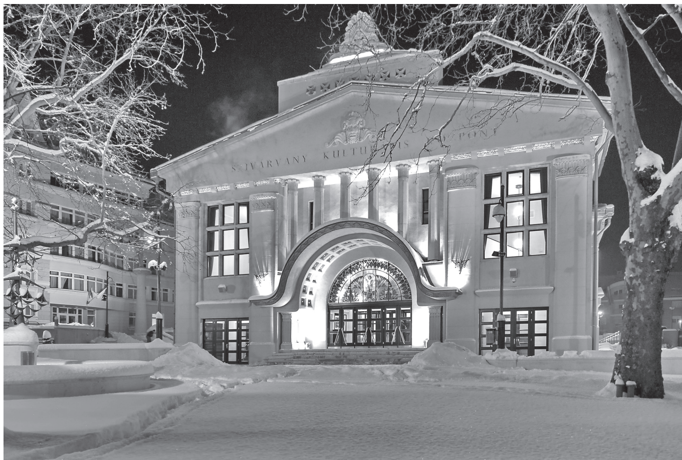
12. kép. Esti kivilágításnál előtérbe kerülnek a bevilágító egyiptomi motívumai