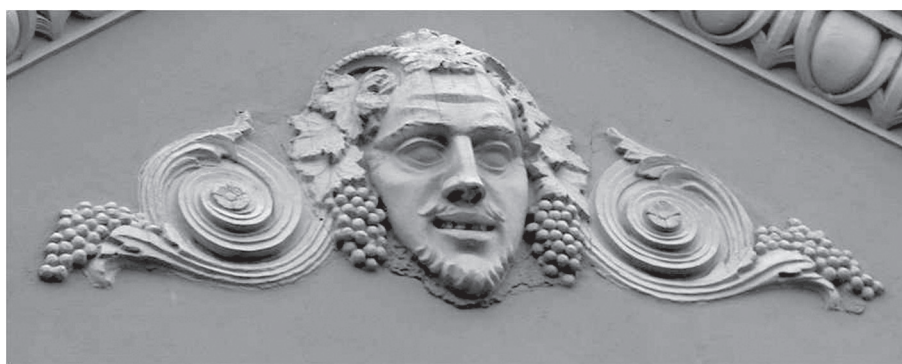
8–9. kép. A szegedi Belvárosi mozi homlokzati díszei