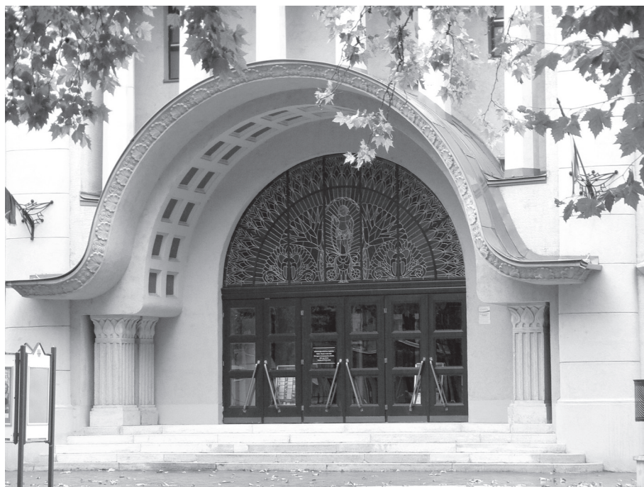
4. kép. A mozi főbejárata a felette elhelyezkedő félköríves, ólombetétes, festett üveglablakkal

Még néhány évvel ezelőtt az Art Deco stílusmegjelölést nem volt szokás az építészetre alkalmazni, mivel az az 1920–1930 között készült iparművészeti tárgyak és bútorok egy csoportjának jellegzetes divatáramlata volt – jöllehet, az Art Deco elnevezés sem volt akkor még általánosan ismert. Mint új je-