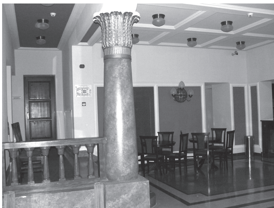
13. kép. A mozi előtere