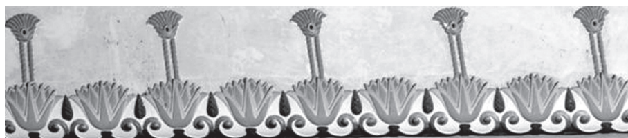
16. kép. A páholsor virágdíszei felújítás előtti állapotukban (H. Molnár K. é. n. alapján)

tól, és díszítőművészeti mintakönyv használatára utal. 42 Az egymás mellé felfűzött virágdíszek párhuzamát érdekes módon az újasszír művészetben találjuk meg, inspirációs forrásként Nínivében és Horszábádban feltárt, egyiptomi hatást tükröző domborművek szolgálhattak. 43 A motívumokat Owen Jones közölte elsőként The Grammar of Ornament című munkájában, 44 majd a 19. század során számos további ornamentikával és építészettel foglalkozó kiadványban tűntek fel. 45 Az építész egy ilyen kiadvány alapján tervezhette meg a páholsor díszítőművét, amelynek színezésnél az egyiptomi ikonográfiának megfelelően a kinyílt virágokat világoskékkel festették, a bimbókat pedig sötétkékkel (16. kép). A mozi felújításakor azonban a kinyílt virágok eredetileg világoskékkel festett szirmai sötétkék színezést kaptak, a sötétkék bimbókat pedig bearanyozták. A színváltozás miatt a