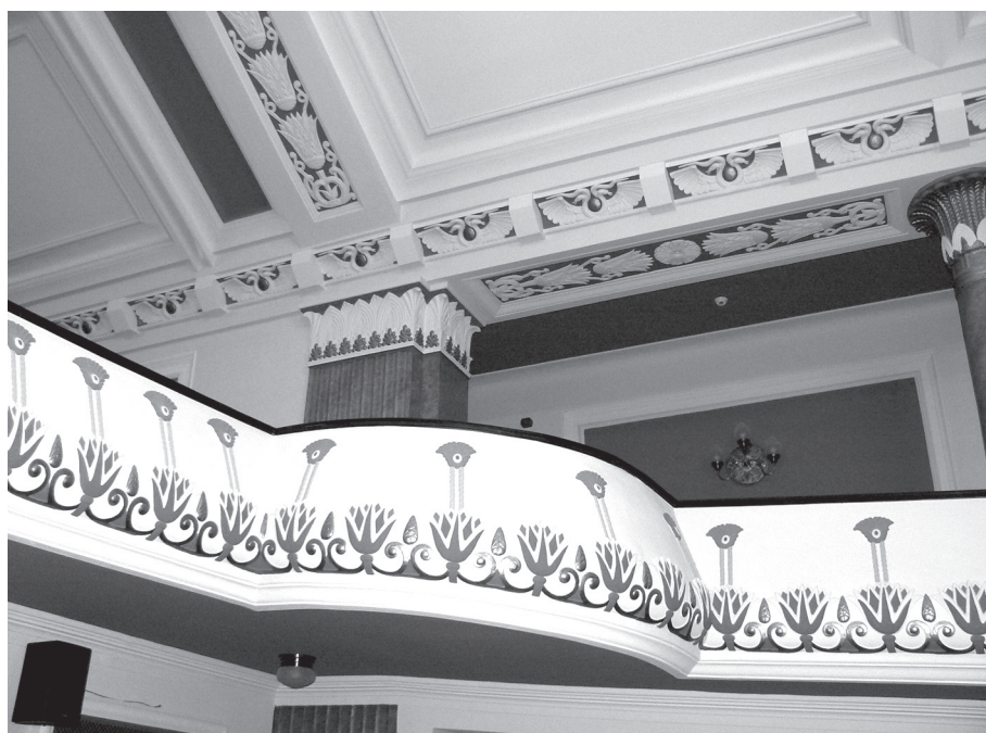
15. kép. A nézőtér egyiptizáló dekorációja (a szárnyas napkorongokból, valamint a lótvuszvirágokból és rozettából álló frizekkel, és a páholsor lótvuszvirág motívumaival)

A páholsoron végigfutó, lótvuszvirágokból és bimbókból álló fríz (15–16. kép) képi megfogalmazása eltér a hagyományos egyiptomi ábrázolásmód-