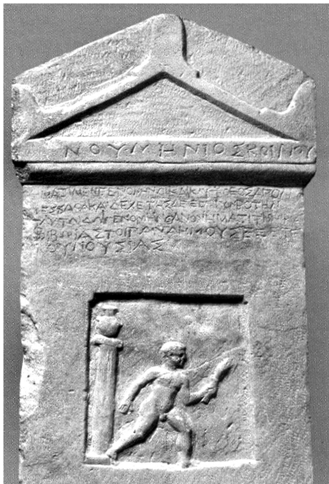
1. kép. A fáklyás futó Numénios sírfelirata Thessalonikéből. Kr. e. 1. század (Párizs, Louvre MA822)

Bendis bizonyosan nem tartozik a legismertebb antik istenek közé. Thrák neve olyasvalamit jelent, hogy „aki összeköt, egyesít”. A szó összefügg a thrák Benna városával, aminek jelentése „közösség”. 1 Bendis ábrázolását fogadalmi feliratok domborműveiről és vázafestményekről ismerjük. Thrák vadászruhában, csuklyás fejfedőben jelenik meg, kezében dárda, lábánál vadászkutya. Nem csoda, hogy gyakran thrák Artemis-