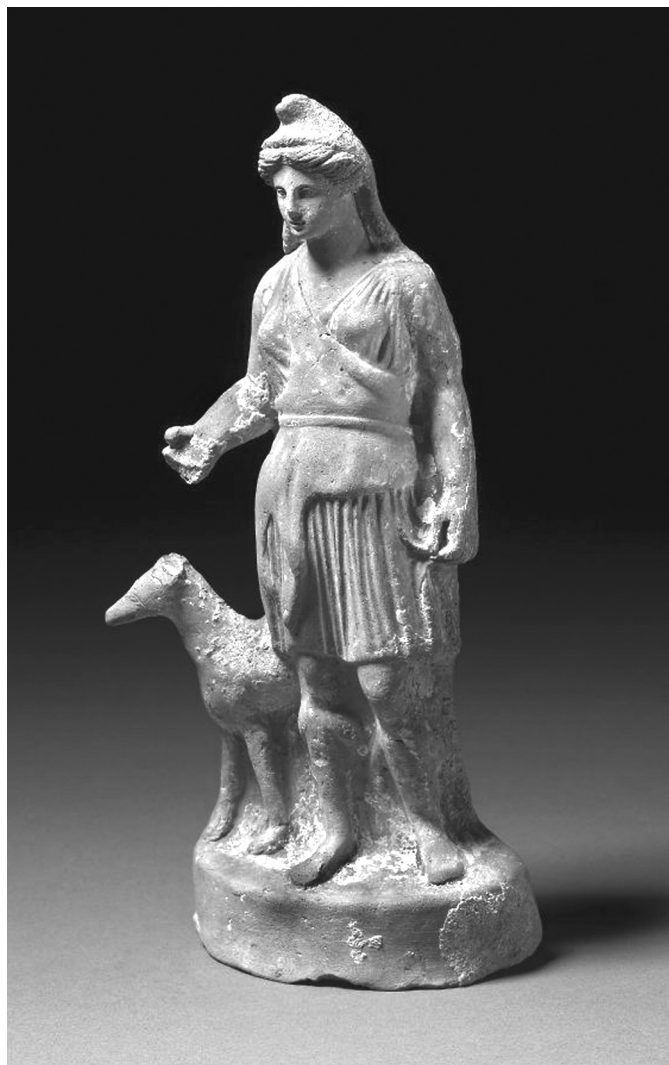
2. kép. Artemis-Bendis Athénban készített terrakotta-szobrocskája. Kr. e. 350 körül (London, British Museum)

Kérdés, hogy mi készítette az athéniakat arra, hogy meghonosítsák Bendis kultuszát Athénban, mindez mikor történhetett, és Platón miért szötte bele művébe éppen ezt az istennőt. E látszólag jelentéktelen mozzanat tisztázásához a Platón-filológia egyik legvitatottabb területére kell merészkednünk. Melyik év nyarán játszódik az Allam (vagy legalábbis annak első könyve), és mindezzel mit szeretett volna Platón jelezni? 4 Nos, a könyv cselekményének (tehát nem megírásának) datálására számos elmélet született, nem véletlen, hogy Debra Nails szerint gyakorlatilag bármelyik évet megjelölhetjük Kr. e. 432 és 404 között, vagyis a peloponnésosi háború idején, de akár hogyan is választunk, nem kerülhetjük el a súlyos anakronizmusokat. 5 Platón például megemlíti a megarai csatát, amelyben testvére, Adeimantos vítezkedett. Ez a csata Kr. e.