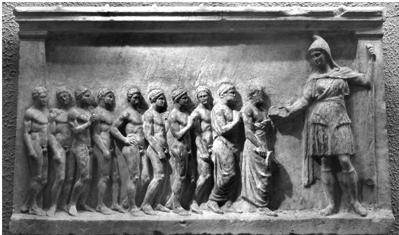
4. kép. Bendis és hívei. Athéni márvány fogadalmi dombormű. Kr. e. 400–375 körül (London, British Museum)

Atyámat, Kephalost Periklész bírta rá, hogy ideköltözzön, és ő harminc évig élt itt, anélkül hogy mi, vagy ő valaha is bírósági ügybe keveredtünk volna, akár vádlóként, akár