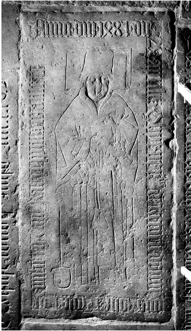
3. kép. Johannes Tröster sírja a regensburgi dómban ( Die Inschriften der Stadt Regensburg II. Der Dom St. Peter I. Bis 1500. Wiesbaden, 2008, 192, Abb. 109, Tafel XXXVII. Kat.-Nr. 280 nyomán)