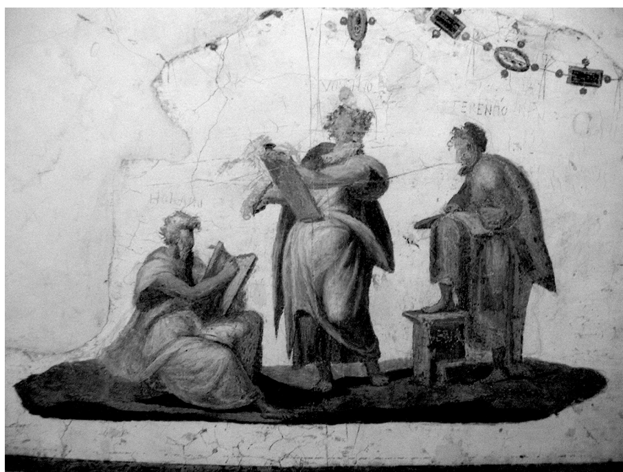
1. kép. Terentius, Vergilius és Homéros az Angyalvár egyik freskóján. Perino del Vaga és műhelye, 1540-es évek

C ommovet enim constantes animos relecta Sirenearum melodiarum pulsatio 1 („Ugyanis az állhatatos lelkeket is megindítja újraolvasva a sziréndalok likettetése”) – ez általában igaz lehet a szerelemben, azonban egy irodalmi mű recepciójában korántsem törvényszerű. Az imént idézett Ovidius-allúziót Johannes Tröster 1454-ben írt dialógusában olvashatjuk, mely egyike a korai humanista irodalom méltatlanul elfeledett alkotásainak. Akárcsak szerzője, a nagy reményű litterátus, úgy műve is a feledés homályába merült. Pedig biztatóan indult a pályája: a bécsi egyetemi tanulmányok után Enea Silvio Piccolomini, a későbbi II. Pius pápa familiárisaként olyan kiválóságok nevelője lett, mint a majdani III. Pius pápa és a későbbi V. László király. Az 1452-es királyszöktetési puccs azonban derékba törte a karrierjét. Kétévnnyi nélkülözésének vetett véget, mikor a dialógus révén Vitéz János szolgálatába fogadta. A nemzetközi, elsősorban osztrák–bajor szakirodalom Tröster mint humanista könyvgyűjtőt méltatja, ebben a témában számtalan publikáció jelent már meg, mivel sorra kerülnek elő kötetek a hajdani könyvtárából. 2