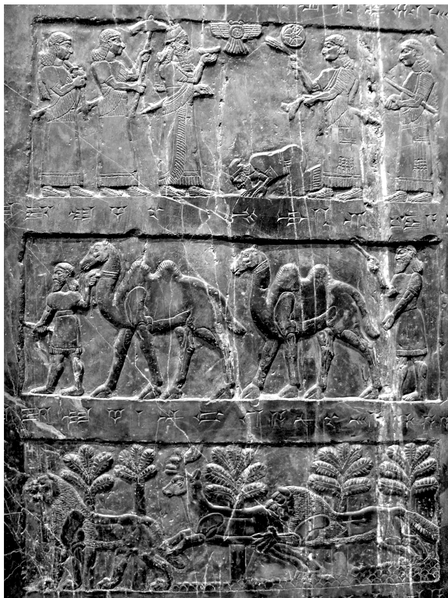
1. kép. III. Šulmānu-ašarēdu (Kr. e. 859–824) baktriai tevéket kap kihallgatási ajándékul. Jelenet a Fekete obeliszkről (Niederreiter Zoltán felvétele)

lentőségű cikkében felvázolta az óasszír kereskedelem rendszerét, amelyben főállású kereskedők és megbízott ügynökeik összetett pénzügyi tranzakciókat végeznek (befektetőket toboroznak, hozamvárokozásokat becsülnek meg, stb.), a szállított értékcsikket piaci alapon értékesítik, és elszámolásukat ezüstben (ritkábban aranyban) végzik. 1982-ben Larsen John Gledhillel írt közös tanulmányában tulajdonképpen leszámol a szubsztantivista álláspont lehetőségével a mezopotámiai gazdaságtörténet összefüggésében.