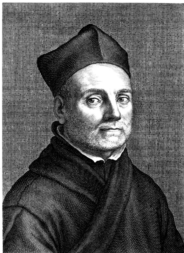
P. ATHANASIVS KIRCHERVS FVLDENSIS è Societ: Iesu Anno ætatis LIII.