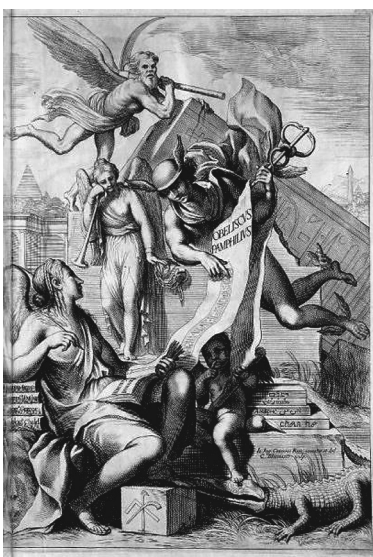
3. kép. Athanasius Kircher Obeliscus Pamphilus (1650) című művének címlapja

ismert volt az a nézet, miszerint a hermetikus szövegek olyan ősi kinyilatkoztatásokat tartalmaznak, amelyek lényegében két forráscsoportra vezethetők vissza. Az egyik ilyen forráscsoport az ősi egyiptomi vallás, a másik pedig az adamita 6 vagy sethiánus hagyomány, amely a Föld benépesedése idején Noé utódai révén került Egyiptomba. A tradíció két ágát tehát lényegében összekapcsolták, ami azt a „tradicionalistának” nevezhető elképzelést fejezte ki, hogy azok a források, amelyekről azt gondolták, hogy az ősi egyiptomi tudást közvetítik, sokkal ősbibb tudást tartalmaznak, mint a másik, nevezetesen a Noé utódai révén az özönvíz előtti időkre visszavezethető eredendő bölcsességet. A hermetikus szövegek datálásának tehát az volt a tétje, hogy rajtuk keresztül úgymond birtokba lehessen venni az isteni bölcsességet. Amikor tehát Isaac Casaubon (4. kép) 1614-ben alapos filológiai érveléssel rámutatott, hogy a her-