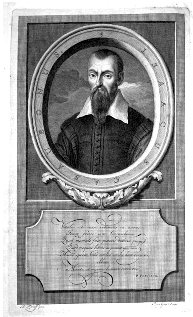
4. kép. Isaac Casaubon (1559–1614) arcképe az Epistolae 1709-es kiadásából (C. Fritsch et M. Böhm, Rotterdam)

Felfogásában az eredendő igazság megragadása és feltárása szempontjából Hermés állítólagos írásainak központi helye van. Korai tekintélyekre támaszkodva amellet érvel, hogy a vízözön előtt létezett egy olyan egységes kultúra, amelynek