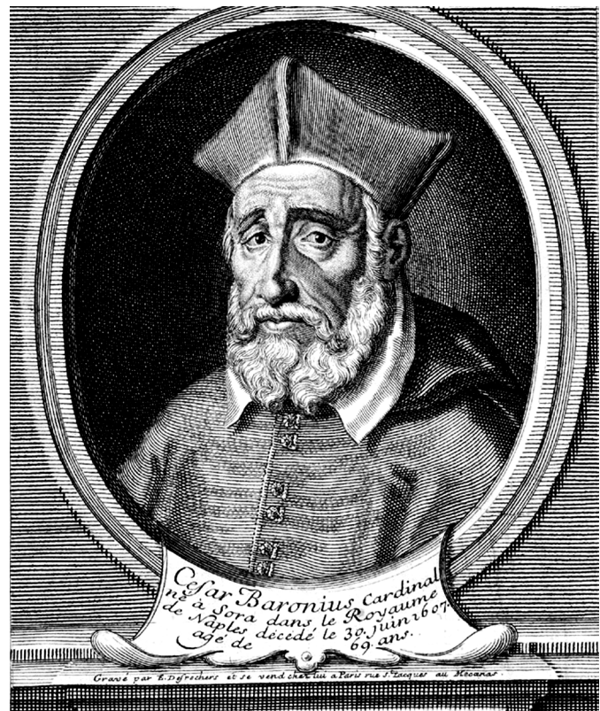
5. kép. Cesare Baronius (1538–1607). 17. századi metszet