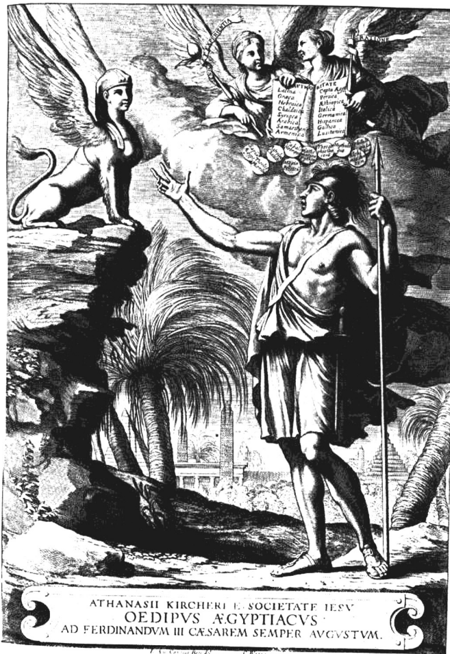
6. kép. Athanasius Kircher Oedipus Aegyptiacus (1652–54) című művének címlapja

rejlik, és nem is annak aprólékos elemzése során tárul fel, hanem csak abban az olvasóban formálódik ki, aki rendelkezik a megfelelő hermeneutikai módszerrel ahhoz, hogy bármelyik szövegben meglássa a hermetikus tanítást. Ebből következően a fordítások mögött a megfelelő interpretációs módszer segítségével kell megtalálni az eredeti üzenetet, amely nem a szavak közvetlen értelmében nyilvánul meg, hanem abban a tanításban, amely az értelmező számára, a szövegektől független emlékcsoporton, jelen esetben az egyiptomi hieroglifák szimbólumrendszerében fejeződik ki. A szöveg értelmezője tehát archeológus. Arra törekszik, hogy az újabb nyelvi rétegek alatt – azokat lehetőleg nem elpusztítva – feltárja a nyelv alatti, metaforikus rétegeket, amelyeknek a hieroglifák olyan imaginatív kifejeződései, amelyeket akkor birtokolhatunk, ha megfejtjük e jelek valódi értelmét. A kronológia mellett Kircher számára így lesz kulcsfontosságú a Hórapollón neve alatt fennmaradt Hieroglyphika című írás is. Amint látjuk, e felfogásban a megfelelő hermeneutikai módszernek működésbe kell lépnie ahhoz, hogy a szövegek, és azokon túl más típusú emlékek (például az obeliszkok) is eredendő lényegük szerint tárulhassanak fel.