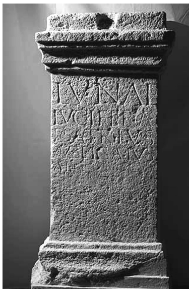
2. kép. Szakrális felirat Luna Luciferának szentelve

Lángja s a fegyvere is mindeneket lebíró, fél maga Juppiter is, reszketnek az istenek ettől, borzad a sok folyam és Styx komor árnya velük. (Révay József fordítása)