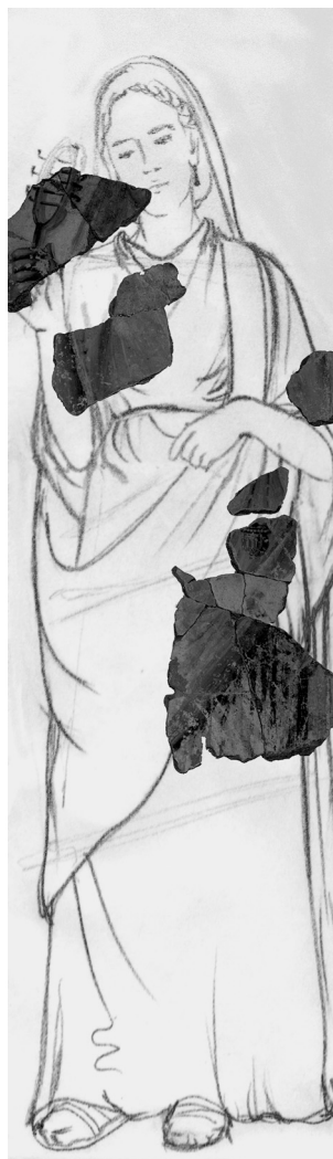
11. kép. Isis-papnőt ábrázoló falfestmény a savariai Iseumból (Harsányi Eszter és Kurovszky Zsófia vázlata)

A már többször említett körmenetben felvonuló papságról Apuleius így ír: „A magasztos vallásnak ezen földi csillagai bronz, ezüst és arany csörgettyűikkel élesen csendülő csilingelésre zendítenek.” Ugyanabból a régészeti jelenségből több mint 100 lánnyi freskótöredéket tártunk fel. A precíz restaurátori munka eredményeképpen a páratlan falfestményeletből több, egyértelműen az Isis-kultuszhoz kapcsolódó ábrázolást is rekonstruáltak a szakemberek. Feltételezhetően egy ajtóbélletben állhattak azok a freskórészletek, melyek életnagyságú Isis-papnőket ábrázolnak (11. kép). Egyikük a jobbában sistrum ot tart, bal kezében pedig egy aranyszínű edény látható (12. kép). Apuleius így tudósít minket erről a tárgyról: „...a negyedik az igazságosság jelvényét emelte magasra... ugyancsak ez vitt egy mellformára gömbölyített kis arany edényt, amelyből tejet áldozott.”