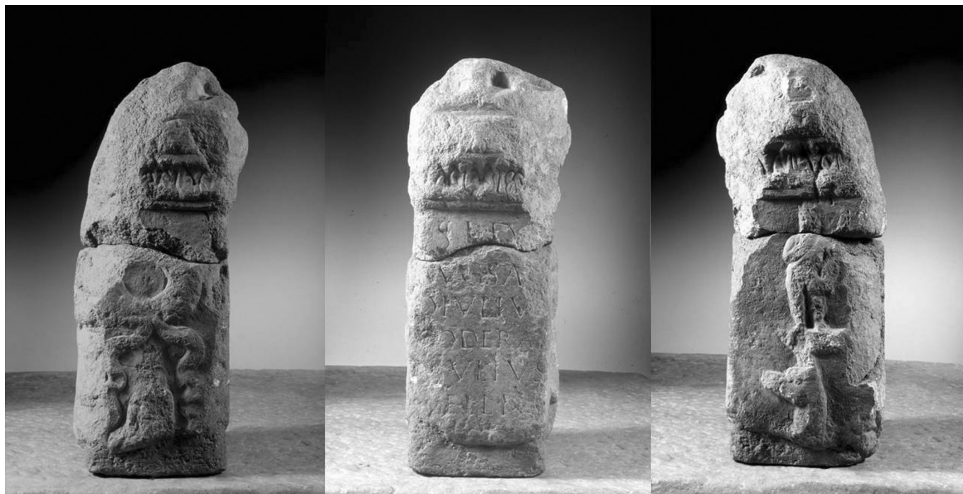
6. kép. Sakál-, maszk- és koszorúábrázolás a Moderatus-bázison (Dabasi András felvétele)

nyításával zajlik. A köemlék felső részén látható lábfej alapján Tóth István már korábban azt feltételezte, hogy ez egy szobor maradványa lehet. A munka során a faragvány tetején látható csapolásnyomok segítségével egy stilizált aediculában álló istenalakot rekonstruálnak a szakemberek.