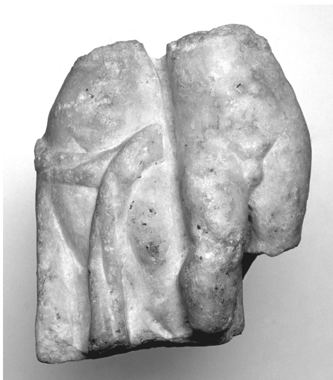
3. kép. Amor és Psyche szobortöredék

A szentély „földi” küszöbét vélhetően a herculaneumi falfestményen ábrázoltakhoz hasonló Sphinx Augusták őrizték. Savariában eddig két nekik szentelt oltár került elő.