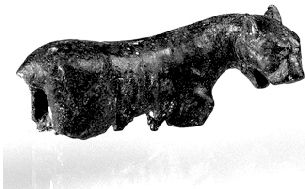
4. kép. Párducszobrocska Savaria Isis-szentélyéből

A XI. fejezet felvonulási jelenetének végén ezt olvashatjuk: „a főpap és azok, akik az istenszobrokat vitték, meg azok,