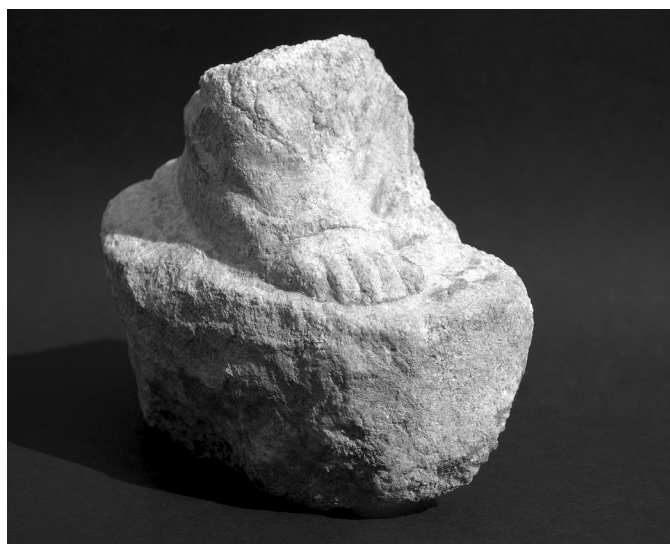
8. kép. Márványszobor töredéke

mennyezethez tartozott. Valószínűleg ez az épületrész, amely a szentély temenosfalához kapcsolódott, egy ma még pontosan nem tisztázott funkciójú, de az Iseumhoz tartozó terem része volt. Az elpusztult épület falfestményes feltöltésében egy bronzcsengő ( tinntinnabulum ) került elő, amely ugyan nem egyértelműen az Isis-kultuszhoz kötődő emlék, de elképzelhető a szentélyben való használata.