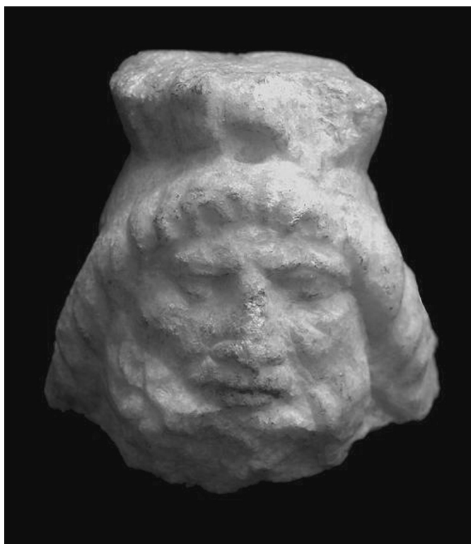
9. kép. Márvány Sarapis-fej

Apuleius leírásából tudjuk, hogy az Isis-körmenetben résztvevő „férfiak, nők nagy tömege lámpával, fáklyával, viaszgyertyával és egyéb fajta mesterséges fénnel hódolt az égi csillagok ősanyjának”. Az ásatások során talált mécses-töredékek közül említést érdemel néhány különleges darab. Az egyik egy Ammon-Jupitert ábrázoló mécses, a másik kettő pedig az asztrális szimbólumok miatt figyelemre méltó. Sol Napisten és Luna Holdistennő alakját láthatjuk a discussukon. Ezek a mécses típusok más környezetben is előfordulhatnak, a mi esetünkben azonban maga a lelőhely, azaz az Isis-szentély miatt fontosak. A szentély ásatásai során több területen kerültek elő műhelytevékenységre utaló nyomok. Számunkra a legérdekesebb az az ólomból készült lumula , amelyet a nyugati temenos külső részén találtunk. Ez a próbadarab arra utal, hogy szakrális vonatkozású vagy bajelhárító funkcióval bíró tárgyakat is készítettek a szentély közelében. Az említett hold alakú függőt egy olyan régészeti jelenségben találtuk, amelyben a szentély talán legfontosabb isiacus -ábrázolásait hordozó falfestmény anyaga feküdt. Az első kultuszhoz köthető freskótöredéken az istennő sistruma látható (10. kép).