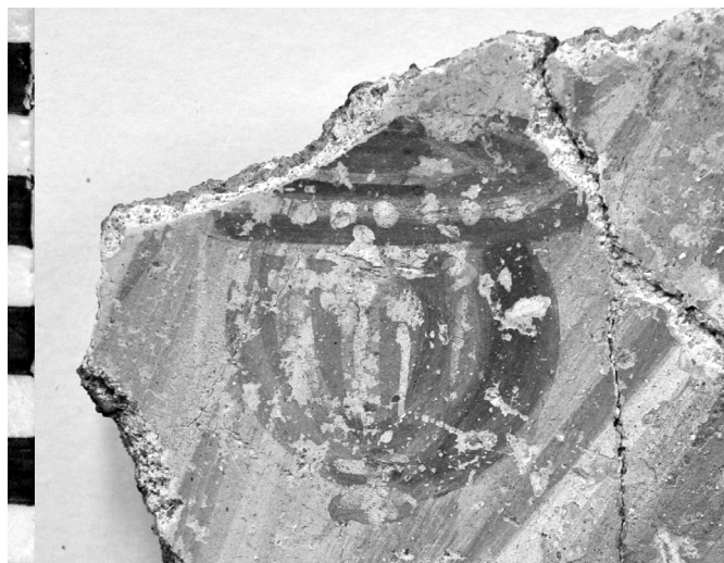
12. kép. Situla ábrázolása az Iseum falfestményén

Savaria Isis-szentélyének falfestményei szinte szóról-szóra az apuleiusi szövegben leírtakkal megegyező ábrázolásokat mutatnak. Ha a falfestményeket körmeneti jelenetként értelmezzük, s összevetjük ezt a gazdagon díszített pompeii Isis-szentély porticus ából ismert párhuzamával, újabb bizonyítékát találjuk annak, hogy Savariában a mindennapi szertartásokat és a nagy Isis-ünnepeket is méltó környezetben, egy gazdagon díszített szentélyben tartották meg.