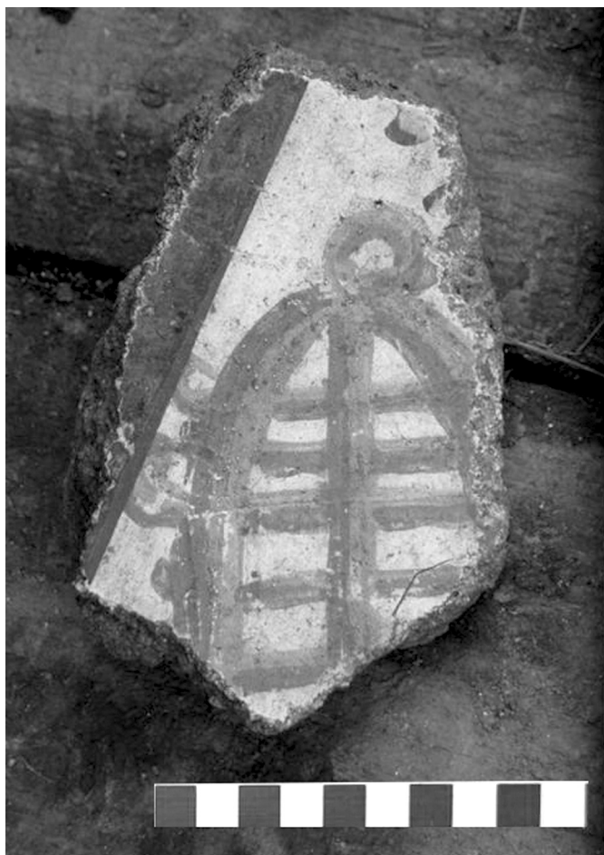
10. kép. Sistrumot ábrázoló falfestménytöredék