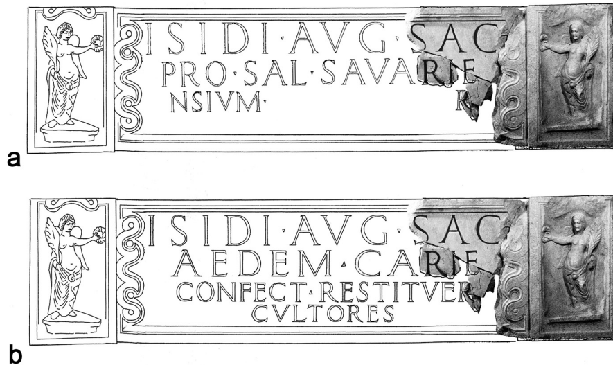
1. kép. Az Iseum homlozati főfeliratának két lehetséges kiegészítése Mráv Zsolt (a) és Alföldi Géza (b) szerint (Mráv Zsolt és Isztin Gyula munkája)

beszegett szélén és egész felületén tündöklő csillagokkal volt telehintve, amelyeknek kellős közepén a telihold árasztotta lángoló fényét.” A Fényhozó Holdnak szentelt oltár azonosított lelőhelye alapján eredetileg az Isis-szentélyben állhatott. További vizsgálatra érdemesíti ezt a feliratos emléket az, hogy a felső részén több, valamiféle tárgy rögzítésére alkalmas, ólommal kiöntött csaplyuk van. Feltételezhető, hogy szoborbázisként szolgált.