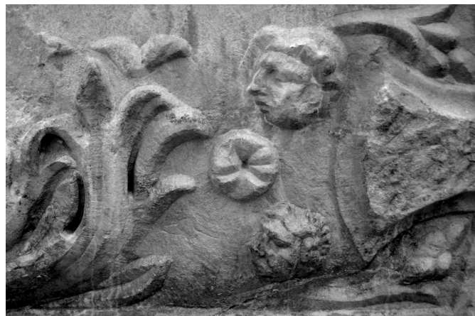
5. kép. Szélisztenek ábrázolása az Iseum homlokzati gerendáján

Savaria Iseumában a tekintélyes méretű pódiumtemplomnak csak az alapfalai maradtak ránk, a Kr. u. 4. századi viszsabontott állapotukban. Ennek alapján viszonylag kevés in-