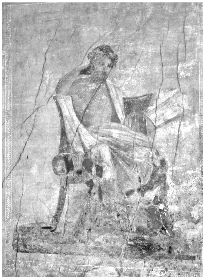
Olvasó férfi egy pompeii falfestményen. Kr. u. 1. század (Pompeii, Casa di Menandro)