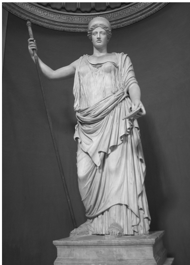
Iuno márványszobra (az úgynevezett Barberini Iuno; Róma, Musei Vaticani)

Három különböző hangot hallunk a versben: azt, amelyik a iustus virt dicsőíti, az istennőét, és végül a rekurzióval játékosan odébbálló költőfiguráét. A különböző hangok különböző értelemben beszélnek. Az első affirmatív, a második inkább negatív az első pozitív olvasatára vonatkoztatva, a harmadik pedig felfüggeszti a diskurzust, és egy másik műfajban jelöli meg a folytathatóság irányát, hogy azután a 4. római óda ( Descende caelo... ) ezt látszólag folytassa, de valójában beteljesületlenül hagyja. Mindez szükségessé teszi a költői hangok és a szerző tudatos megkülönböztetését a szöveg értelmezésében. 17 Az indító strófák szövelezése az interpretáció központi kategóriájaként ajánlja olvasójának a morális társadalmi értékeket, de a teljes szöveg „üzenete” ezzel kapcsolatban tökéletesen meghatározhatatlan. A költő láthatatlan marad.