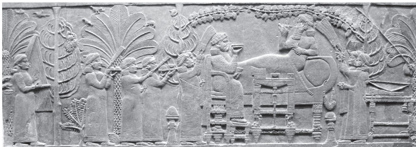
1. kép. Assur-bán-apli lugasjelenete. Dombormű a ninivei északi palotából, Kr. e. 645 körül. London, British Museum.

Közelebbi és tartósabb kapcsolat fűzte a görögöket a föníciaiakhoz. Találkozási pontjuk volt a dél-krétai kikötő, Kommos, valamint Ischia szigete Közép-Itália magasságában. Mindkét nép felbukkant Etruriában, és mindkettő telepeket hozott létre Szicíliában, ahol hamarosan fellángoltak közöttük az ellentétek.