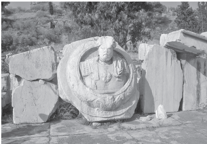
6. kép. Hadrianus pajzsképe Eleusisban.

A theóris általánosan használt kifejezés az attikai görögben a szent hajóra, amely egy szent küldöttséget szállít valamely szentélybe. Érdekes, hogy a gyógyító szentélyek látogatására sohasem használták ezt a kifejezést: a gyógyulni vágyó hívek hiketés vagy synphoitétés névre hallgattak. A szent és a profán