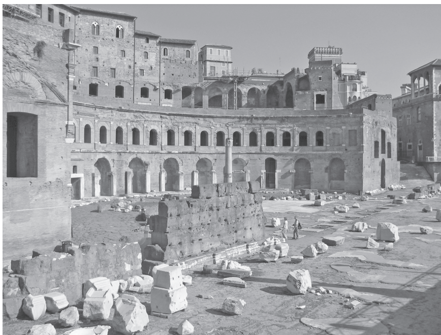
1. kép. Traianus üzletháza. 100 és 110 között épült a damaskusi Apollodóros tervei alapján, 150 üzlethelyiségében az ismert világ minden élelmiszerét be lehetett szerezni

Petronius, Satyricon 75–76 Révay József fordítása