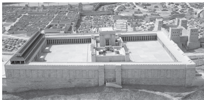
8. kép. A jeruzsálemi Templom makettje. A Kr. u. 70-ben elpusztított jeruzsálemi Templomba zarándokok százazrei jártak az évi három zsidó zarándokünnep idején

A zsinagógarendszer az egész oikumenét behálózta. A legfontosabb régészeti feltevések szerint a zsinagógák néhány kivétellel szintén a tengerparti városokra koncentráálódnak. Nyugatról Kelet felé haladva: Elche (Spanyolország), Ostia és Bova Ma-