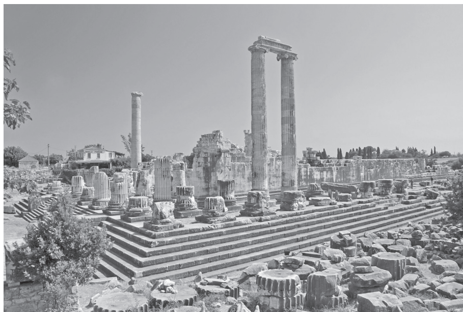
7. kép. A didymai szentély. A Milétos városához tartozó didymai Apollón-szentély híres volt jósdájáról, amelyet alkalmanként a császárok is igénybe vettek

Az „összekapcsoltság” ( connectivity ) ebben a kérdésben is központi szerepet játszik. 48 A Római Birodalom területén élő zsidó diaszpóra számára ugyanis elemi szükséglet volt az „oházával” (Iudaea/Syria–Palaestina) való rendszeres és folyamatos összeköttetés biztosítása, különösen a Templom lerombolása ( churbán ) előtt, valamint a patriarchátus fennállása idején (Kr. u. 2–5. század). Részben ezért, részben a kitűnő kereskedelmi lehetőségek miatt a legfontosabb diaszpóráközpontok a forgalmas kikötővárosokban alakultak ki (például Alexandria, Ostia, Korinthos), még ha a fennmaradt régészeti és epigráfiai leletanyag ezt nem is minden esetben támasztja alá. (Az anatóliai falvakból és városokból nagyságrendileg több zsidó feliratos anyag került elő, mint például Korinthosból vagy Thessalonikéből.) Az alexandriai Philón a klasszikus görög gyarmatosítás szakkifejezéseivel mutatja be a zsidó diaszpórát: mintha Jeruzsálem, az „anyaváros” apoiikiákat alapított volna az oikumenében (lásd a 6. szöveget). 49