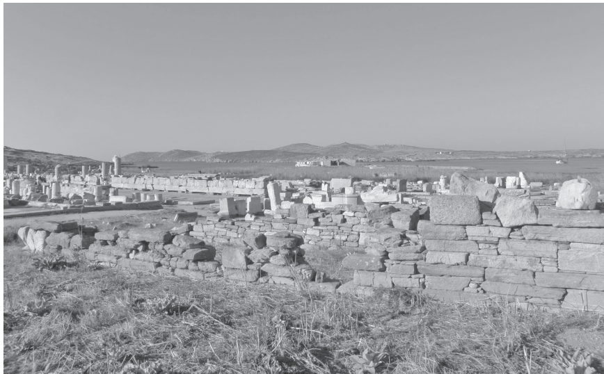
2. kép. A délosi rabszolgapiac. Naponta akár tízezer rabszolga is gazdát cserélt itt

Végül a hetedik csoportot az „emberek teste és lelkei” ( sómátón kai psychas anthrópón , Jel 18,13), vagyis a rabszolgák alkotják. Az ókorban – bár bizonyos sztoikus értelmiségiek és a keresztények is felemelték szavukat a rabszolgákkal szembeni időnként kegyetlen bánásmód ellen – nem létezett abolitionista mozgalom. 12 Még a rabszolgafelkelések ideológiájában sem szerepelt magának az intézménynek a megszüntetése: a cél vagy saját állam megalapítása volt, ahol a szerepek felcserélődtek, és az eddigi dominusokból servusok lettek; vagy a rabszolgák egykori hazájukba szerettek volna visszatérni. Walter Scheidel becslése szerint, ha durván 5–8 millió rabszolga lehetett a Római Birodalomban (nagyjából minden tizedik ember), akkor évente 250–400 ezer rabszolga beszerzésére volt szükség, hogy ez a szám fennmaradjon. 13 A beszerzés fő útjai lehettek a háborúk, a kalózkodás és banditizmus, az adós-, sőt önkéntes rabszolgaság, valamint a rabszolgák házilag történő szaporítása. A rabszolga-kereskedők fő vadászterülete Kis-Ázsia (Phrygia, Lykia, Kilikia), Syria és Thrakia volt. 14 A birodalom területén kívülről is érkeztek rabszolgák: Fekete-Afrikából a Szaharán és Etiópián keresztül, a szkíta