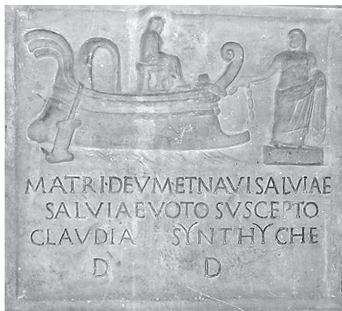
5. kép. Kybelé megérkezése Rómába.

A görögök az egész Földközi-tenger medencéjét alaposan „megfertőzték” saját kultúrájukkal a gyarmatosítás és a római hódítás között eltelt több mint fél évezredben (Kr. e. 8–2. század), de különösen a hellenizmus időszakában. 35 Vallási és kulturális téren a rómaiaknak komolyan kellett számolniuk a hellenizmus meggyökerezésével, ami nem esett nehezükre, hiszen a Kr. e. 3. századtól ők is el- és befogadták a hellén kulturális koinét , elsősorban „rokonsági alapon”. ( Nota bene , a rómaiak trójai eredetének legendáját is hellénisztikus kori görög szer-