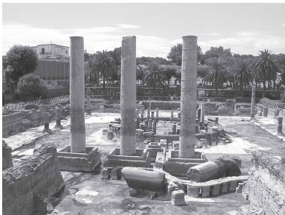
3. kép. Sarapis temploma Puteoliban. Az Alexandria után valamennyi nagyobb kikötővárosban megtalálható Sarapis-templom a Kr. e. 1. században épült

Mikor aztán fölszálltam, hajtani kezdett, és ő a gyeplőt fogta, én meg a magasba emelkedve, ahogy keletről nyugat felé repültünk, végignézttem a városokat, népeket és nemzeteket, s közben, miként Triptolemos, egyre szórtam valamit a földre. Nem emlékszem már rá, mit szórhattam, csak annyi maradt meg bennem, hogy a lent bámészkodó emberek mind megélték, bárhová jutottunk röptünkben, szerencsét kívántak utamhoz. Miután a tengernyi látivalót megmutatta nekem, s engem is megmutatott az éljenző tömegnek,