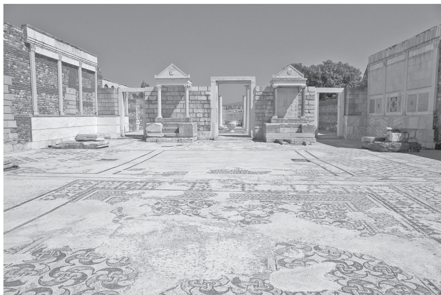
9. kép. A sardisi zsinagóga. Az ókori világ legnagyobb feltárt zsinagógája, mintegy 1500 férőhellyel, valószínűleg a Kr. u. 5. században épült

zsidó vallás de facto univerzalizistikussá vált: részben a diaszpóra létrejöttével, részben a Septuaginta és más bibliafordítások megszületése révén, részben azért, hogy a judaizmus egy „anikonikus kultusz”, Izrael Istenének hatalma elvben bárhol megtapasztalható.