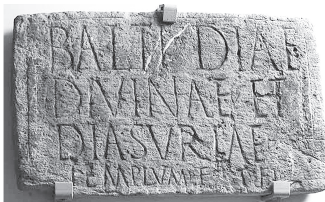
2. kép. Baltis és Diasuria (Dea Syria) késő római kori templomának építési felirata (Magyar Nemzeti Múzeum)

Összefoglalóan tehát elmondható, hogy a gyors nyelvi asszimiláció és a szíriai kultuszok szerény száma miatt óvakodni kell a Severus-kori szír bevándorlás társadalmi, gazdasági és különösen kulturális kihatásainak túlértékelésétől. A Severus-kori Aquincumban a szíriaiak számarányának növekedése az összlakosságon belül a történeti háttér és a rendelkezésre álló csekély epigráfiai adatmennyiség ismeretében elfogadható következtetés, ugyanakkor fontos hangsúlyozni, hogy a Syria provincia területén élő hat, az etnikum fogalmát kimerítő népcsoport nem azonos mértékben képviseltette magát az alsó-pannoniai tartományközpontban. A biztosan szíriai származásúak szinte minden esetben római polgárok, latin vagy latinósított nevet viselnek, felirataik is latin nyelvűek. Ők római kulturális identitásúak voltak, függetlenül esetleges italicus, nyugati, görög-makedón vagy éppen sémita származásuktól. A Severus-korban feltételezhető egy kisebb létszámú, görög ajkú csoport is, amelynek tagjai talán Szíriából vándoroltak be,