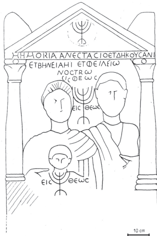
3. kép. Az albertirsai római sírsztélé (Magyar Nemzeti Múzeum, a rajz Radan 1973, 271, Fig. 5 alapján)