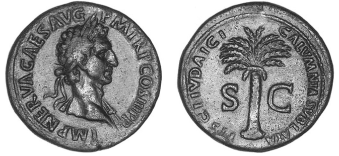
3. kép. Nerva pénzérméjén „a zsidópénztár gyalázata elvétett” felirat olvasható

és „zsidó módra élönek” – a capitoliumi Iuppiter tiszteletére – befizetnie (3. kép).