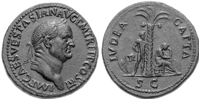
1. kép. Vespasianus Iudaea elfoglalásának alkalmából vert érméje

A zsidók és rómaiak kapcsolata a Makkabi-felkelésig nyúlik vissza, amelynek győelmét követően Kr. e. 161-ben a frissen megalakult Hasmóneus állam úgynevezett „jóakarati és együttműködési” ( eunoia kai symmachia ) szerződést kötött a római senatussal. Ez alig volt több írott malasztnál, ugyanakkor jelezte a római érdeklődést abban a szférában, ahol előbb a Seleukida, majd az Arsakida (parthus) királyság számított a Birodalom legfőbb ellenségének. A Hasmóneus dinasztia bel-