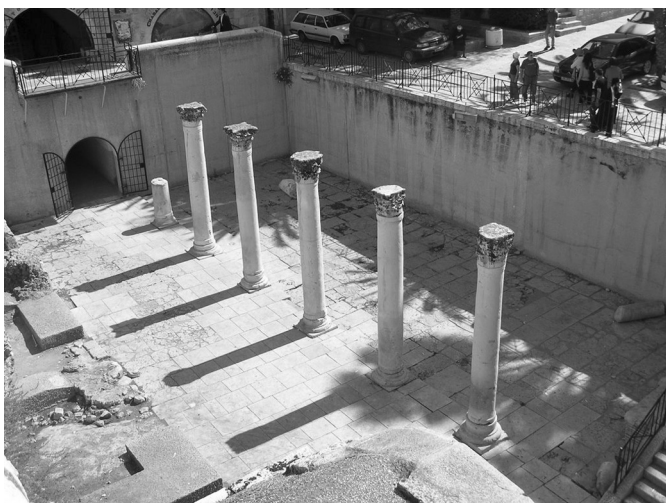
4. kép. Aelia Capitolina (az egykori Jeruzsálem) észak–déli irányú főutcájának ( cardo ) részlete

A zsidó vallás elmélete és gyakorlata még az abszolút multikulturális birodalomban is egyedülállónak számított. A rómaiakat persze nem annyira az elmélet, mint inkább a gyakorlat érdekelte — Cicero Az istenek természete ( De natura deorum ) című művében nem is említette a zsidók istenfelfogását —, s ez alapján nem véletlenül sorolták be a zsidókat a „babonás népség” ( gens superstitiosa ) kategóriájába (lásd az 1. szöveget). A többség a szembetűnő, gyakorlati különbségeket fedezte fel a zsidók életmódjában: a kép és szobor nélküli istenkultusz, a kötelező szombati pihenőnapot, a furcsa étkezési szokásokat, a körülmetélést stb. Az alexandriai görögök három fő pontban fogalmazták meg a zsidók elleni vádjait, amit azután a római értelmiség is átvett tőlük: „emberellenesség”