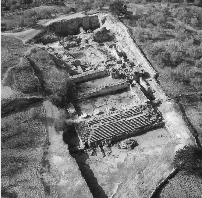
6. kép. Heródes az észak-galileai Omritban is építtetett egy templomot Augustus tiszteletére

benne gyökerezik az a meggyőződés, hogy ezek Isten végzése, hozzájuk kell ragaszkodni, s értük szükség esetén örömet meg kell halni.” 3 A micvót (vagyis a kötelező érvényű vallási parancsok) túlnyomó többsége ráadásul az egész életet átfogóan irányító szabályrendszert alkotott: az istentisztelet helyes módjának előírása és az idegen istenek imádásának tiltása mellett az étkezés, a házasság, a gyermeknevelés, a ruházkodás, de még az állatokkal és növényekkel való bánásmód is szigorú szabályokhoz volt kötve. A zsidó vallás a rómaiak számára teljesen idegen, „babonás” és „barbár” szokásrendszer volt, aminek szabad gyakorlását ugyan törvényileg garantálták, de ez a viszonylagos vallásszabadság egy kényes hatalmi-politikai egyensúlyon alapult, amit a hatalmon lévők bármikor egyoldalúan felmondhattak. Elég volt ehhez egy hibbant császár, mint például Caligula, aki elrendelte: minden zsinagógában helyezték el portróját, a jeruzsálemi Templomban pedig állítsák fel gigantikus kultuszszobrát — máris kész volt a háborús helyzet (lásd a 2. szöveget). Attis-Cybelé, Atargatis, Isis-Osiris vagy Bél szentélyeiben természetesen semmi akadály nem lett volna egy ilyen rendelet végrehajtásának.