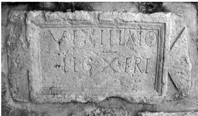
2. kép. A Iudaea/Palaestinában állomásozó legio X. Fretensis egyik különítmények építési felirata