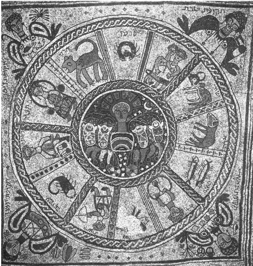
7. kép. Napszekeret, zodiákusjegyeket és a négy évszaktot ábrázoló mozaik a Bét Alfa-i zsinagógából

A gonosz és istentelen Ézsauval szimbolizált Róma a 3. század közepére minden szempontból negatív jelentéssel telítődött, bár a „testvériség” hangoztatásáról a rabbik sohasem feledkeztek meg. R. Kahana, aki Babilóniában és Palesztinában is élt a 3. században, így beszél arról a profetikus időszakról, amikor a nemzetek a Föld minden részéből ajándékokat visznek a Sionban lakó Messiásnak: „A gonosz római állam így érvel majd: Ha azokat, akik nem a testvéreik, így fogadják, mennyivel inkább bennünket, akik a testvéreik vagyunk.” 9 Róma szellemi-erkölcsi színvonalára a 3. századi palesztinai rabbi, Res Lakis ezt a példát mondta: a Genesis második versében olvasható „és sötétség volt a mélység színén” Róma mérhetetlenül mély gonoszságára vonatkozik. A szintén palesztinai Rabbi Eleázár ben Joszé a 4. század elején a senator kifejezést úgy magyarázza a héberből, hogy annak első fele, a szoné ( szin, nún, alef ) azt jelenti: ‘gyűlöl’, a noqém ( nún, qof, mem ) jelentése: ‘bosszút áll’, s a notér ( nún, tet, res ) annyit tesz: ‘haragszik’. 10