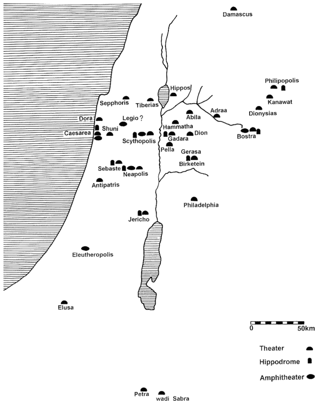
9. kép. Színházak, hippodromok és amfiteátrumok Iudaea/Palaestinában

volt, és a városok is zsidó többségű lakossággal rendelkeztek. Zeev Weiss szavaival élve tehát „a pogány városok sok kísérést rejtettek magukban a Palesztinában élő zsidók számára”. A játékok nagy népszerűsége erős nyomást fejtett ki a rabbikra: így a tannák egyértelmű és határozott tiltását 26 az amórák engedékenyebb szabályozása váltotta fel. 27 Nem véletlen, hiszen például Res Lakis, a híres 3. századi amóra maga is gladiátor volt, mielőtt beállt volna a tanházba. 28 Tel Itunban egy zsidó sírban gladiátor-ábrázolások kerültek elő, és a Bét Seárim-i temető 4. katakombájában egy retiarus és egy murmillio küzdelmét firkálta valaki a falra. 29