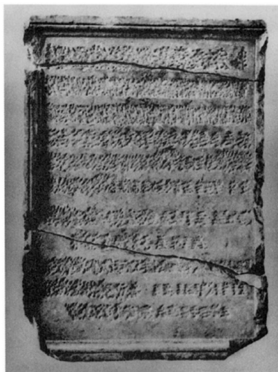
A kitörölt puteoli felirat (jobbra) és túloldalán a praetoriánus gárda katonáit ábrázoló dombormű (balra). University of Pennsylvania Museum, Philadelphia, MS 4916 (Flower 2001, 626 nyomán)