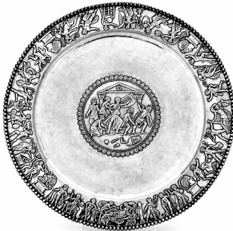
1. kép. A Seuso-kincs részét képező „Achilleus-tál”. Magyar Nemzeti Múzeum

eposzában a hős teljes életrajzának megírására vállalkozott, ám a mű befejezetlenül maradt. 6 Az elkészült valamivel több mint egy ének (összesen 1127 sor) Achilleus gyerekkorát és skyrosi kalandját dolgozza föl. A cselekmény azzal kezdődik, hogy a Paris hajóját megpillantó és a közelgő háború miatt fia életét féltő Thetis elmegy Achilleusért Cheirónhoz, hogy elbújtassa; ez a jelenet bepillantást enged a gyermek Achilleus eddigi mindennapjaiba is (I. 20–241). Ezt követi a skyrosi epizód – és azzal párhuzamosan a görög háborús készülődés – elbeszélése az első ének végéig (I. 242–960). A második énekből elkészült rövid szakaszban kerül előtérbe (ismét) a hős gyerekkora és neveltetése, amikor a Skyrosnak és Déidameiának búcsút mondó hős a görög tábor felé tartó hajó fedélzetén egy önéletrajzi beszédben beszámol Odysseusnak és a többi jelenlévő görög hősnek különleges gyerekkoráról, a Cheirontól kapott fizikai kiképzésről és szellemi nevelésről (II. 1–167). A női ruhában való bujkálás történetét tehát Statius az in medias res irodalmi eszközzel ugyanúgy a szöveg középpontjába állítja, mint a két ezüsttál kompozíciójáért felelős művészek vagy megrendelők.