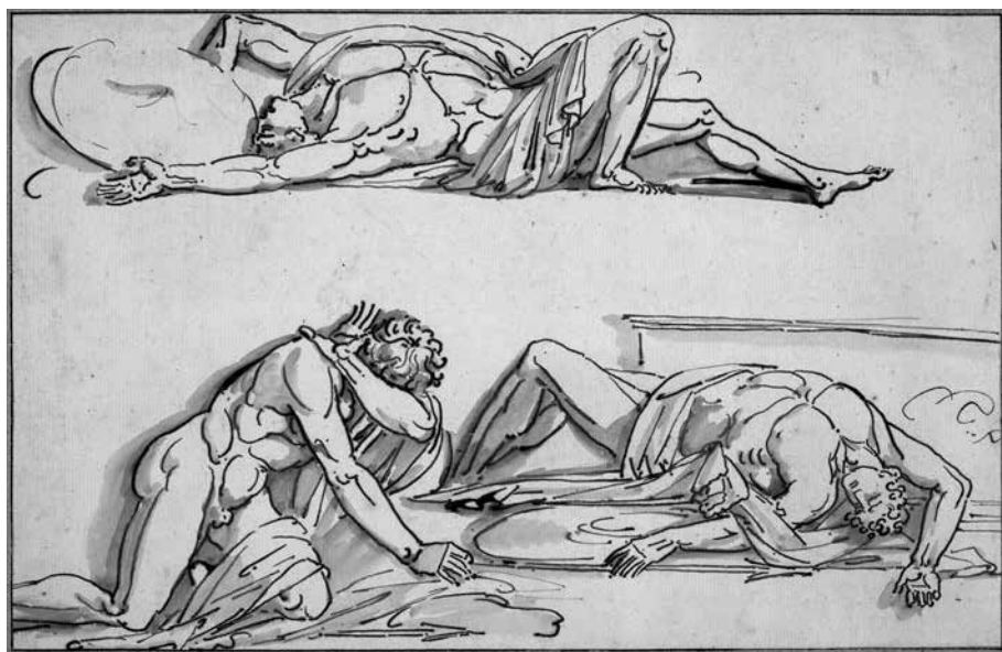
1. kép. Philippe-Auguste Hennequin: Achilleus és Patroklos (1784/1789, tollrajz), National Gallery of Art, Joseph F. McCrindle Collection

Érdekes módon a kortárs adaptáció nem azt kívánja meg elsősorban, hogy az adaptáló szerző saját korának anyagi valóságához igazítsa a történet részleteit, hanem sokkal inkább a kortárs közönség számára jól ismert és így egyér-