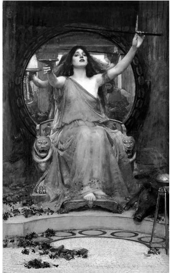
5. kép. John William Waterhouse: Kirké Odysseusnak nyújtja a kelyhet (1891, olajfestmény), Gallery Oldham, Oldham

Miller több fejezetet is szentel a skyrosi epizódnak, de kis csavarral ezt is a két ifjú hős szerelmének megerősítésére használja: az ő verziójában Thetis az, aki mindenkit megtéveszt, és Achilleust kizárólag azzal tudja rávenni a Déidameiával való együttlétre, hogy megígéri neki, Patroklos előtt majd felfedi hollétét. A homoszexualitás vagy a transzvesztizmus ábrázolása tehát nem szerzői újítás, vagy akár a kortárs közízlés irányába tett engedmény, hanem inkább annak jele, hogy Miller meglátta a témában már évezredek óta rejlő lehetőséget a kortárs sikerre. Achilleusért epedve Miller Patroklosa ugyanolyan érzelmi mélységeket tud átélni és megosztani olvasójával, mint ami a romantikus regényekben, különösen az ifjúsági vagy fiatal felnőttek számára írt művekben központi szerepet kap. Az intimitás, az érzelmek részletes leírása pedig ezért teszi ezt a regényt is jóval inkább a női olvasótábor számára vonzóvá, hiszen a férfias műfajként definiált kategóriák, mint a krimi, a science fiction vagy a horror, esetleg a sötét fantasy, jóval kevésbé operálnak ilyen érzelmeleírásokkal, és sokkal inkább a fordulatos cselekményre, a veszélyre és kalandra, a feszültségkeltésre és -oldásra összpontosítanak. Az ifjúsági irodalom viszont különös hangsúlyt fektet az identitáskeresésre, ami a