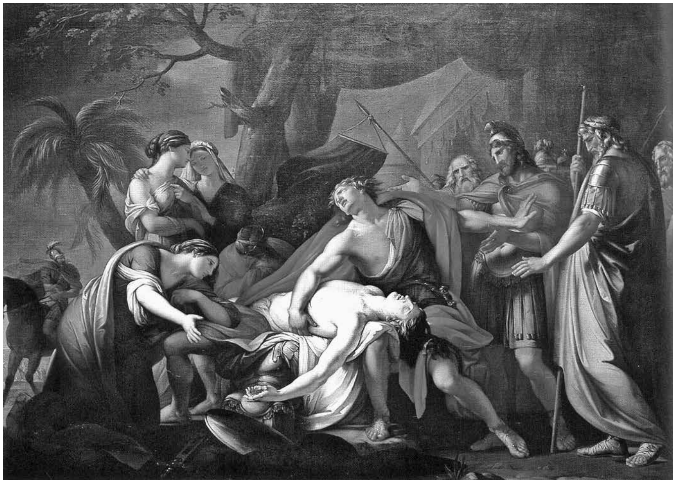
3. kép. Gavin Hamilton: Achilleus Patroklos halálát siratja (1760–63, olajfestmény), National Galleries of Scotland

így találunk híres hősnőket a drámairodalomban is: Euripidész számos női témájú drámája közül az Iphigeneia Aulisban Miller forrásai között is szerepel, de az ifjabb Seneca is írt drámát Médejáról, Phaedráról, a trójai és a föníciai nőkről egyaránt.