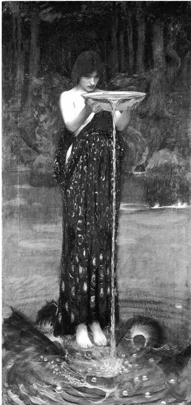
6. kép. John William Waterhouse: Circe Invidiosa / A féltékeny Kírké (1892, olajfestmény), Art Gallery of South Australia

lett hasznosíthatja mindazt, amit ifjúkorában a kentaur Cheirón oldalán tanult. Nem is csupán a csatatér borzalmaitól menekül az összetört testek közé, hanem szinte nosztalgiát érez a gyógyításra váró testek között, hiszen a gyógyszeres üvegcsék és kenőcsök mind ifjúkora legboldogabb éveire emlékeztetik. „Több tucat gyógynövény volt itt, amelyek mind felidéztek bennem a kentaur türelmes ujjait, a rózsaszín barlang édes, zöldes illatát.” 22 Machaón sátrában hamarosan nemcsak a háború sebesültjeit gyógyítja, hanem segít világra hozni a katonák rab-szolganőinek gyermekeit, és közben lassan megismeri a köz-