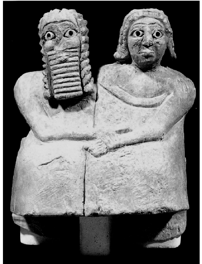
2. kép. Házaspár fogadalmi szobra. Nippur, Kr. e. 26–27. század (Iraq Museum, Bagdad)

Gyakori téma a di tilla -korpuszban a házasság felbontása, a válás is. A szövegekben a házasság felbontásával kapcsolat-