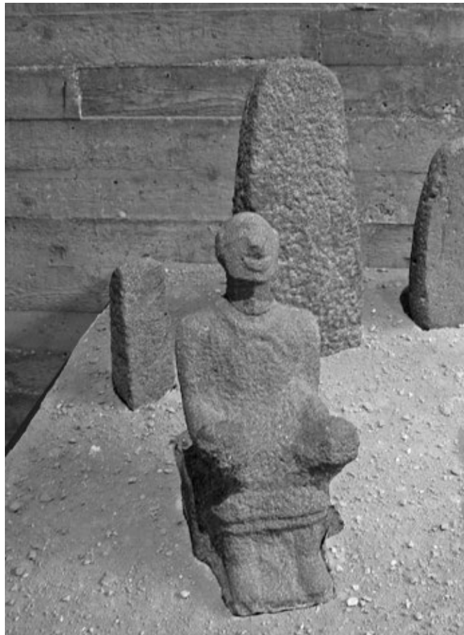
3. kép. Ülő férfialak a sztélék templomából (Area-C)

A lakónegyedekről tehát sajnos igen keveset tudunk, annál több figyelem jutott az alsóvárosban található szentélyeknek. A parttalanságot elkerülendő két templomot említünk csak meg. Elsőként az orthosztát templomot (Area-H), majd a sztélék templomát (Area-C) vizsgáljuk meg kissé közelebbről. Az Area-H templomban, 16 amely esetleg a kései bronzkorban épült, oroszlánt ábrázoló bazalt orthosztátok kerültek elő. Ez a dekorációs elem az észak-szíriai stílus jellegzetességének számít, s ezért valószínű, hogy Hácórba is innen jutott el. Az épület szentélyként való azonosítása több ok miatt is bizonyosnak tekinthető. Előkerült egy füstölő oltár, rajta a viharisten (Hácórban ekkor alighanem Hadad néven tisztelték) emblémájával, valamint egy bronzból készült bikaszobor is – ez utóbbit is könnyen kapcsolatban hozhatjuk a viharistennel. Az Area-C két fázisú templomát a sztélék templomának is nevezik, mert két, egymást követő szezonban először tíz, majd tizenhét darabot sikerült belőlük felszínre hozni. Egyikükön egyszerű, de igen jellegzetes ábrázolást találunk: két felfelé irányuló kéz mintegy rámutat egy kettős Hold-szimbólumra. A szimbó-