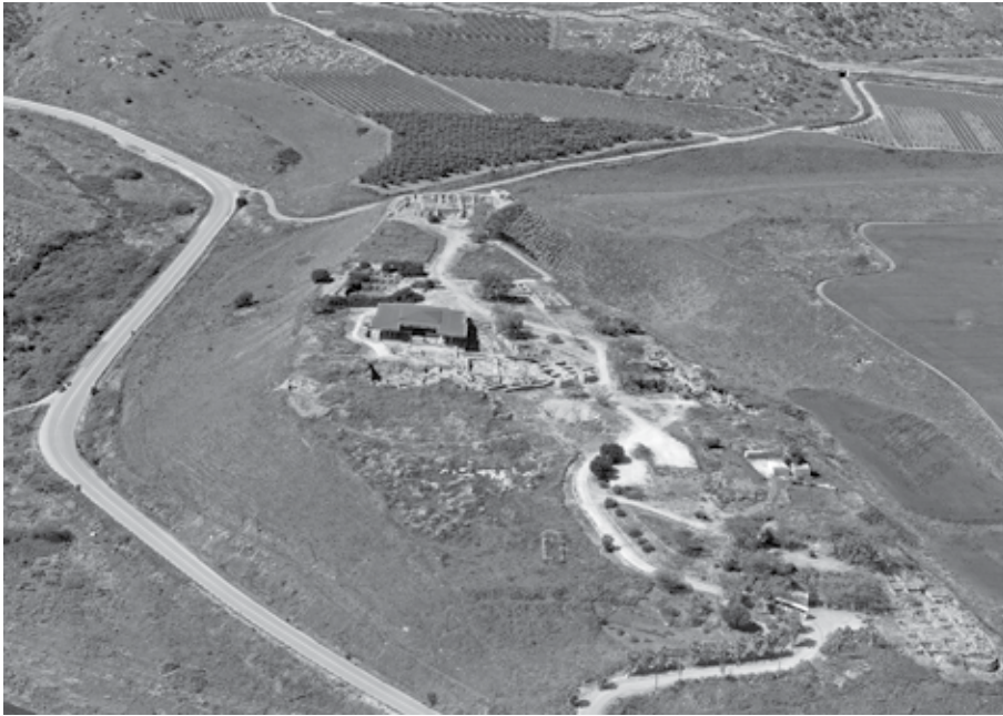
1. kép. Hácór: a felsőváros, tőle jobbra kezdődik az alsóváros

a felsővárost érinti. Hácór a legújabb ásatás során hamar a régészeti viták keresztüzébe került, most is ott található – erről az alábbiakban még szólnunk. A könnyebb tájékozódás kedvéért mellékeljük a tell térképvázlatát, rajta az ásatási mezők betűjelével.