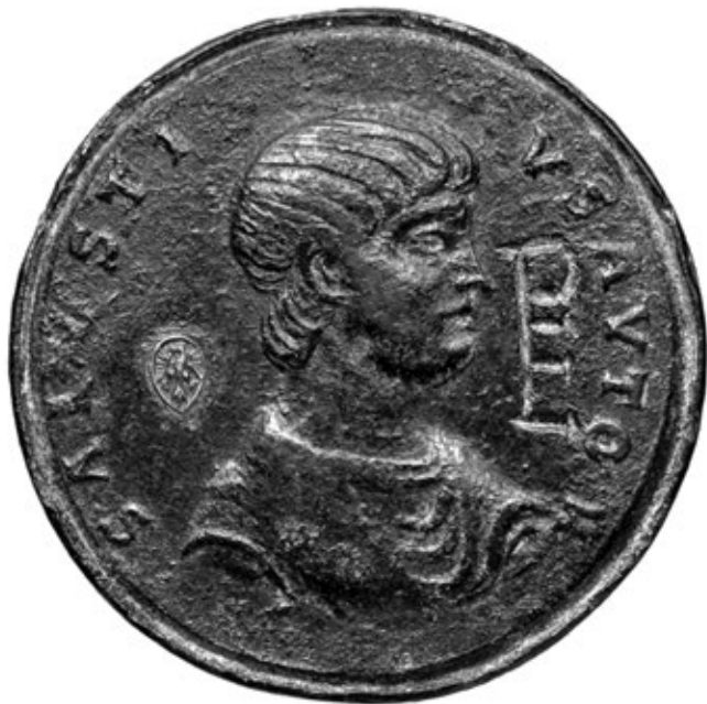
1. kép. Sallustius. Cabinet des Médailles, Bibliothèque Nationale de France, Paris, nr. 17175

években írt Athéni állam című mű szerzője „hitványak”-ra és „jók”-ra osztja fel az athéni polgárokat: az utóbbiak a kevesek ( oligoi ), gazdagok ( plusioi ), értékesek ( chréstoi ), erősek ( ischyroi ), ők a legokosabbak ( dexiótatoi ) és a legjobbak ( beltistoi ), szemben a démosszal , amely mindezeknek az ellenkezője: az ide tartozó emberek értéktelenek, haszontalanok ( ponéroi ), ők alkotják a polis legrosszabb ( to kakiston ) részét. 39 A gondolat persze nem a Vén Oligarchaként emlegetett ismeretlen szerzőtől származik: az évszázadokkal korábban keletkezett Ilias emlékeztető jelenetében 40 Thersités, az egyszerű közkatonai karikatúraszerű ábrázolása nem hagy kétséget afelől, hogy míg a hősök származásukból fakadóan daliásak, bátrak, vitézek, addig a démos képviselőjeként jellemzett Thersités szánalomra sem méltó, hitvány ember, „kinek oly sok rút, zavaros szó járt az eszében”, még akkor is, ha Agamemnónt vádoló szavai tartalmukban megegyeznek Achilleus szemrehányásaival (II. 212–242). A társadalom két részének éles megkülönböztetése a származáson alapszik, a polgárok tulajdonságai, morális kvalitásai kizárólag ettől függenek.