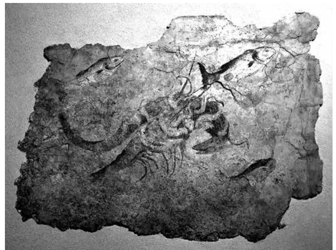
1–2. kép: Két freskó részlete az 1939–1940-ben a Lungotevere di Pietra Papa területén felfedezett római fürdő egyik terméből. Róma, Palazzo Massimo.