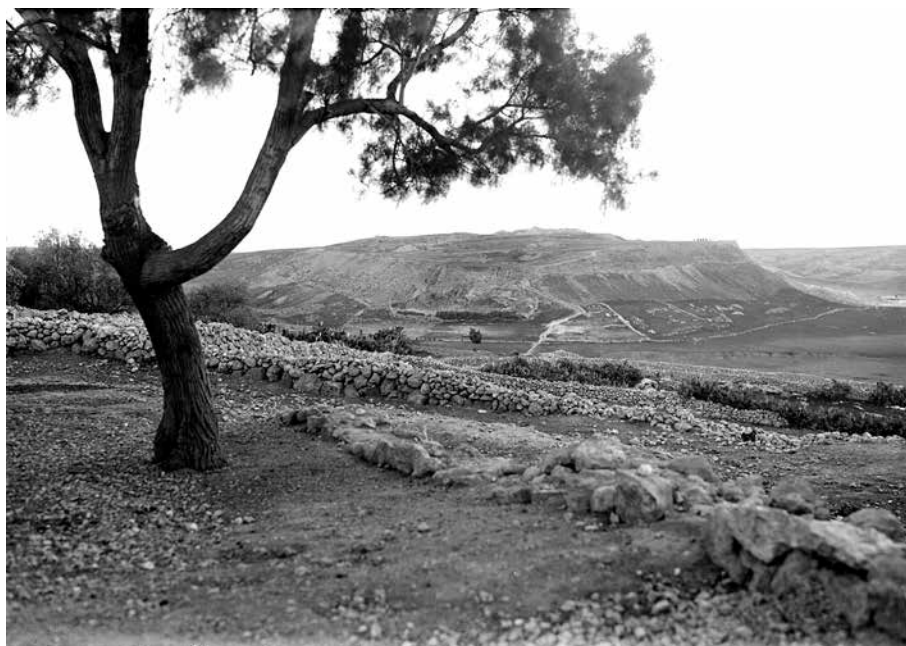
3. kép. Lákis tellje

Am maga a lista mindeme bizonytalanságok ellenére is igen fontos adatokat közöl jelen kérdésfeltevésünkkel kapcsolatban. A Józ 15,37–41 Júda egyik délnyugati kerületének városi központjaként említi Lákist. Tizenhat várost említ a szöveg, de ebből Lákis mellett mindössze három azonosítható. 18 Ami ennél fontosabb, hogy úgy tűnik, minden városhoz, így Lákis-