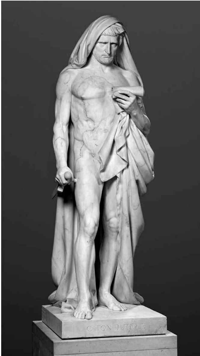
1. kép. Jean-Baptiste Roman az ifjabb Catót ábrázoló szobra (1840). Musée du Louvre.

hez hasonló korpusz, amely közvetlenül Cato önreprezentációját tükrözné. Így szükségszerűen olyan forrásokra (jelen esetben főként Sallustiusra) vagyunk utalva, melyek Cato tudatos önreprezentációjának ismeretében, már annak hatása alatt formálnak véleményt politizálásával kapcsolatban. Ugyanakkor, ha szem előtt tartjuk Cato tudatos imázsépítését és ennek közvetlen és közvetett hatását az ókori szerzőkre, a meglévő forrásokat is pontosabban érthetjük, illetve új megvilágításban láthatjuk.