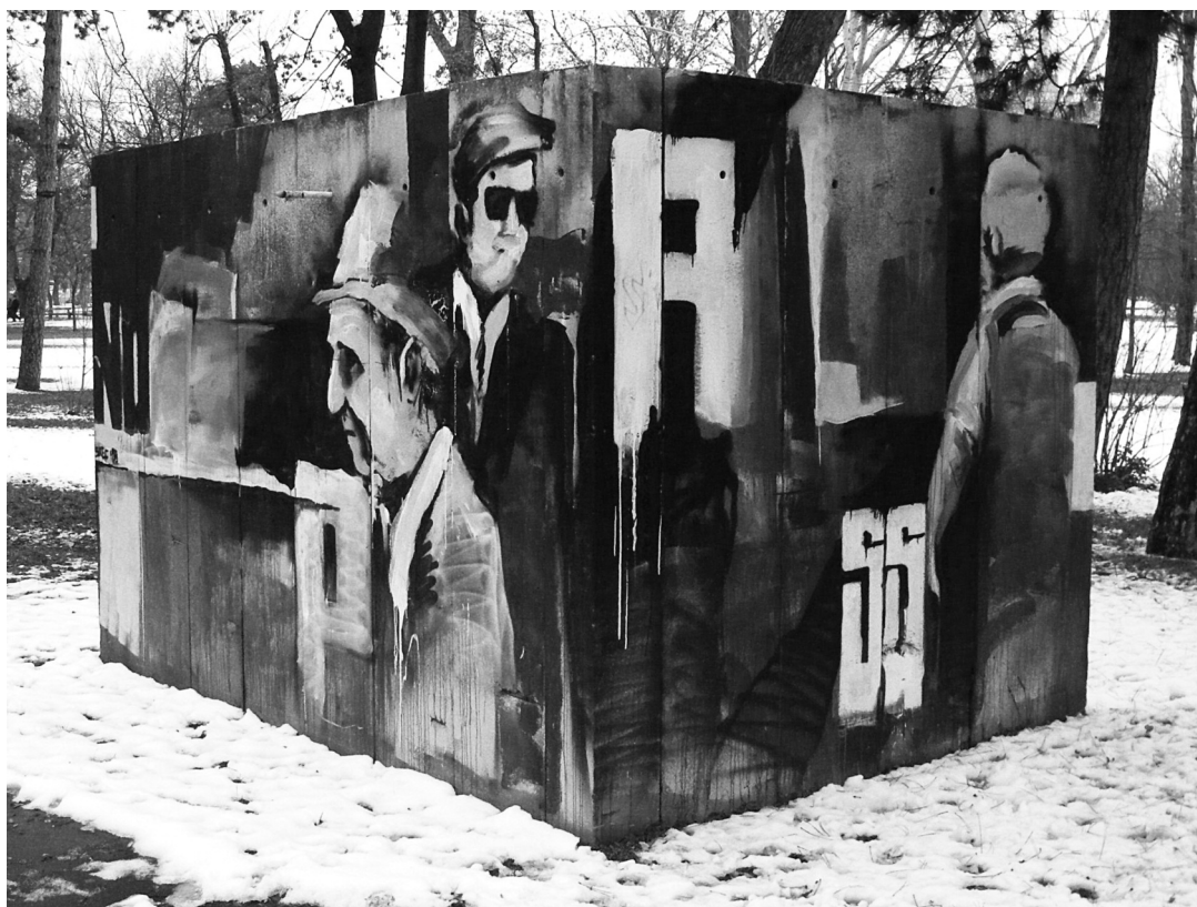
Murál 2 , részlet, 2009. Budapest, Városliget

A Holmes-folytatások és -újraírások irodalma azonban nem ebbe a kategóriába tartozik. A szóban forgó művek nem Doyle nevét, hanem csak történeteinek főszereplőit veszik kölcsön, s ruházzák fel hol szerzői, hol narratív funkcióval. Conan Doyle legfeljebb csak utalásként vagy, nem egy példa van erre is, a regény egyik szereplőjeként jelenik meg. Legyen szó a misztifikáció bármilyen formájáról is, valamilyen paratextus mindig jelzi, ki az adott regény vagy novella valódi szerzője (a 18. században kialakuló, de ténylegesen a romantika idején meghonosodó írói gyakorlatot követve leggyakrabban