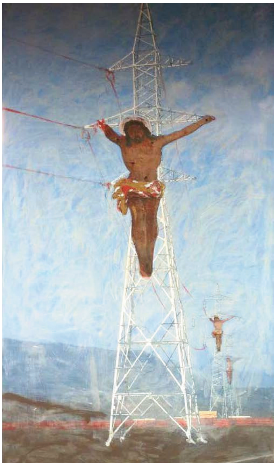
PléhKrisztus sorozat, 200x100 cm, C-print, olaj-vászon, 2012