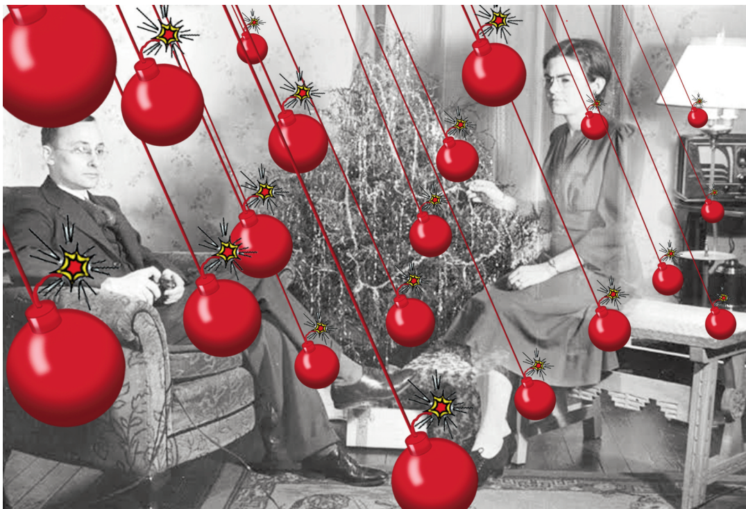
Csillaghullás. Digitális grafika, 2011

É. hajfátylán keresztül újabb füstfelhők szállnak az ég felé, próbálják eltakarni a még mindig szakadatlanul tűző, öntörvényű napot.