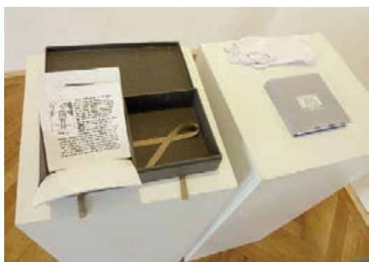
A korai évek – André Kertész. Papírkivágás, teljes vászonkötés, kontaktmásolat (fotó), kasírozott kartondoboz. Könyv: 15x15 cm, 160 oldal, fotók: 13x13 cm / 9x13 cm, 94 darab (2012–2013)