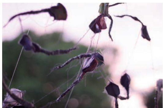
Céllal I. - installáció, textil, céna, 2015