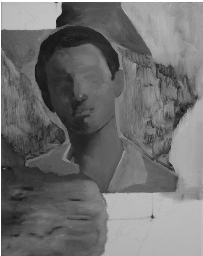
Mosoly , 40x50 cm, olaj, vászon, 2018

Veres Attila novelláskötete azok az olvasókat célozza meg, akik szeretik az abszurd és groteszk megoldásokat a szövegeken belül, a fantáziadús, ámbar borzongással teli helyszíneket, akik a hétköznapi egyhangúságból a megmagyarázhatatlan, megválaszolatlan kérdésekkel teli világokba menekülnének.