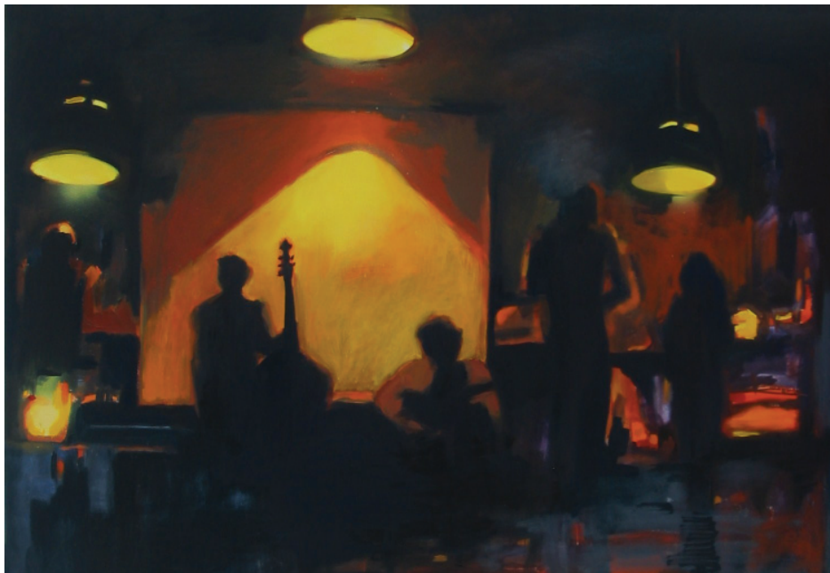
Jazz- improvization (Fények sorozat, 2010), olaj, vászon, 70 x 90 cm

az égből, hogy bár egy könnycsepp gördüljön le az arcán, a félszemű, csalános éjszakát siratva. Követi magát, előreengedi végzete, sorsa.