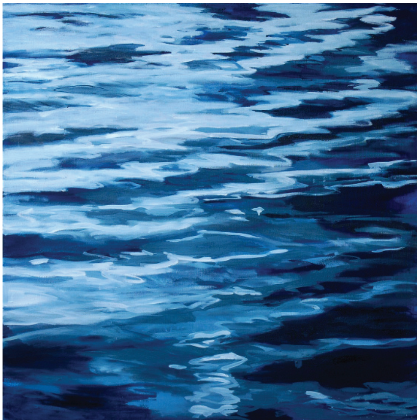
Reflexek V. (2013), olaj, vászon, 100 x 100 cm