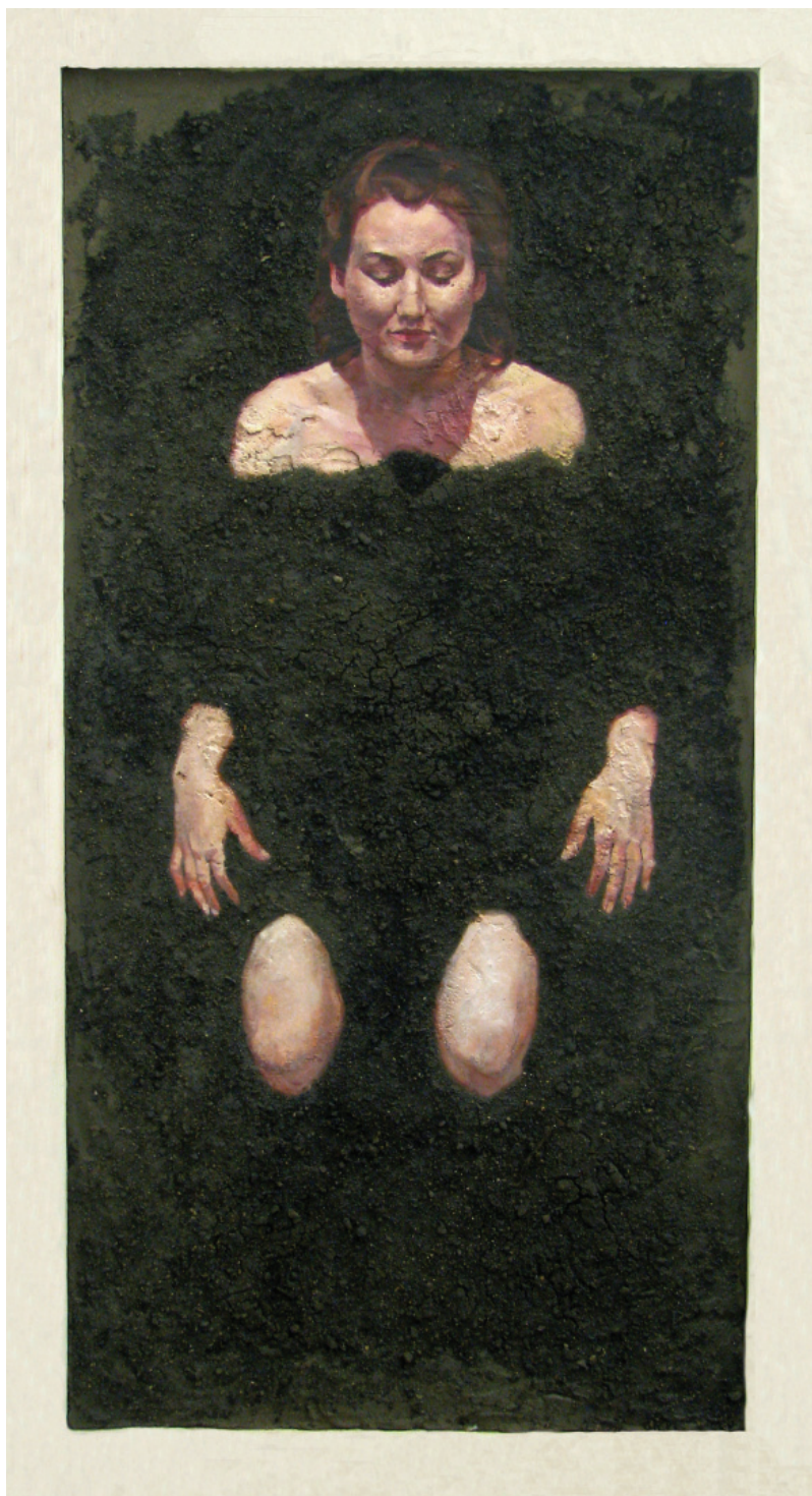
Állapot (2009), vegyes technika, 74 x 141 cm