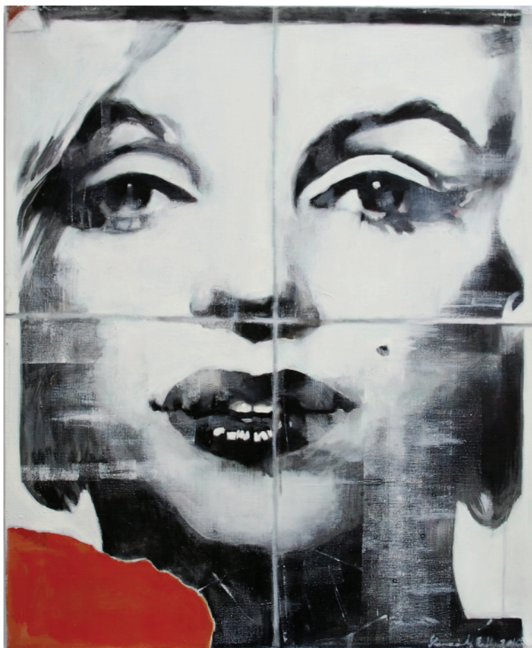
MM I. (2010), olaj, vászon, 90 x 75 cm

oldalzsebedből pitypang esett a csillagokra