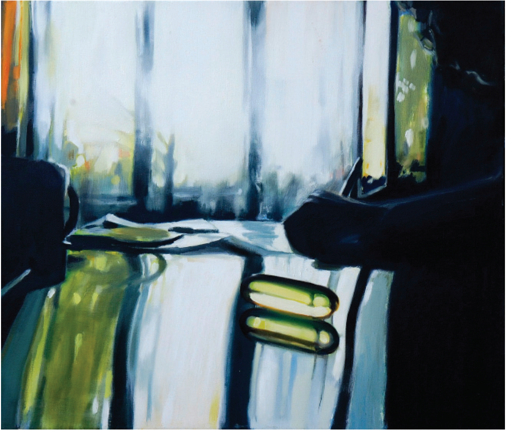
Konyha II. (Fények sorozat, 2010), olaj, vászon, 60 x 70 cm

szet született meg, a világon elsőként Brazíliában, hanem Guimarães Rosa Joyce művészetét idéző, világirodalmi mércével is jelentős regénye, a Grande Sertão: Veredas ('A nagy bozótos pusztaság: Ösvények', 1956), amely a hatalmas és szerencsés kísérlet az észak-keleti Brazília nyelvi újratemtésére.