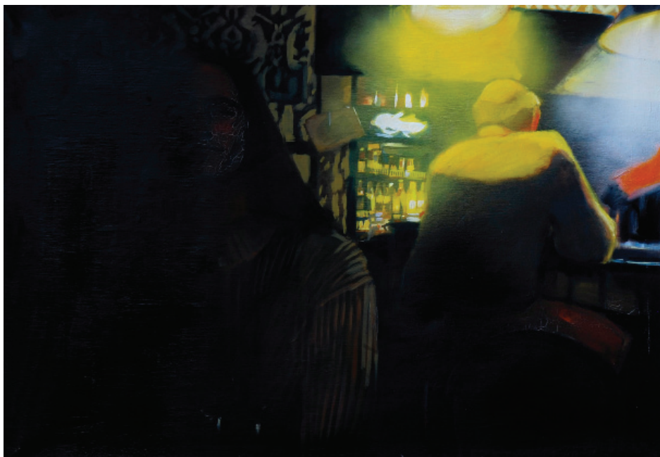
Pub (Fények sorozat, 2010), olaj, vászon, 70 x 100 cm

Planet Earth is blue and there's nothing I can do.