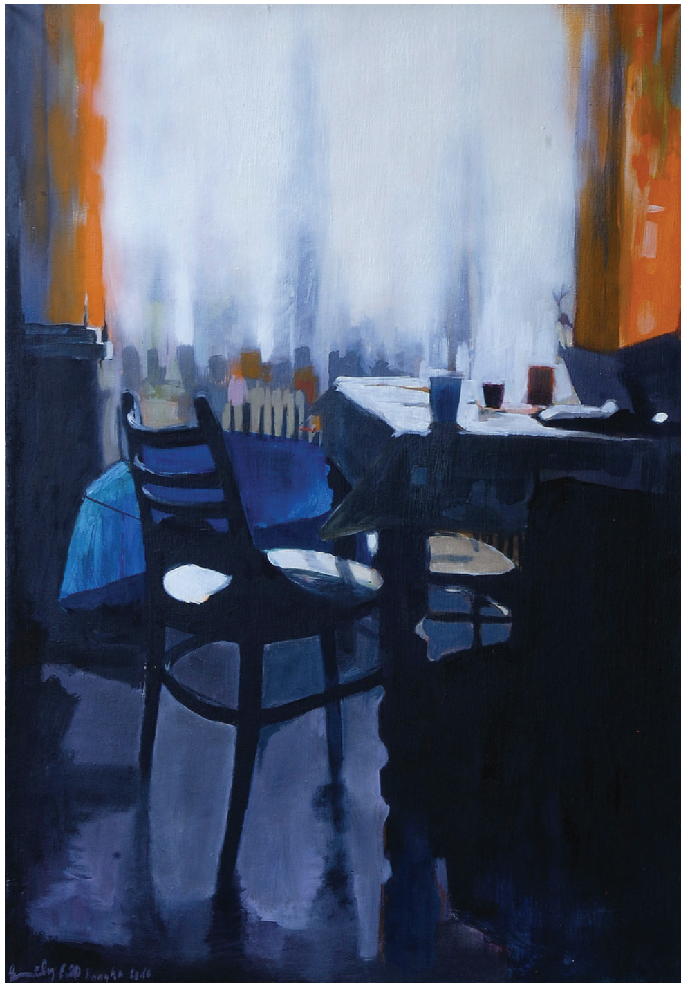
Konyha I. (Fények sorozat, 2010), olaj, vászon, 70 x 100 cm