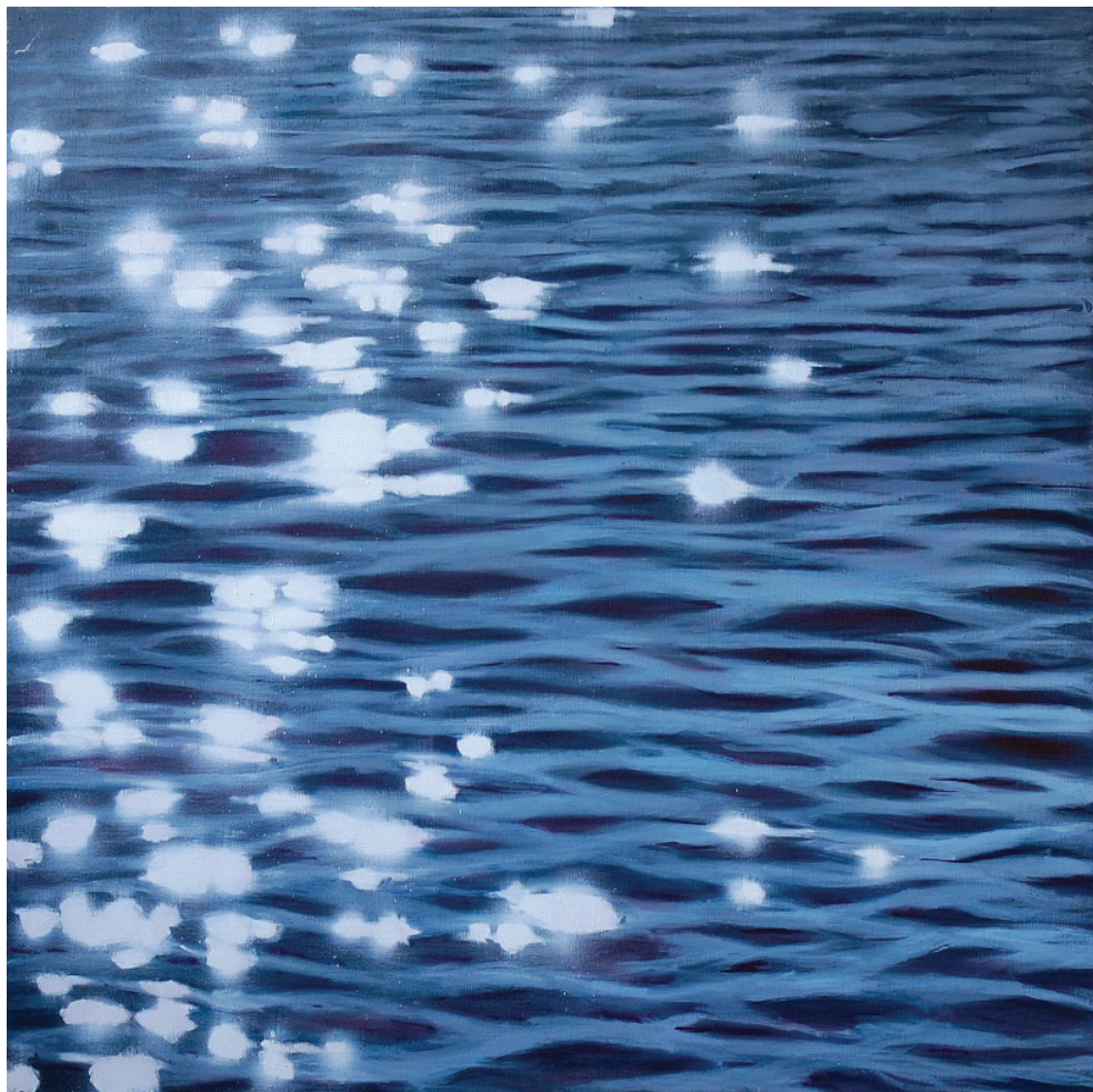
Reflexek IV. (2013), olaj, vászon, 100 x 100 cm