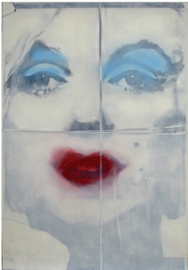
MM II. (2011), olaj, vászon, 70 x 100 cm