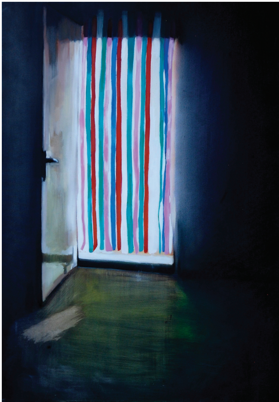
Ajtó (Fények sorozat, 2010), olaj, vászon, 70 x 100 cm