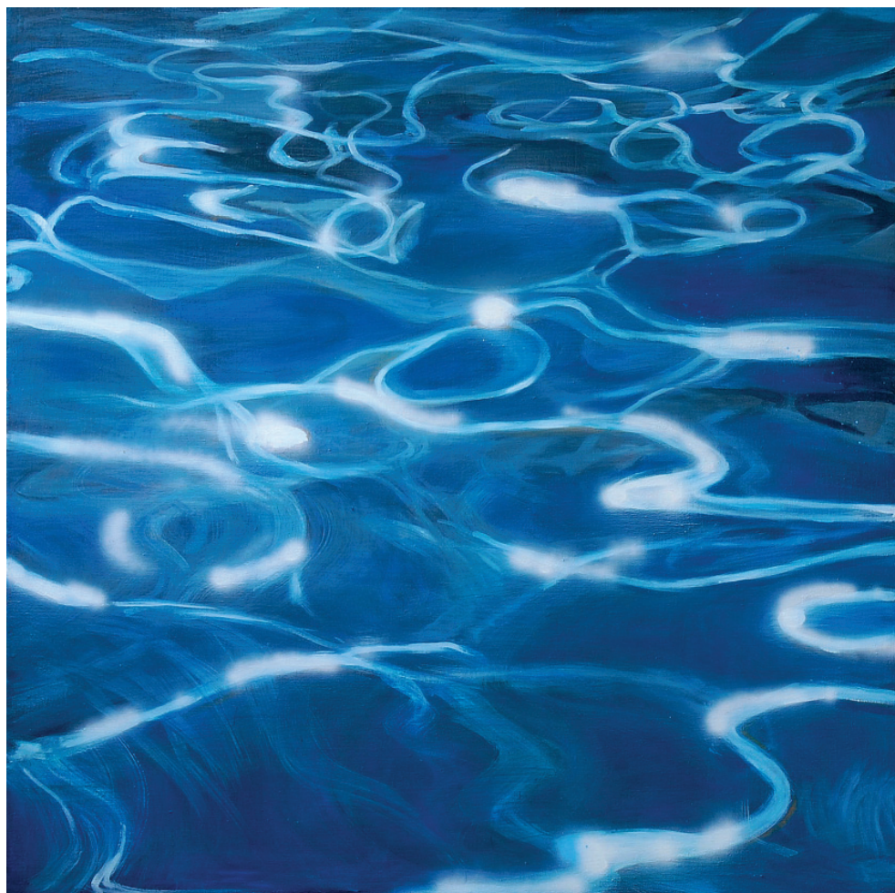
Reflexek VI. (2013), olaj, vászon, 100 x 100 cm