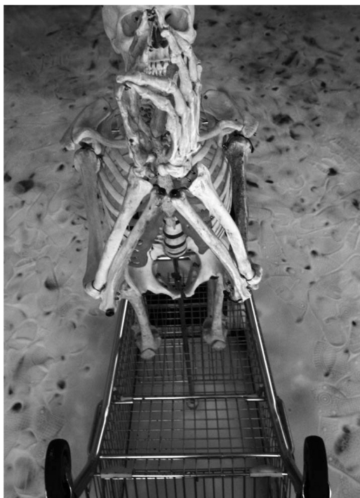
F. R.: In nomine libertatis , interaktív installáció, 2008

2008. JÚLIUS 21. MŰVÉSZETI ÉS MŰKERESKEDELMI FOLYÓIRAT ÁRA 666 FT